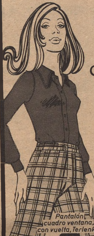
Pantalón cuadro ventana con vuelta, Terlenka