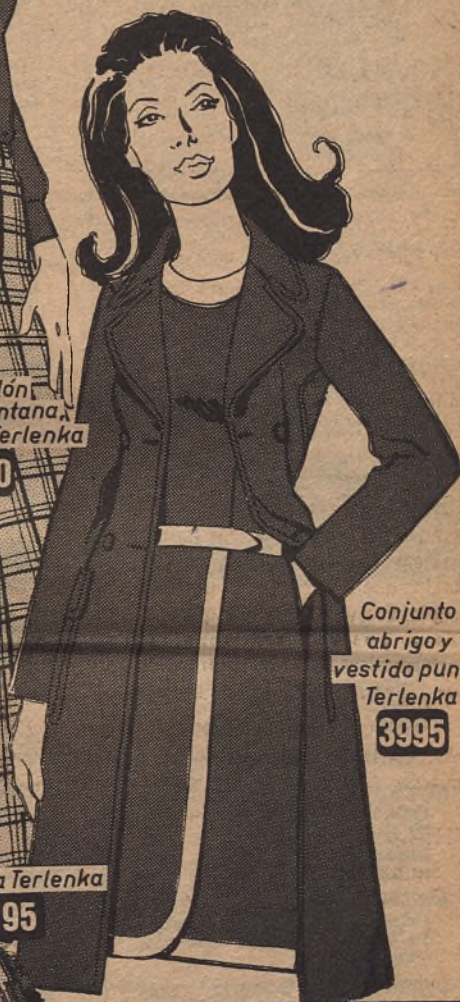
Conjunto abrigo y vestido punto, Terlenka