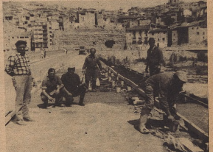
Hace unos meses publicamos esta foto dándoles cuenta del comienzo de las obras. Recuerden la estrechez de las antiguas aceras y la amplitud de las que ahora disfrutamos y convendrán con nosotros en que si han sido muchas las molestias que hemos soportado, merecía la pena.

—¿Dificultades? — Pues muchísimas teniendo en cuenta que no se cerró el puente a la circulación y que la obra en