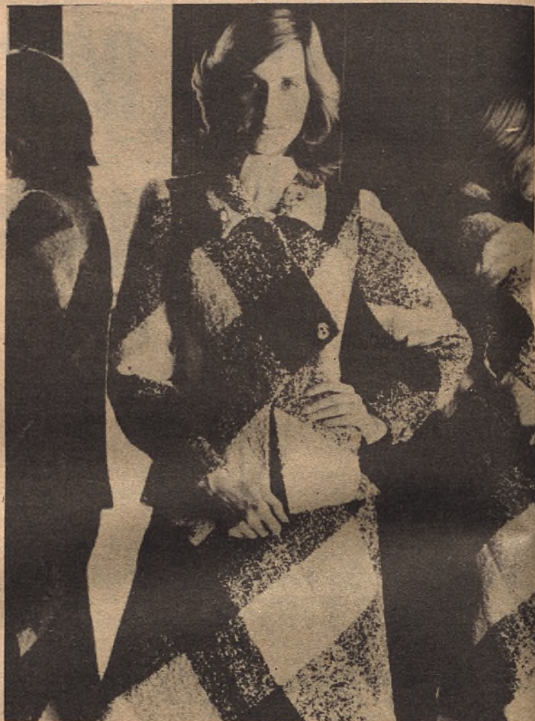
material de múltiple aplicación en los cardigan, prenda que marca la temporada

En la realización de tejidos para vestidos emplea, además del mohair, souples y voile de lana, dejando de lado el punto, el