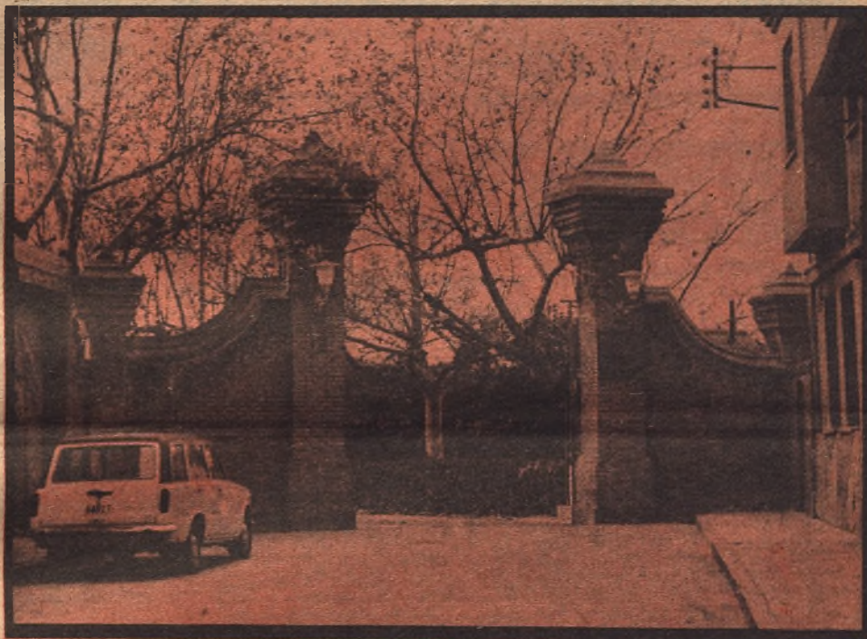
Hospital Psiquiátrico Provincial de Zaragoza.

En nuestras provincias hay 275.000 enfermos mentales, subnormales y alcohólicos