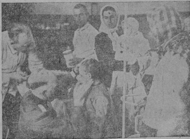
Médicos de la sanidad militar alemana asisten, solicitos, a la población civil rusa, que los incendiarios rojos dejaron en la miseria.