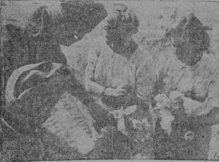
Muchachas germanas ofrecen flores a las tropas alemanas que están liberando a su país del yugo bolchevique.

Vichy, 12.—El embajador norteamericano, Almirante Leahy, ha sido recibido por el Mariscal Petain. La entrevista duró veinticinco minutos y se han tratado todos los asuntos de actualidad.—EFE.