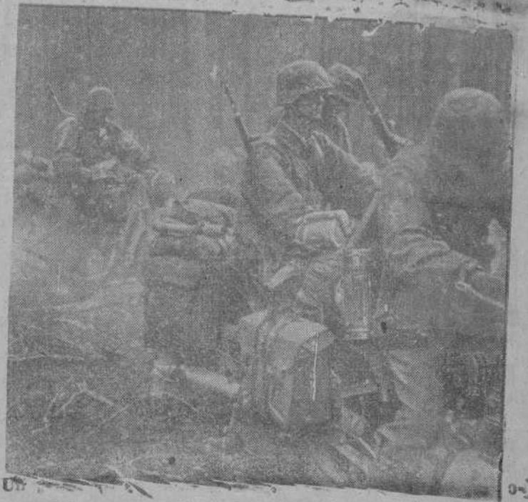
viético a pesar de las dificultades del terreno.

Washington, 18.—Roosevelt ha recibido en la Casa Blanca a todos los jefes parlamentarios que tienen relación con los asuntos exteriores.—EFE.