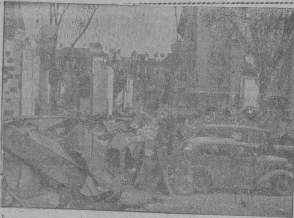
Restos de una columna motorizada soviética encontrados por las tropas alemanas en Smolensko