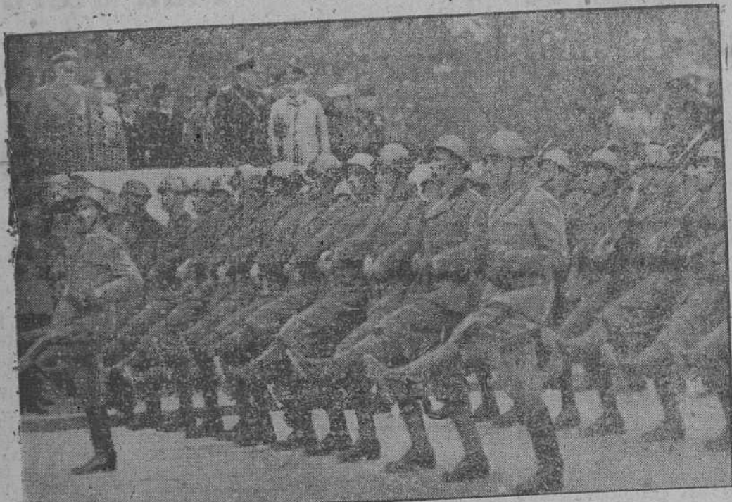
Desfile de tropas italianas con el paso romano ante los jefes militares de los dos países