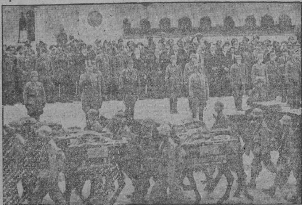
Revista de las tropas alemanas ante el maris cal List