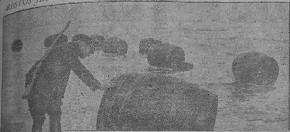
Restos alemanes han encontrado en un sector del Atlántico 300 barriles del mercante francés "Le Guilvinec", hundido por los ingleses

10 de abril de 1941 RESTOS ARROJADOS POR EL MAR EN LA COSTA DEL ATLANTICO