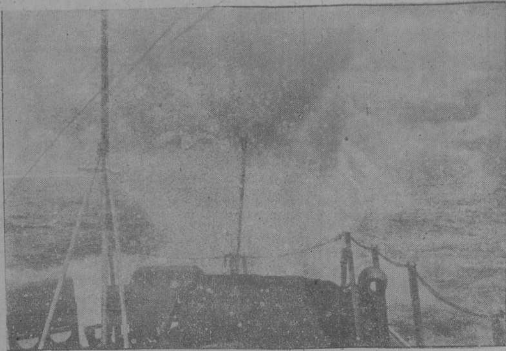
EL BUQUE ALMIRANTE DE UNA FLOTILLA DE TORPEDEROS ALEMANES, DE SERVICIO EN EL MAR DEL NORTE, ENVUELVE A LAS UNIDADES EN UNA DENSA CORTINA DE NIEBLA ARTIFICIAL