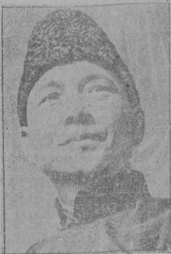
El jefe del Gobierno nacional chino, Wangchingwei, cuya legitimidad fue reconocida formalmente en el pacto chino-japonés.

Comienza diciendo que los acontecimientos históricos desarrollados en el año que acaba de terminar y su significación revolucionaria para la marcha futura de la Humanidad, solo pueden ser reconocidos en su conjunto por las generaciones venideras. Hace historia de la subida al poder del Nacional-socialismo y de su voluntad decidida de forjar el porvenir de la nación mediante un trabajo pacífico. Una llamada a la conciencia de las naciones fue desoída por los enemigos del Reich. Alude a la campaña de boicot iniciada contra Alemania y se ocupa de la guerra actual para afirmar que los dirigentes de los países democráticos son propietarios o accionistas de las fábricas de arma-