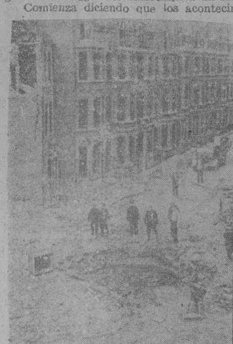
LOS ATAQUES DE REPRASALIA CONTRA LONDRES Manzanas enteras desaparecen de la noche a la mañana

Berlín, 31.—Con motivo del año nuevo, el Führer ha dirigido al Partido Nacionalsocialista un mensaje.