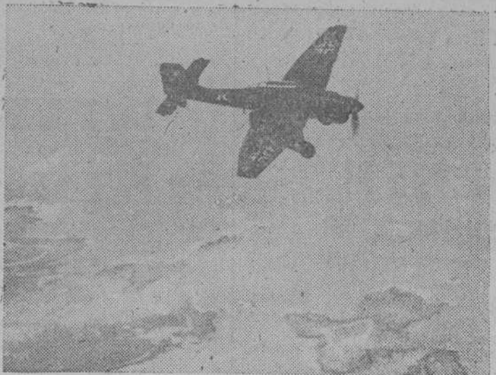
Un avión de bombardeo alemán ataca en picado los objetivos señalados por el mando

Roma, 9.—El Duce ha concedido la Medalla de Oro del Valor Mi- litar a la memoria de Italo Balbo. Por el mismo real decreto, los que perecieron con el mariscal Balbo, son condecorados con la Medalla de Plata del Valor Militar.—EFE.