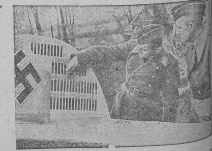
El aparato de caza del Teniente Coronel Mölders que hasta fecha lleva apuntadas 54 aviones derribados al enemigo.