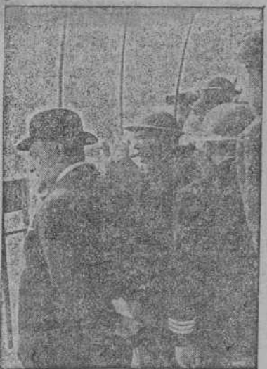
Mr. Churchill, cigarro en ristre y con bombín de acero, asiste a una lejana batalla aérea, en busca de nuevas inspiraciones para la nueva charla parlamentaria.