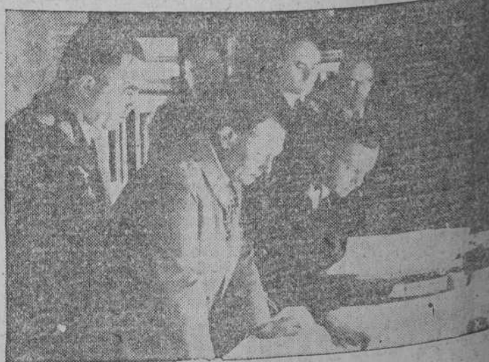
El Mariscal del Reich Hermann Goering, rodeado de oficiales de su Estado Mayor, mira sobre el mapa una batalla aérea contra Inglaterra.

Instalación modernísima. Especialidad en pan de lujo.—Se reciben encargos en el teléfono 1336.—Calle Colón.