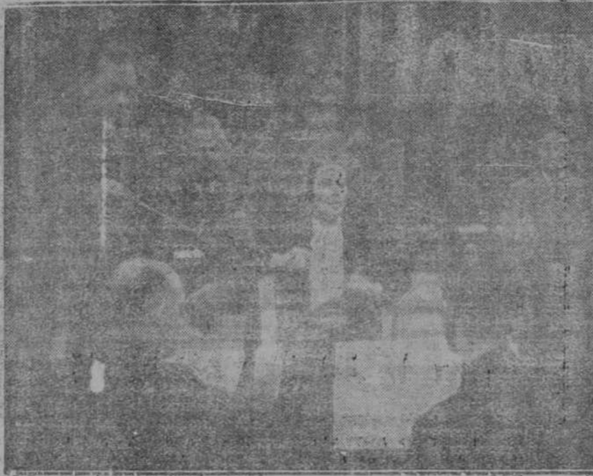
ESTRELLITA CASTRO, figura de gran relieve en el cine, en un momento de la impresión gramofónica de sus últimos filmes.

Otro día seguiremos con tan interesante tema.