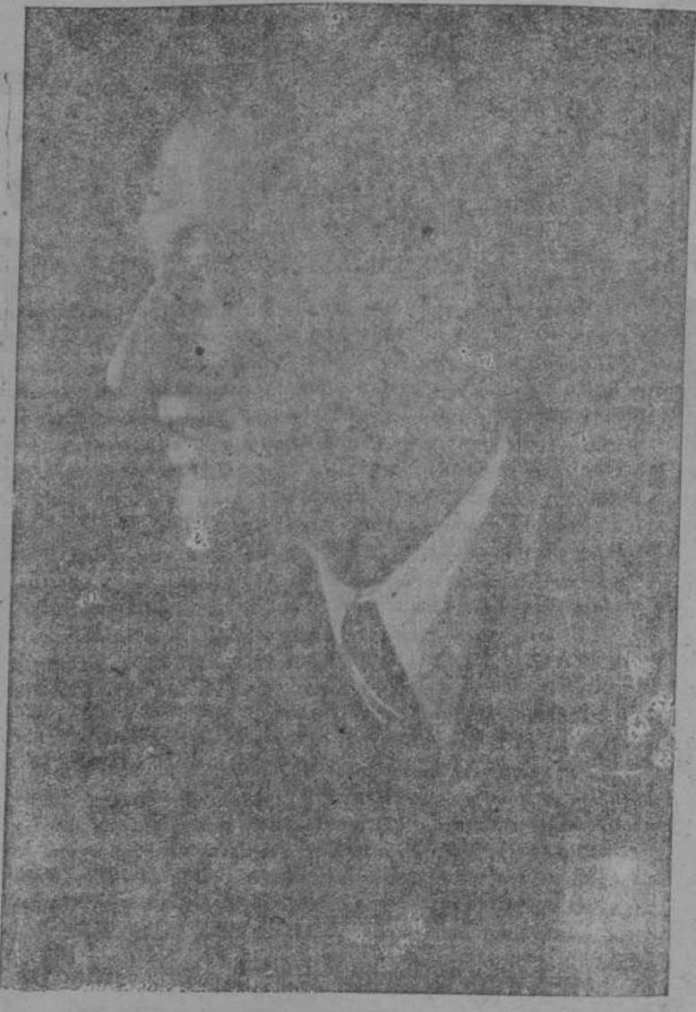
El actor Marcos Redondo encarna todas las glorias de aquel teatro que parecía perdido hasta que ha encontrado en él el hombre capaz de llevarle a la máxima exaltación.