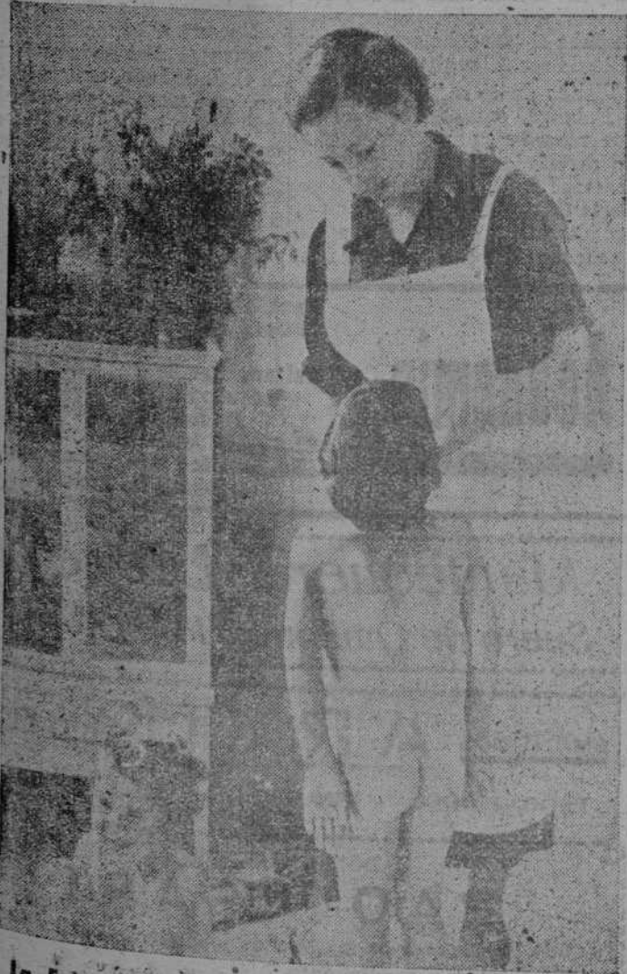
La Falange femenina, módulo vital y cariñoso del Hogar Infantil

Esta misma noche salieron numerosísimas personas para nuestra capital para asistir a la sesión de clausura del Consejo Nacional de la Sección Femenina.