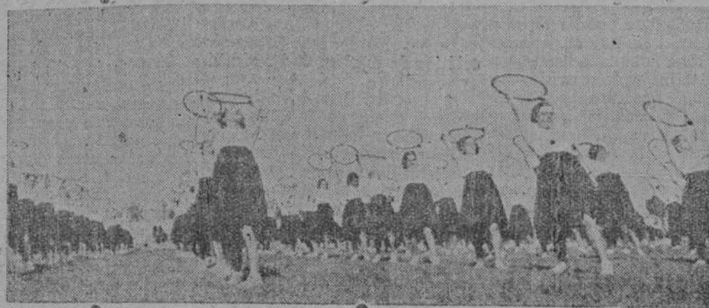
Nuestras Falanges femeninas, promesa segura de madres españolas, sanas, fuertes y alegres

Ayer las Congresistas visitaron, Toro y Benavente