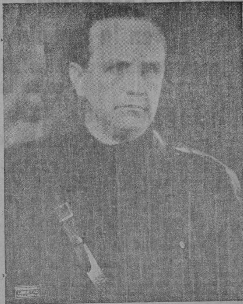
El Excmo. Sr. Ministro de Agricultura y Secretario General de la Falange, camarada Raimundo Fernández Cuesta, que llegó anoche a nuestra capital, y que hoy presidirá, en el Teatro Principal, el acto de clausura del Consejo Nacional de la Sección Femenina.