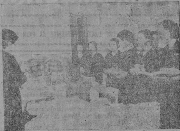
ASISTENCIA A FRENTES Y HOSPITALES: exponente magnífico de la ternura en la Falange femenina.