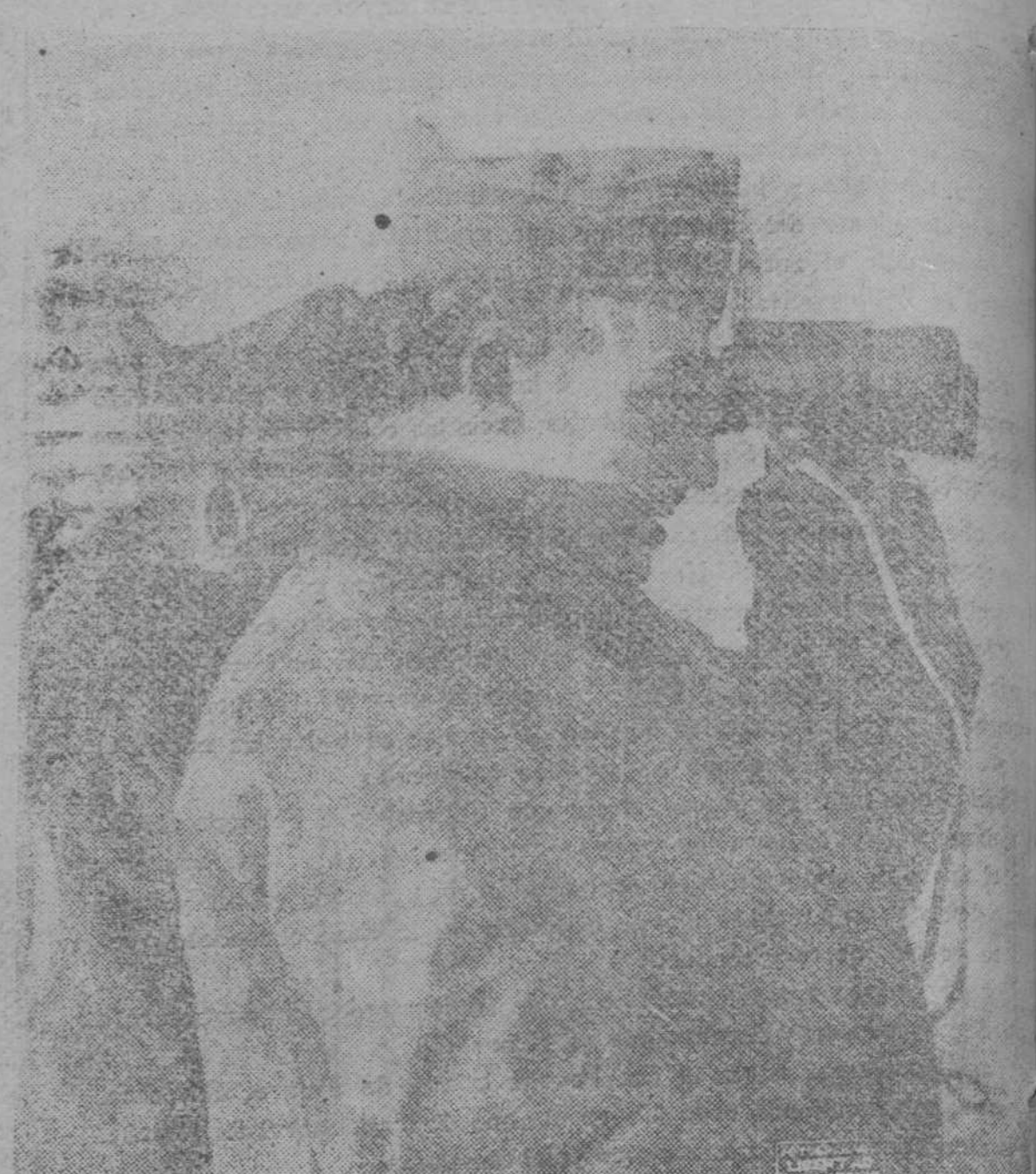
de combate, bajo las Banderas de la Falange de todas las regiones de España—Navarra, Castilla,

lo heroico, censuró nuestro estilo y ridiculizó nuestra nomenclatura. Nuestra agrupación en células militares, la resurrección y el bautismo de nuestras enseñanzas guerreras, les sacaba de quicio. Acostumbrados al péfido desarrollo de sus instituciones juveniles—un buen local, unos cuantos juegos de dominó, conferencias mensuales y asambleas estériles donde se templa ya el afán parlamentario de los jóvenes viejos—, lo nuestro les pareció, sobre atrevido, desorbitado. Pronto la realidad les sacó—les ha debido sacar—de su error.