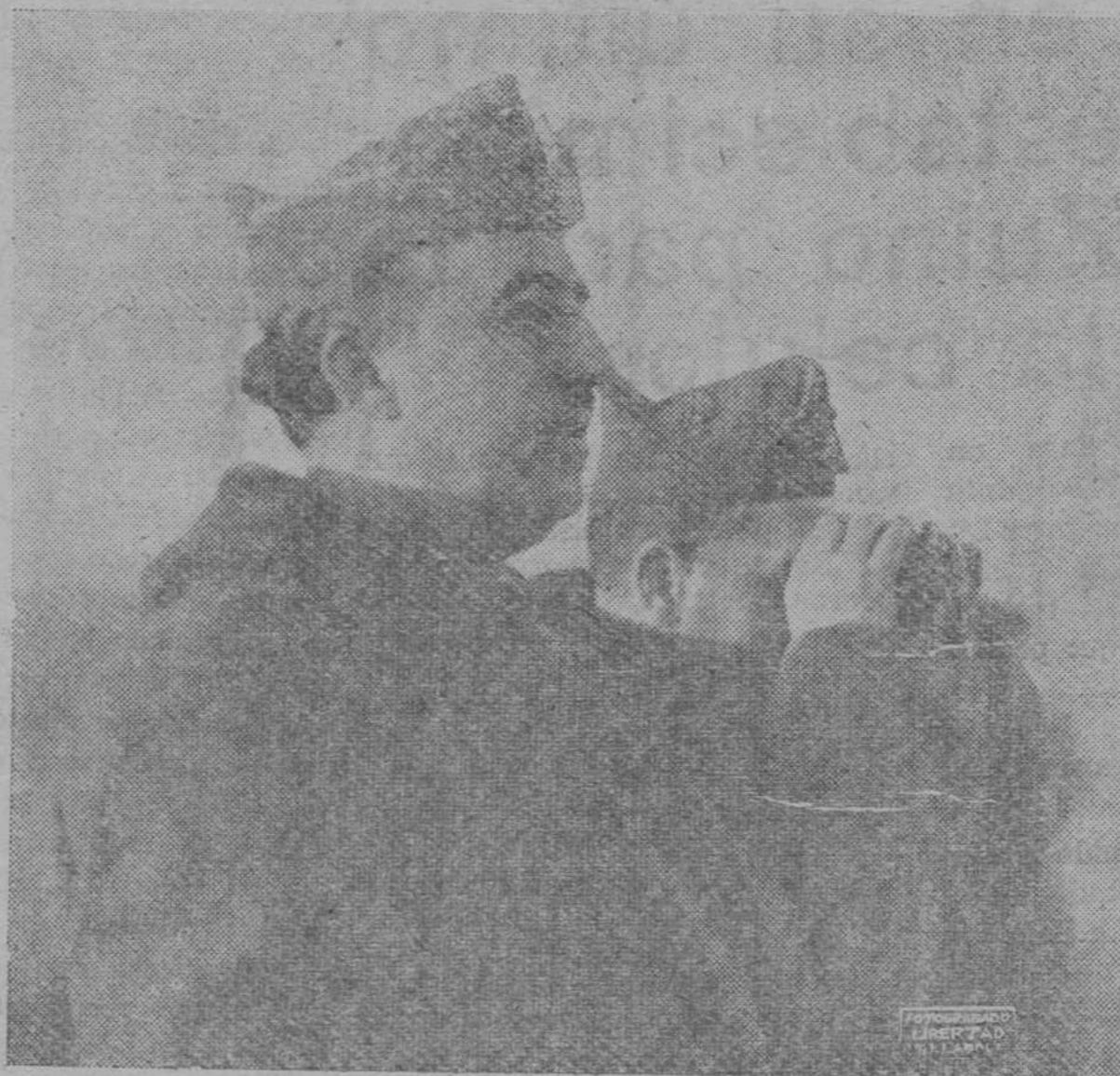
Galicia, Aragón, Málaga, León—los camaradas de la boina roja y

anquilosadas, hervidas de la preocupación cobarde y temerosa del liberalismo, gente que por el envenenado había perdido el gusto y la comprensión de lo activo y