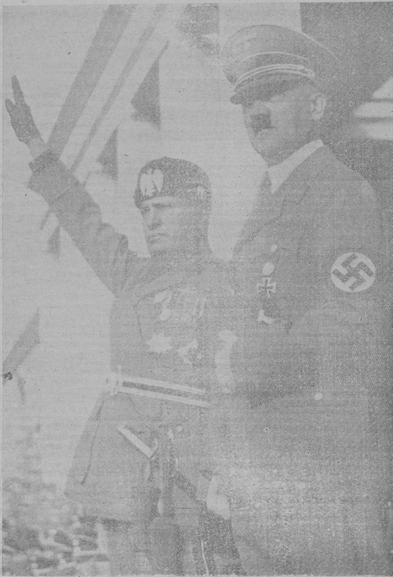
Hitler y Mussolini, las dos figuras centrales de Europa, en torno de los cuales gira la política del Mundo, que en estrecha colaboración trabajan por la Paz, sin la cobardía de rehuir las posibilidades de una guerra, y que ahora, bajo el cielo luminoso de Italia establecieron los vínculos cordiales del eje Roma-Berlín. He aquí a los dos insignes conductores de Imperios presenciando el reciente desfile celebrado en Roma con motivo de la visita del Führer-Canciller.

(To s e r i b e n a p o r e v i s i ó n)