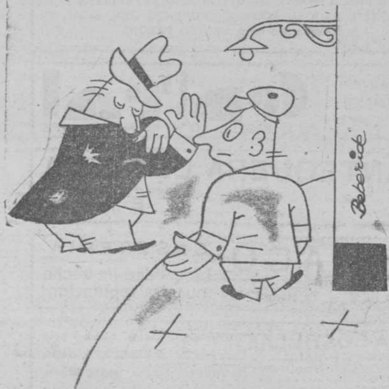
--Caballero, lleva usted un siete en la americana. --¡Caramba! ¿habré perdido el otro?