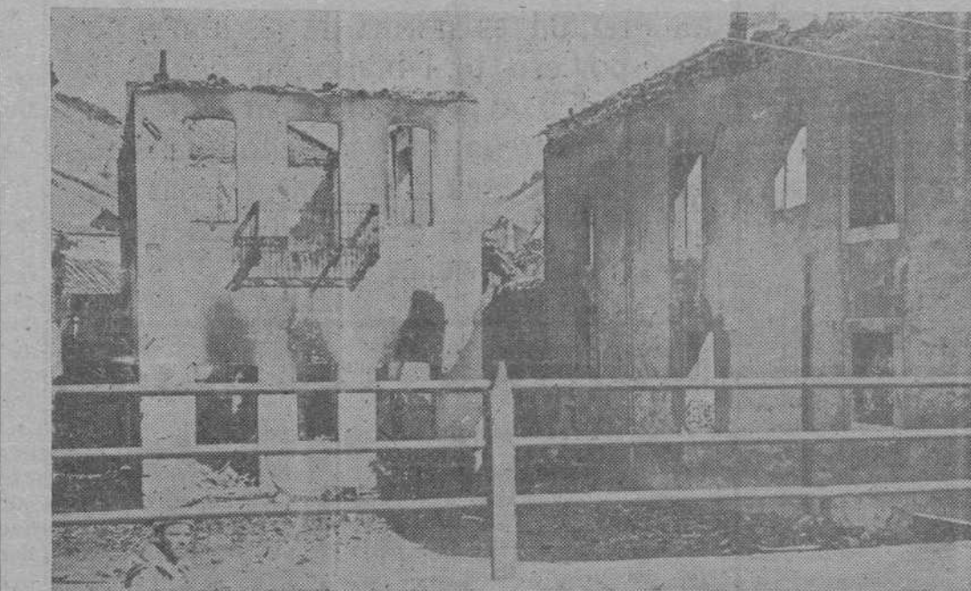
SANTA LUCIA.—Por aquí pasó la horda roja.

“Haz que la sangre de los nuestros, Señor, sea el brote primero de la redención de esta España en la unidad nacional de sus tierras, en la unidad nacional de sus clases, en la unidad espiritual en el hombre y entre los hombres, y haz también que la victoria final sea en nosotros una entera victoria española del canto universal de tu gloria.”