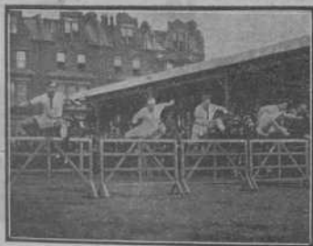
Concurs de saltadors, a Cambridge

Passaven les hores i l'emoció anava creixent. Per Les Rambles els vàrem veure i tot eren preguntes. A «Canaletas» hi havia gran generació que esperava, també, sapiguer el resultat del partit.