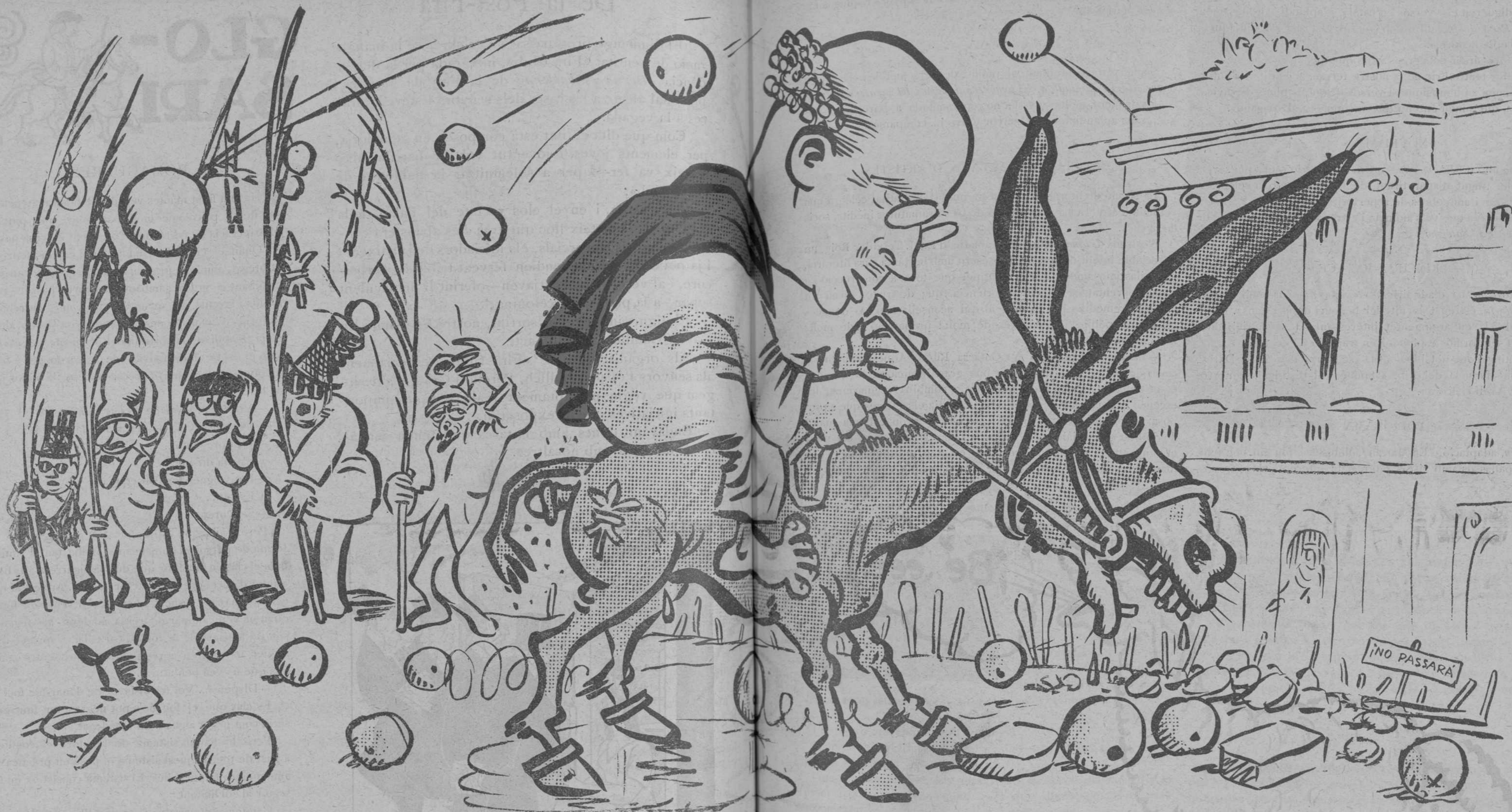
L'entrada del nou batlle, marqués d'Alella, a la Jerusalem Municipal.

Allí li allargà una cerilla, amablement: —Si és servit. —Gràcies.