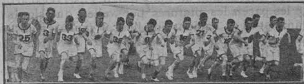
Les curses a peu, a Anglaterra.—Un trollo castig