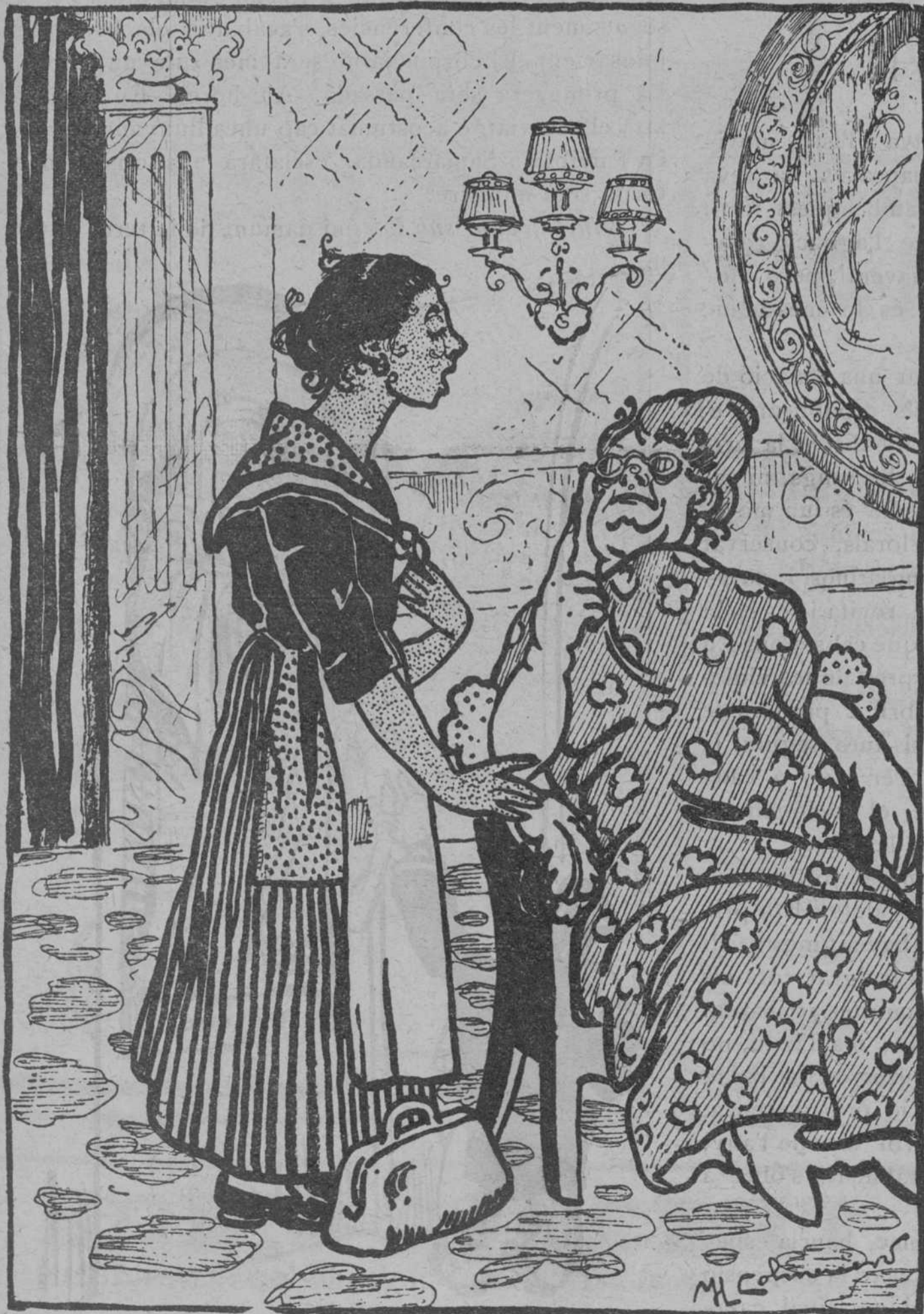
LA MINYONA NOVA

—Sobre tot la llimpesa. Armoris, calaixeres... —Descuidi, senyora. No se'n adonarà que ho trebarà tot nèt.