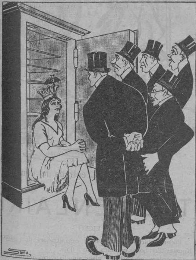
DAVANT LA CAIXA

—Aquest cop sí que la tasca regidoresca haurà d'ésser ben desinteressada.