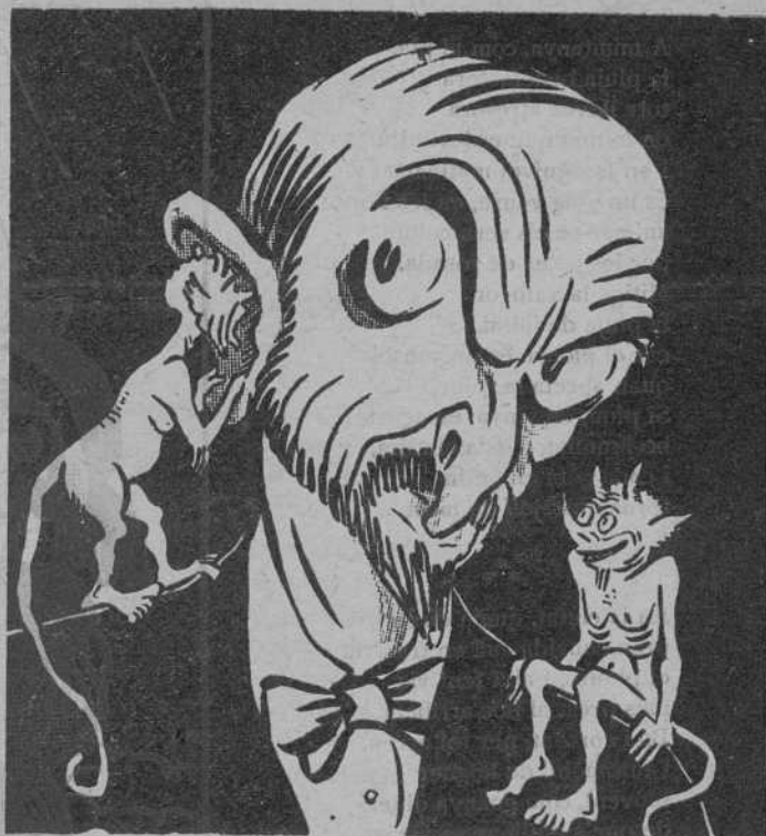
EL GRAND RAYMOND DE LA «LLIGA»

Si van per aquest camí, veurem coses grosses dintre de la present temporada. De moment, ja ens anuncien dos partits pel mes d'abril amb un equip amateur campió, que diuen que és la «crema» del futbol. Ja veiem an En «Nimes» llepant-se els dits.