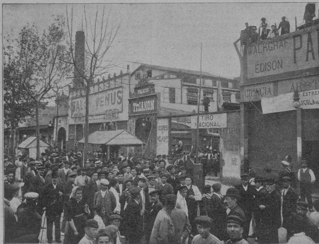
Comensan al Paralelo els derribos de las construccions aixecadas fora de la línea oficial.