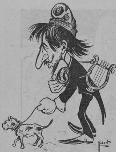
El guanyador de la Viola.