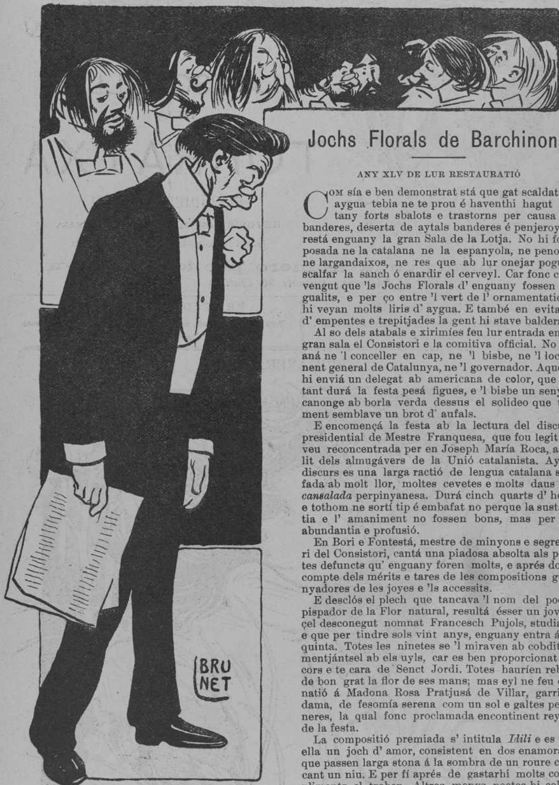
Estalla la alegre orquesta, saludant al troyadó...