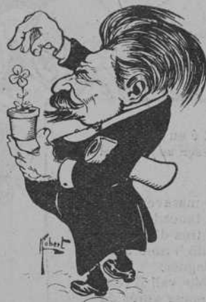
Premiat ab la Flor natural.