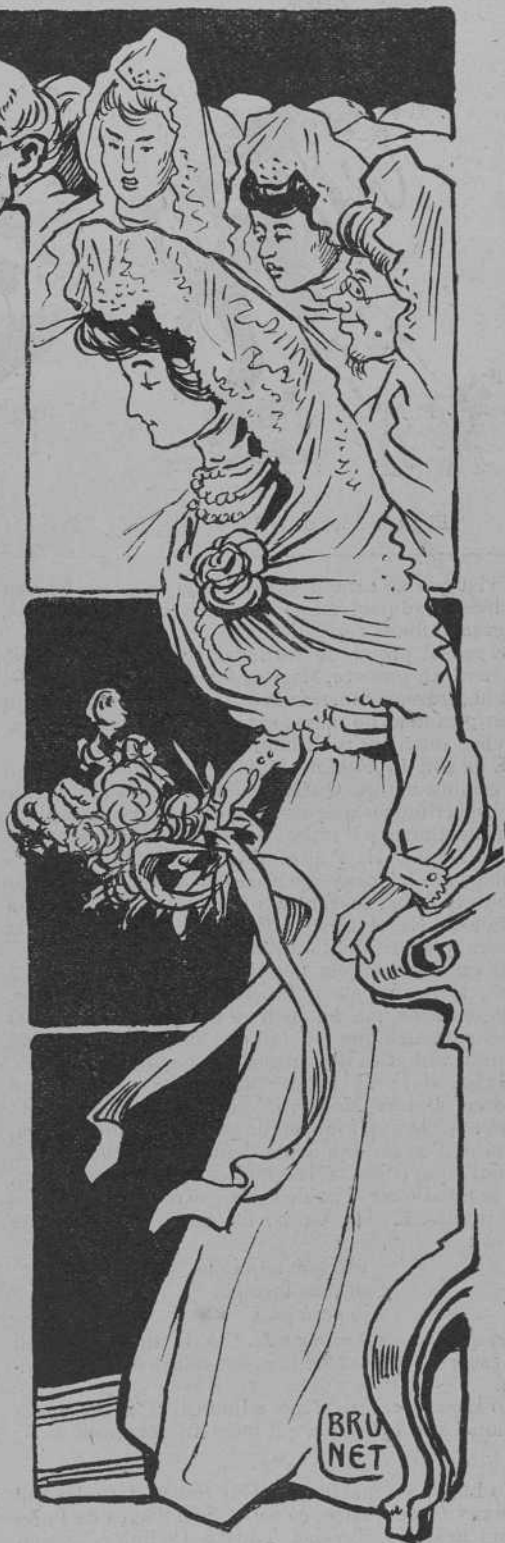
...y la reyna de la festa se 'n va á ocupá 'l gran silló.

Un altre dels premis extraordinaris fonc l' offert pel cardenal Cassanyes, qui mes traça te en offerir premis qu' en guanyar elections, com ara mateix s'