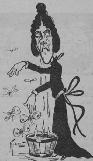
Una poetisa romántica.

ha vist que ab tot e posarhi 'l coyl se 'n ha fet deu pedres, haventse emportat avall, com una brossa, la gran riuhada republicana.