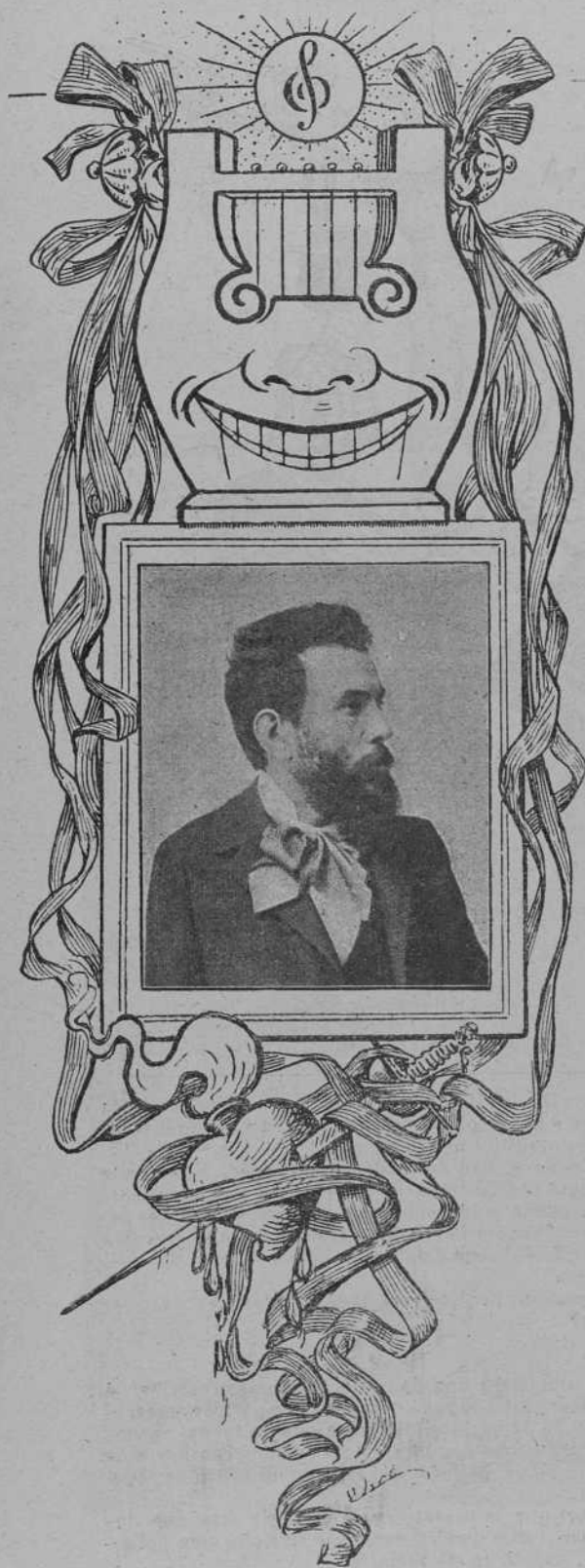
AMADEU VIVES Autor de la música de Don Lucas del Cigarval .

varen rebre l'ajuda de una tartana de ausili que 'ls va tornar á Mauresa de ahont havían sortit.