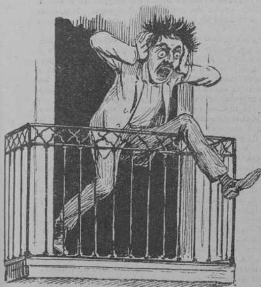
Un pobre vehí d' un primer pis de la Rambla.