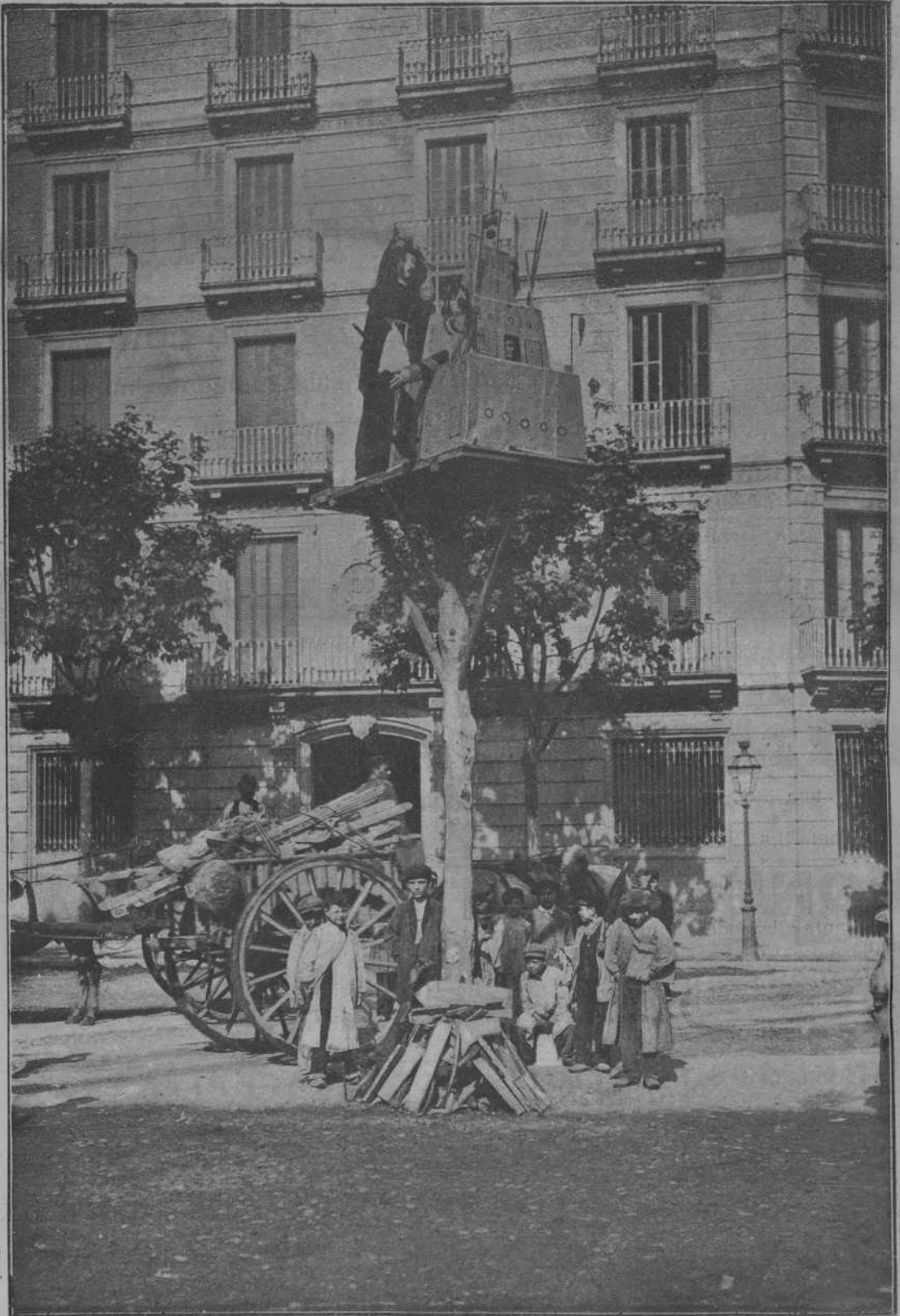
La falla del carrer de Claris.