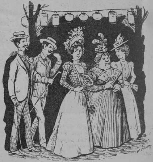
¡Aixís se comensa!

tas; las Misiones de Marruecos ens ne costan 120 mil, y un Patronat, que no sé que patrocina, pesca á la nació la suma de 133 950 pessetas.