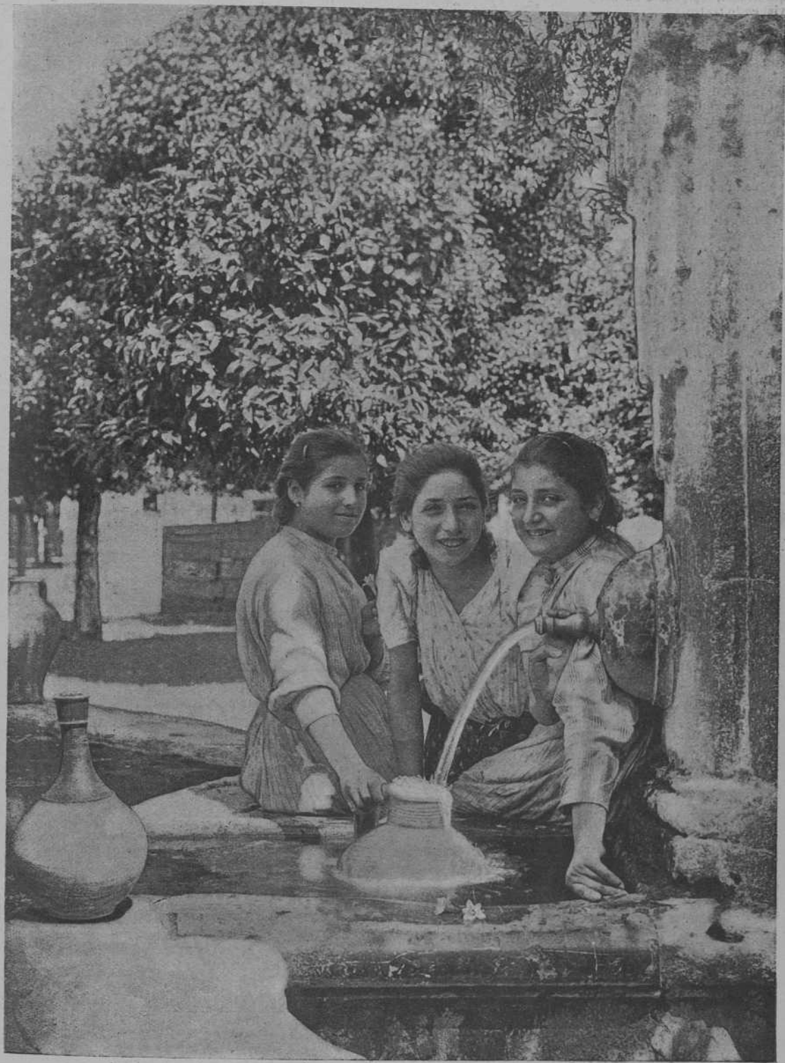
Font del Pati dels Tarongers.

NOTA: Aquesta fotografia és una reproducció d'una obra d'art que pertany a la col·lecció de l'Institut d'Estudis i Recerca de l'Institut de Ciències i Humanitats de la Universitat de València.