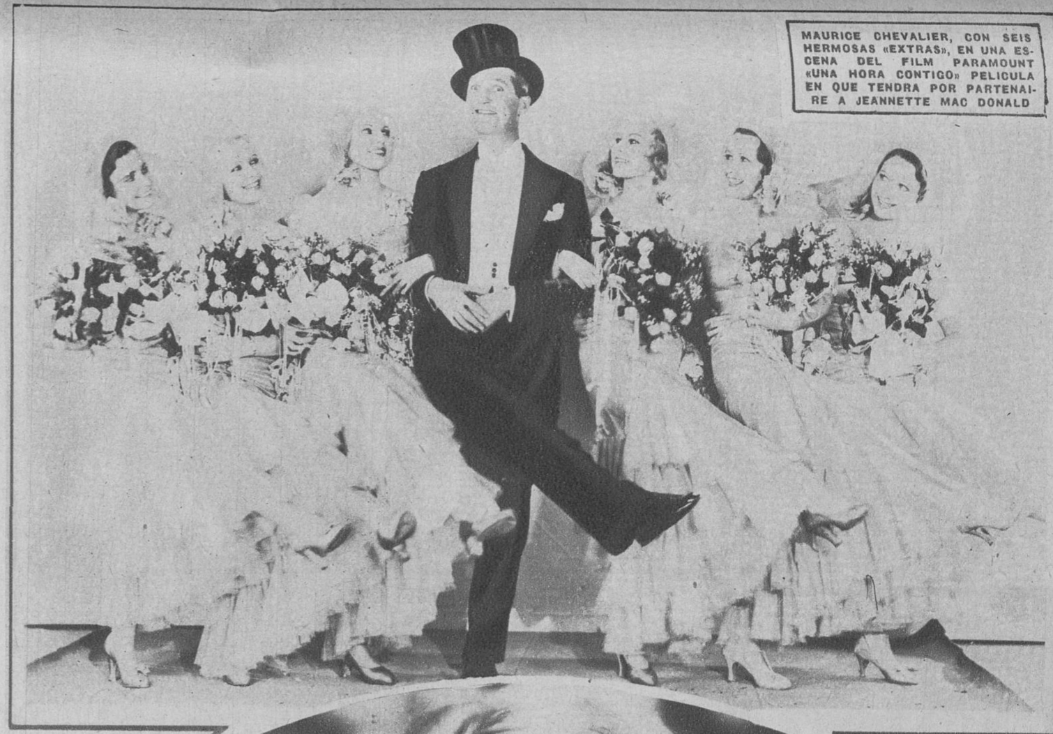
MAURICE CHEVALIER, CON SEIS HERMOSAS «EXTRAS», EN UNA ESCENA DEL FILM PARAMOUNT «UNA HORA CONTIGO» PELICULA EN QUE TENDRA POR PARTENAIRE A JEANNETTE MAC DONALD