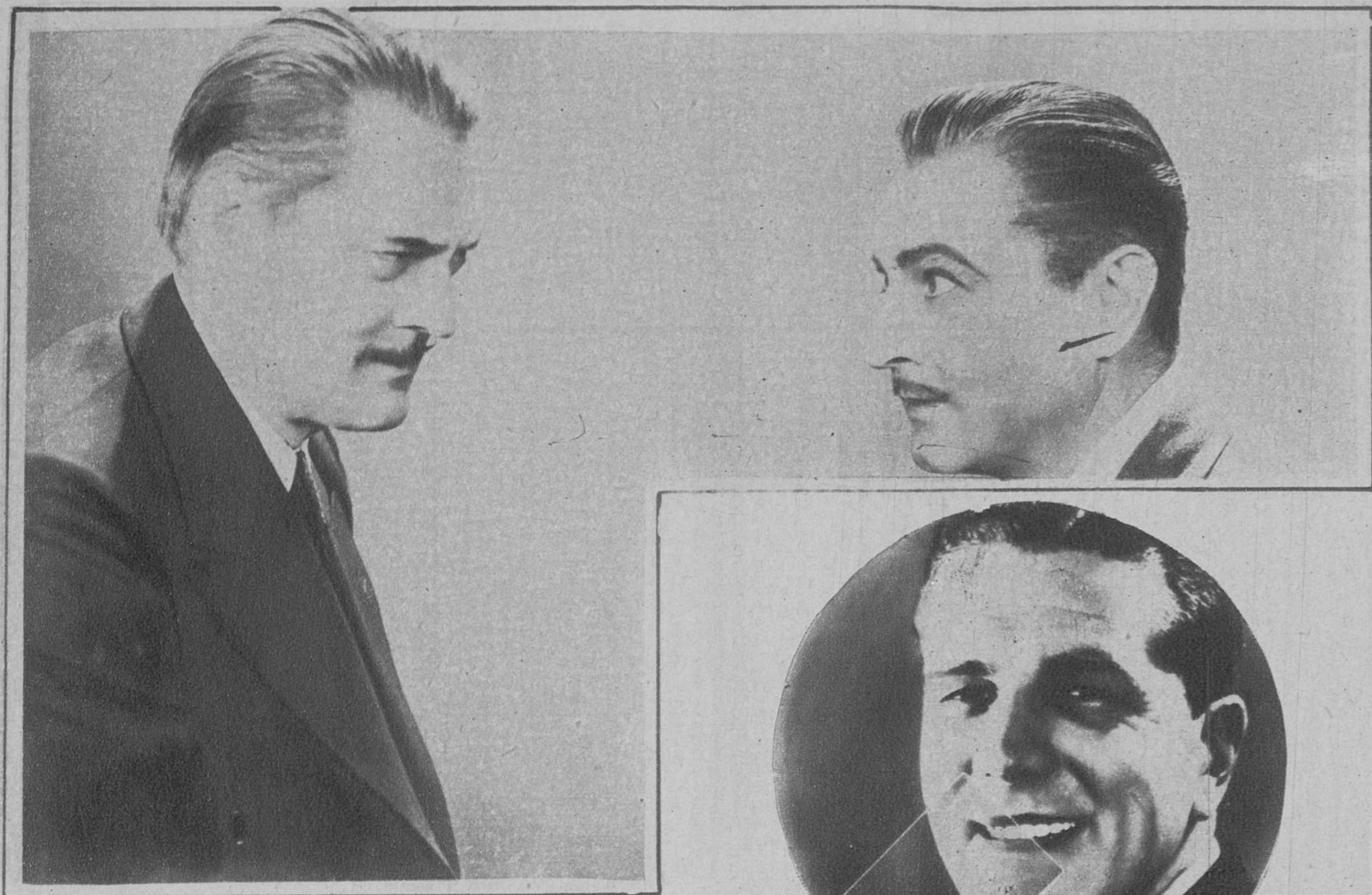
John y Lionel Barrymore, aparecerán juntos por primera vez en la pantalla, en la película «Arsene Lupin»