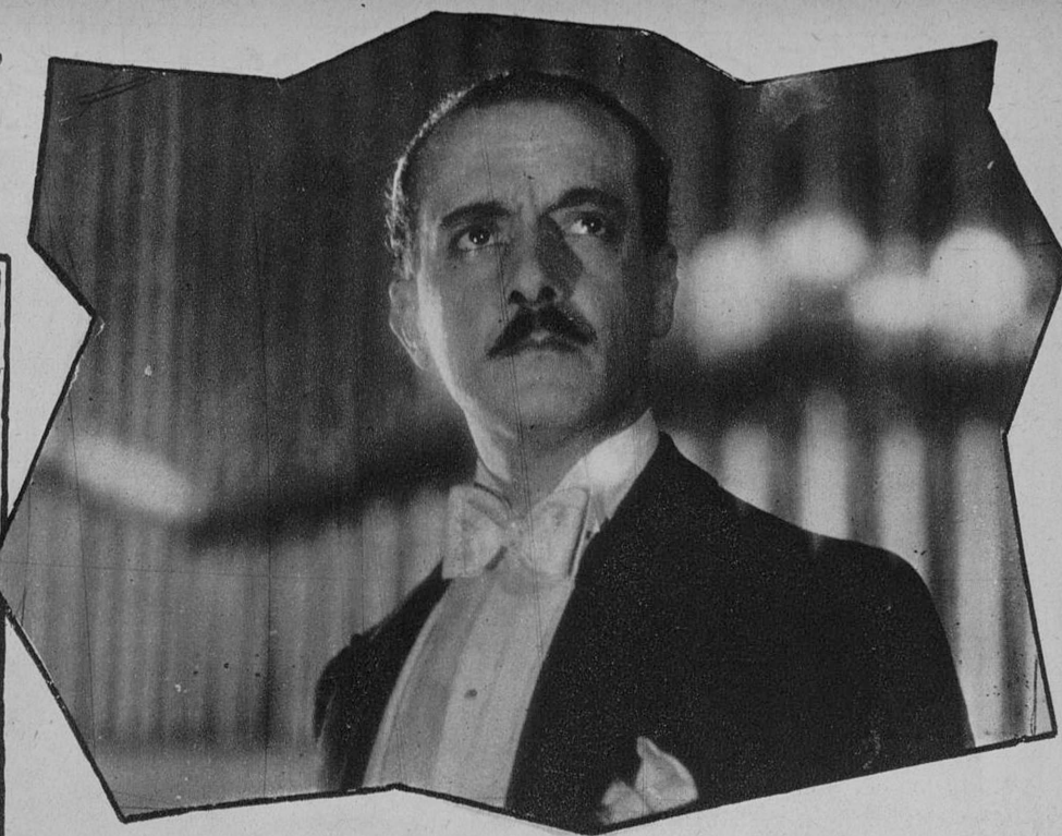
El actor italiano Daniele Crespi, en una escena del film sonoro, hablado «Resurreccion», del cual es protagonista Lya Franca