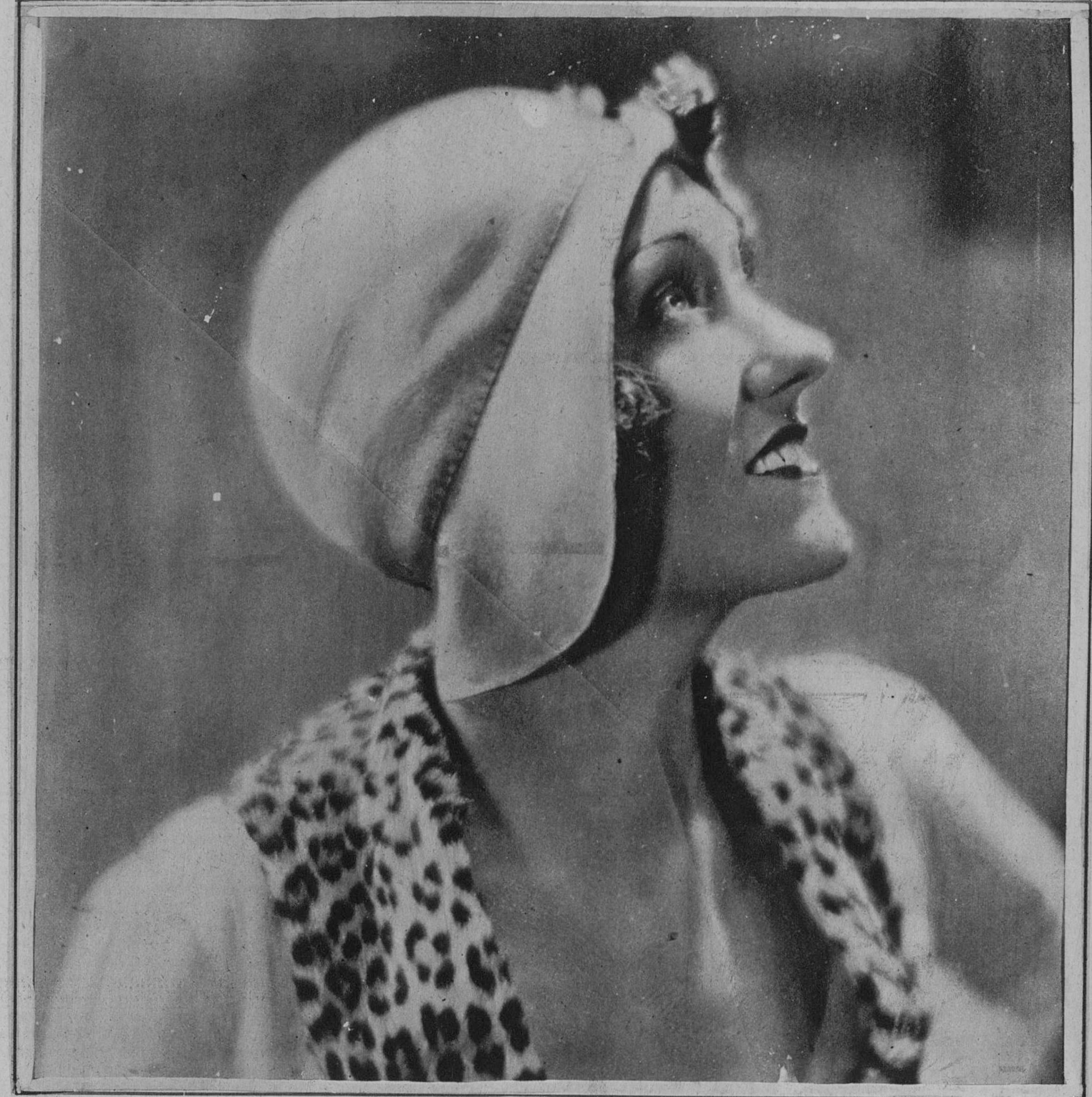
GLORIA SWANSON en su último film «¡QUE VIUDITA!» Esta fotografía puede proporcionarle una alegría Lea EL DIA GRAFICO del día 1.º de Noviembre