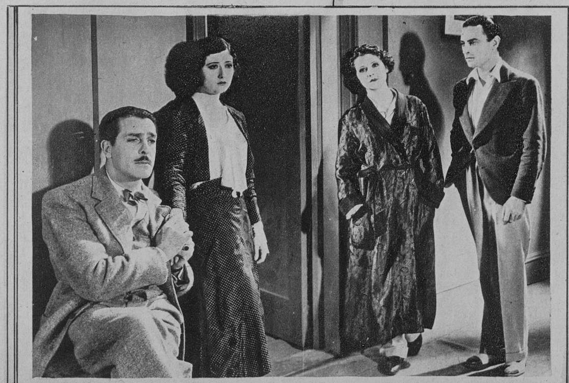
UNA ESCENA LLENA DE SENTIMENTALISMO DE LA PELICULA HABLADA EN ESPAÑOL «TODA UNA VIDA», INTERPRETADA POR CARMEN LARRABETTI, FELIX POMES, ISABEL BARRON, CARLOS DE MENDOZA Y TONA D'ALCY. PRODUCCION PARAMOUNT