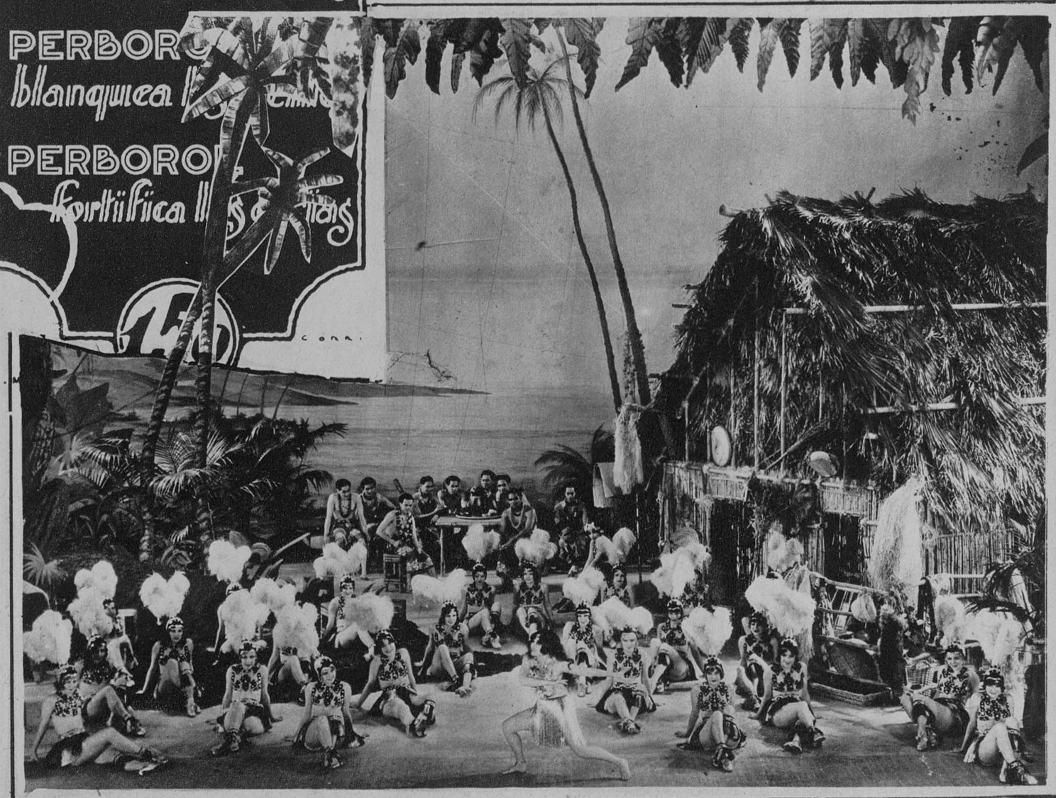
Una exótica e idealizada escena de la nueva producción sonora Warner Bros, selección Cinemas, «Fox o minué»