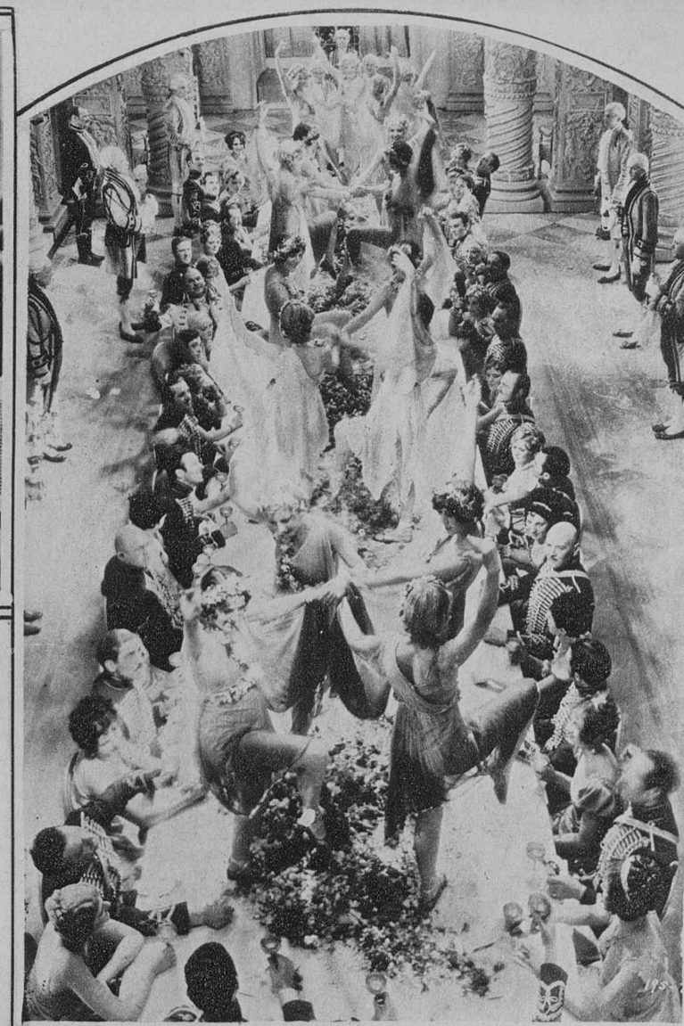
HE AQUI UNA ESCENA SUCULENTA DE «LA NOVIA DEL REGIMIENTO», DE LA FIRST NATIONAL, QUE RECUERDA —AUNQUE LIGERAMENTE—, LOS FESTINES ROMANOS. UNA SELECCION CINÉS