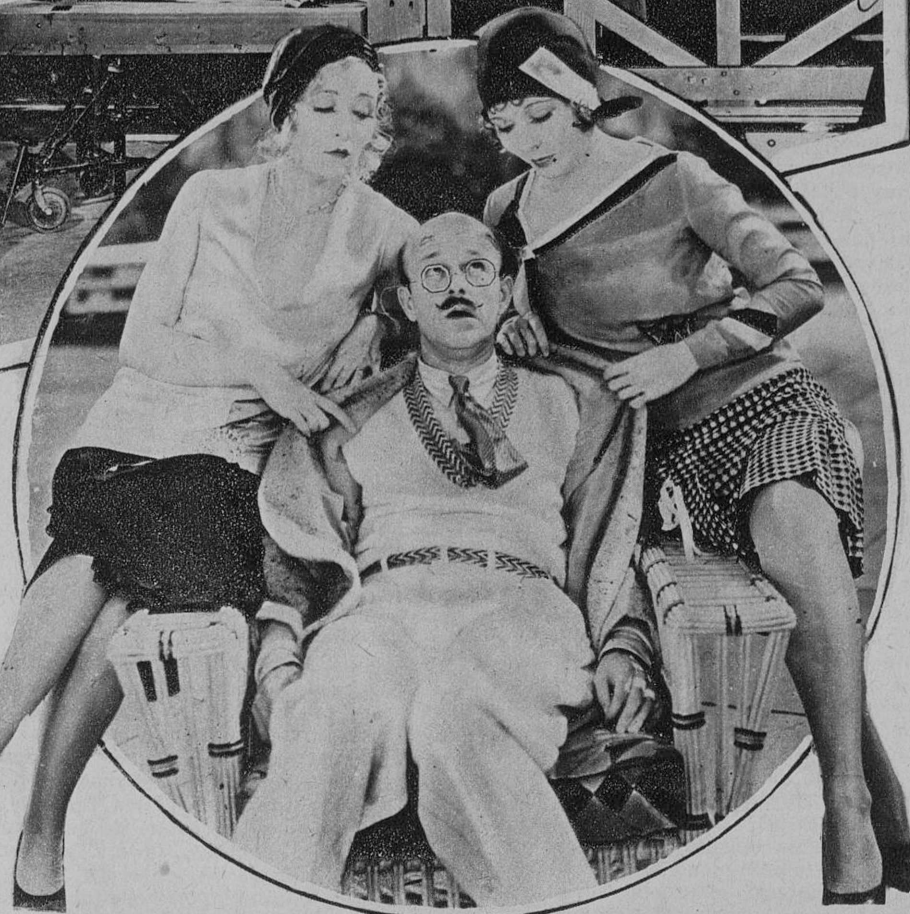
DOS LINDAS MUCHACHAS QUE TOMAN PARTE EN LA REVISTA CINEMATOGRAFICA «NO. NO. NANETTE», DE LA FIRST NACIONAL, SELECCION CINEMAS