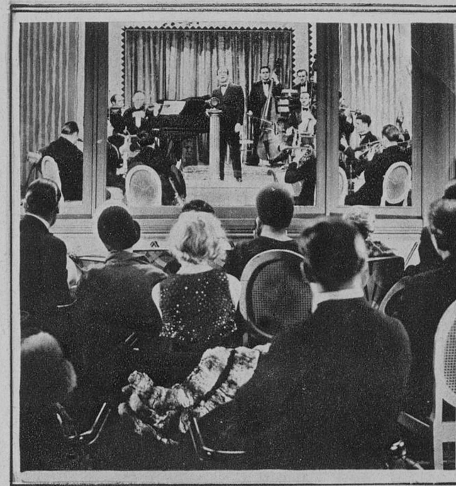
AL JOLSON, EL FAMOSO INTERPRETE DE «EL LOCO CANTOR», FILMANDO UNA ESCENA SONORA DE «CANTO PARA TI», DE LA WARNER BROS. SELECCION CINÉS