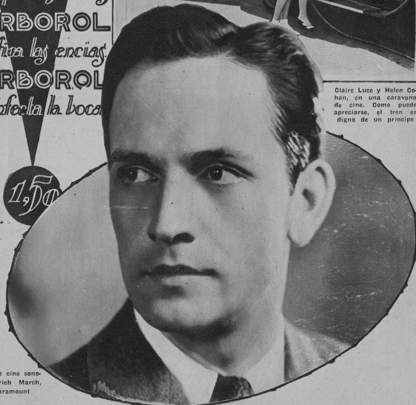
El artista de cine sonoro Frederick March, de la Paramount