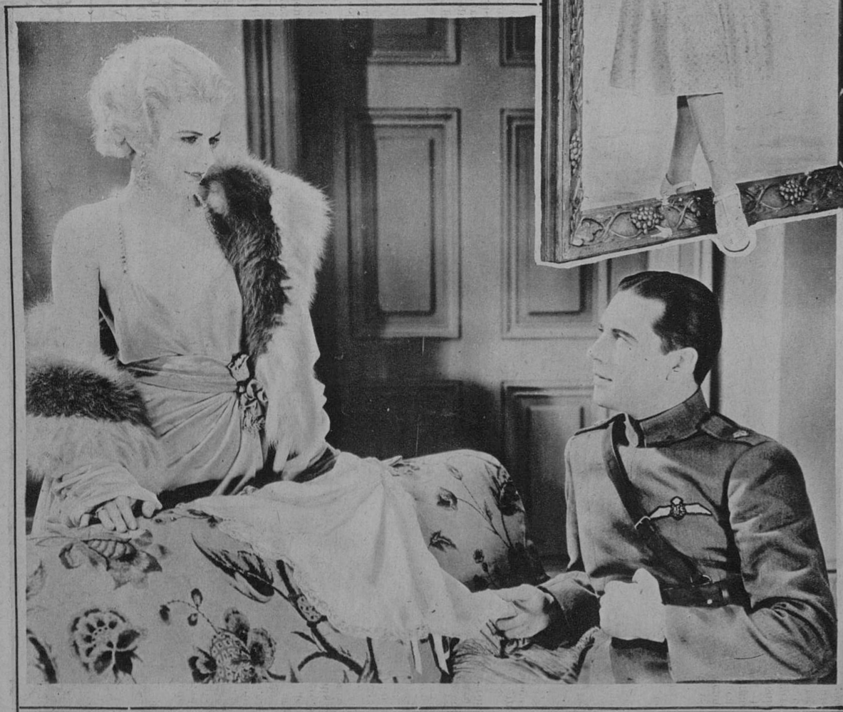
BEN LYON Y JEAN HAR- LOW, EN UNA ESCENA DE «ANGELES DEL INFIERNO»