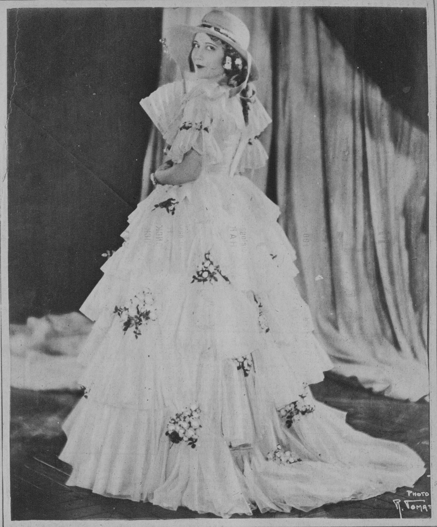
La bellissima Edith Jeane, luciendo una lujosa toaleta en la película «Tavakanova», de Renacimiento Films