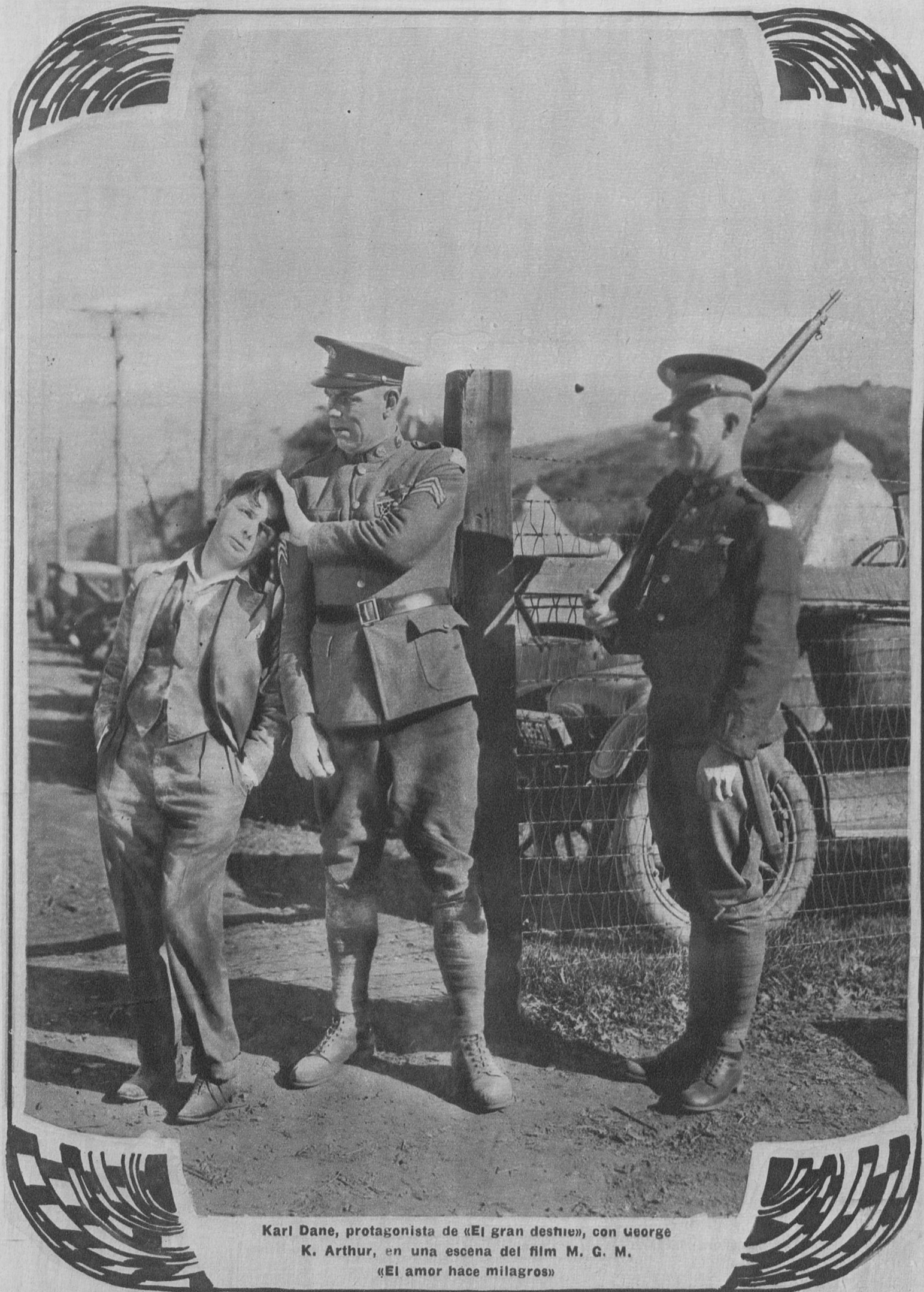
Karl Dane, protagonista de «El gran destino», con George K. Arthur, en una escena del film M. G. M. «El amor hace milagros»