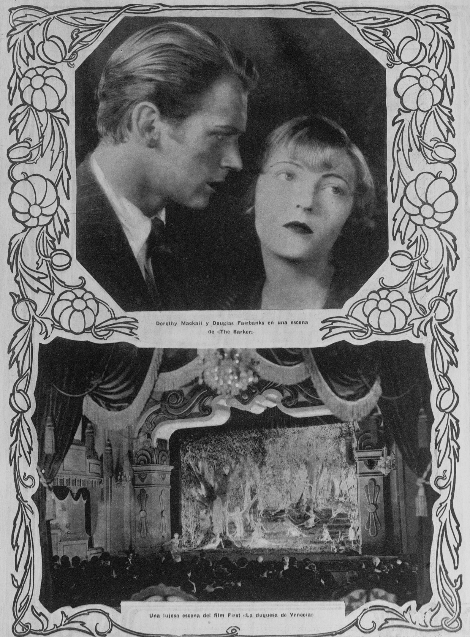
Dorothy Mackail y Douglas Fairbanks en una escena de «The Barker»