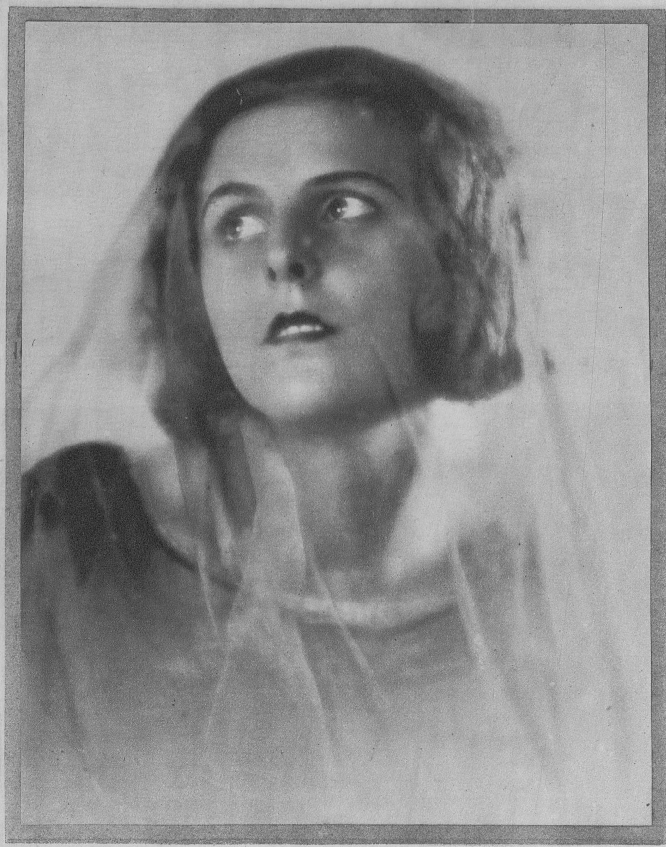
La hermosa estrella alemana Seni Riefenstahl