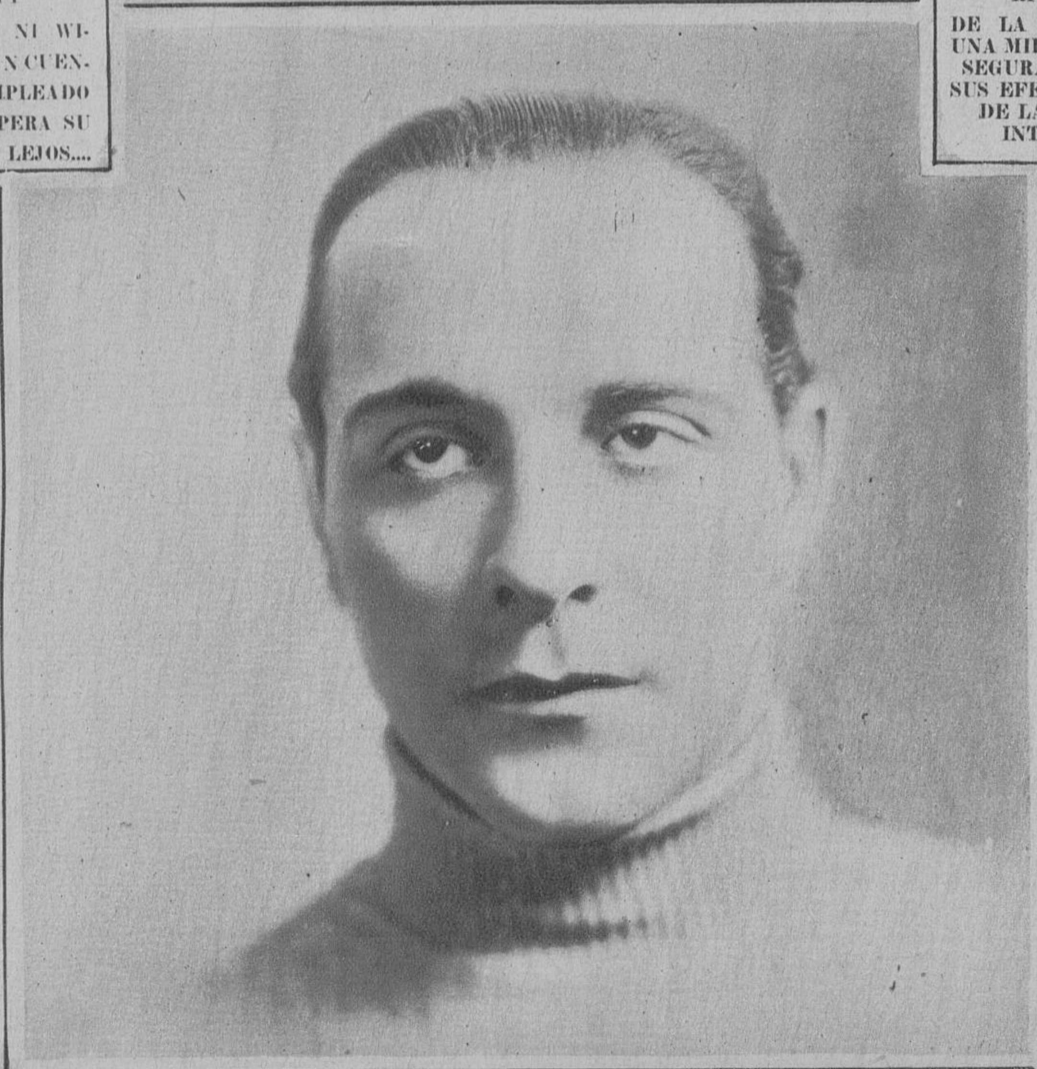
RICARDO CORTES DE LA PARAMOUNT. TIENE UNA MIRADA LANGUIDA QUE SEGURAMENTE PRODUCE SUS EFECTOS EN EL GREMIO DE LAS ADMIRADORAS INTERNACIONALES.