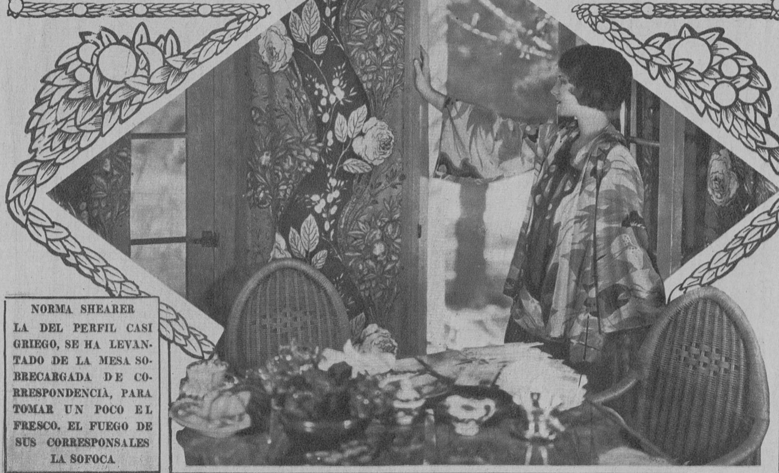
NORMA SHEARER LA DEL PERFIL CASI GRIEGO, SE HA LEVAN- TADO DE LA MESA SO- BRE CARGADA DE CO- RRESPONDENCIA, PARA TOMAR UN POCO EL FRESCO. EL FUEGO DE SUS CORRESPONSALES LA SOFOCA