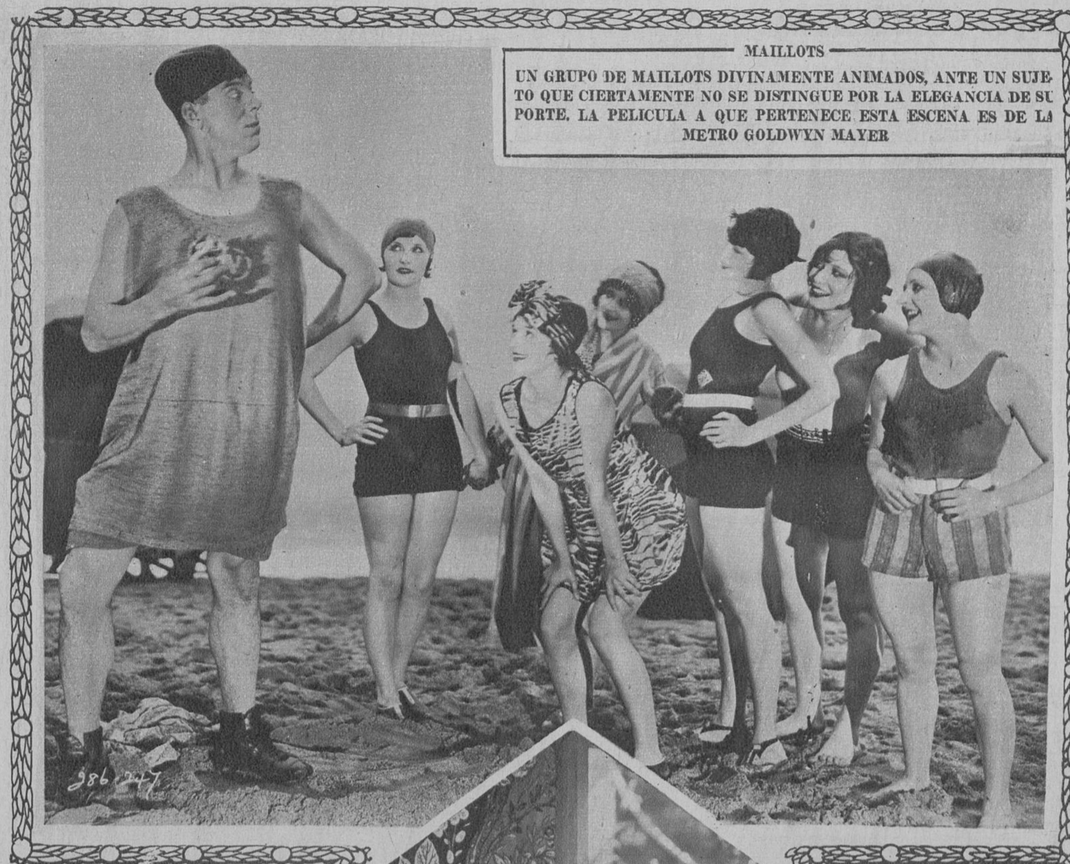
MAILLOTS UN GRUPO DE MAILLOTS DIVINAMENTE ANIMADOS, ANTE UN SUJE- TO QUE CIERTAMENTE NO SE DISTINGUE POR LA ELEGANCIA DE SU PORTE. LA PELICULA A QUE PERTENECE ESTA ESCENA ES DE LA METRO GOLDWYN MAYER