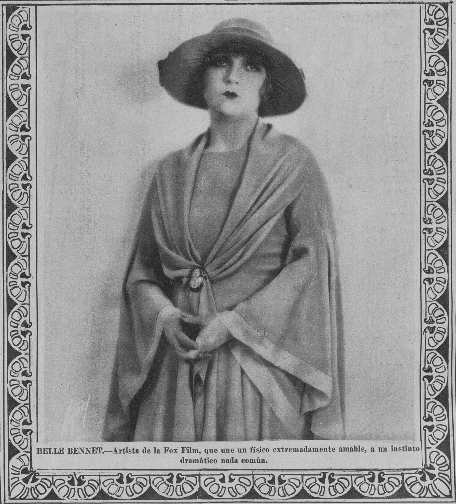
BELLE BENNET. —Artista de la Fox Film, que une un físico extremadamente amable, a un instinto dramático nada común.