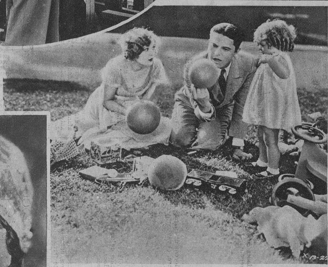
DOLORES COSTELLO TAN BONITA EN LA PANTALLA COMO EN LA VIDA REAL— COSA RARA—, Y MALCOLM MAC REGOR, PROCURAN EN- TRETENER A UN JOVEN YASTAGO DE WARNER BROS, QUE CON ELLOS TOMA PARTE EN UNA NUEVA PELICULA