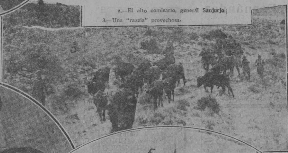
3.—Una "razzia" provechosa.