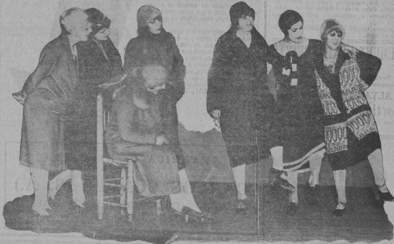
¿Hay gracia o no en esta escena? Después de la pregunta les vamos a explicar lo que acontece entre estas mujeres guapas: cosas de la moda y de Terpsicore. “Argentina” enseña a las chicas de Romea el arte de mover los pies en el ultramoderno “charleston”.

Pero yo, durante él, pude observar que la mujer de nuestro empresario era un Otelo con faldas. A los postres, ella y él se enredaron en una discusión un poco espinosa. La dama se fué subiendo de tono. El replicaba. De pronto ella, presa de un ataque nervioso, cogió un plato y lo lanzó contra la cabeza de su marido, no logrando el intento en gracia a un hábil “regate” del agredido. Y ella rompió en gritos atronadores: “¡Mal hombre!