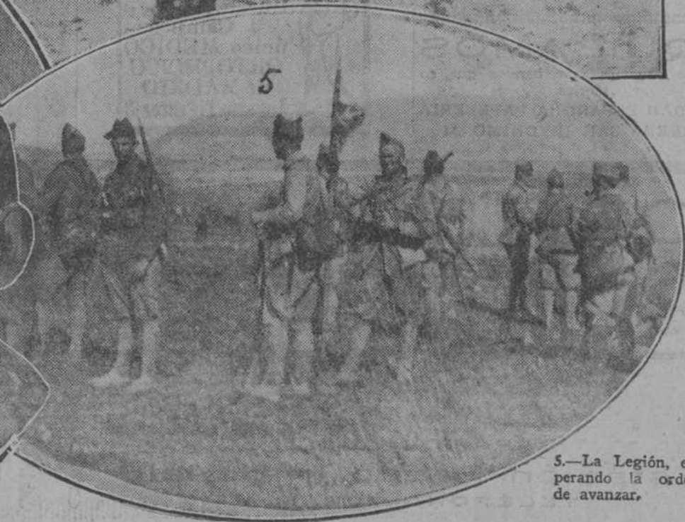
5.—La Legión, esperando la orden de avanzar.