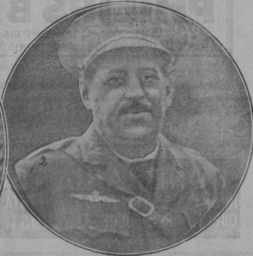
2.—El alto comisario, general Sanjurjo.