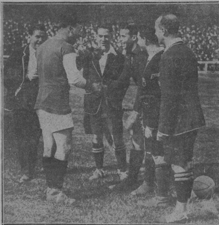
El capitán del West-Hann-Wanted estrechando la mano del capitán de la selección española, Samitier, antes de empezar el partido.

El árbitro, Sr. Serrano, cumplió, menos en el tanto de Samitier, que debió anularlo.