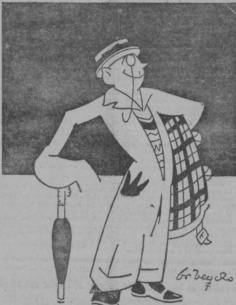
Lo que será el modelo masculino de este verano con arreglo a la perfecta ortodoxia del "pollo pera".

TOKIO.—El Ministerio de Marina ha terminado el proyecto de aumento de flota marítima aérea en diez y seis compañías de diez y seis aeroplanos cada una.