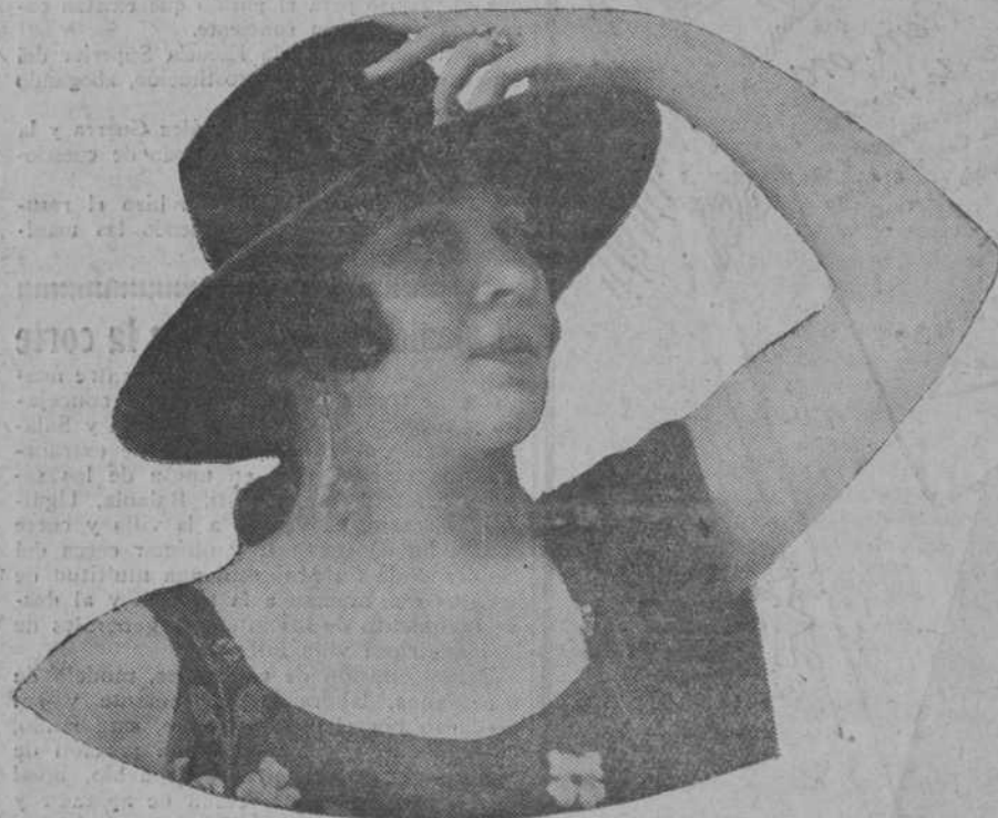
La castiza y madrileña Argentinita.