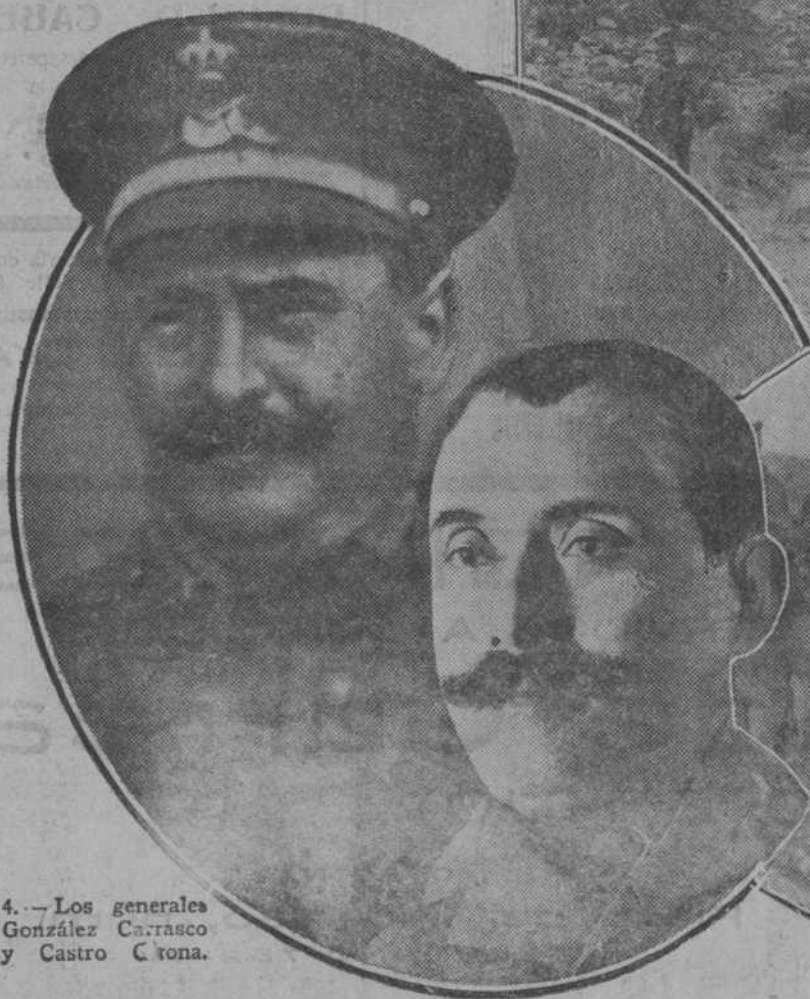
4.—Los generales González Carrasco y Castro Cóna.