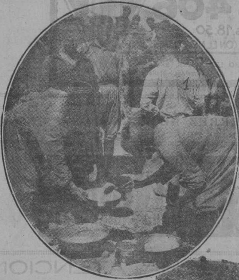
1.—Un pintoresco instante: el del rancho en los campamentos de los Regulares.