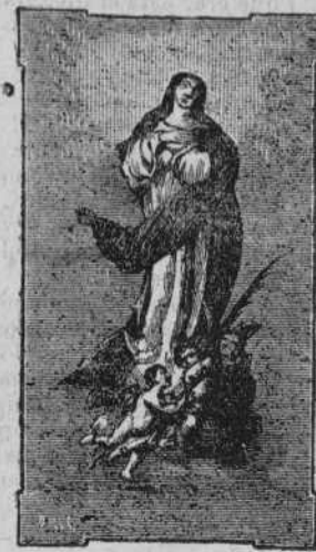
MARCA DE FABRICA.