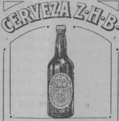
AGENTES PARA MARRUECOS CORIAT & CIA EN TANGER

Los señores Coriat y Compañía, agentes de la cerveza Z. H. B., tienen el honor de informar a su fiel clientela, que a pesar de la tan buena acogida que dió el público al concurso de cápsulas Z. H. B., efectuado en Diciembre del año pasado, este año se propone hacer un mayor regalo, que consiste en