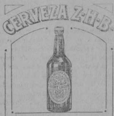
AGENTES PARA MARRUECOS CORIAT & CIA EN TANGER

Los señores Coriat y Compañía, agentes de la cerveza Z. H. B., tienen el honor de informar a su clientela, que a pesar de la tan buena acogida que dió el público al concurso de cápsulas Z. H. B., efectuada en Diciembre del año pasado, este año se propone hacer un mayor regalo, que consiste en