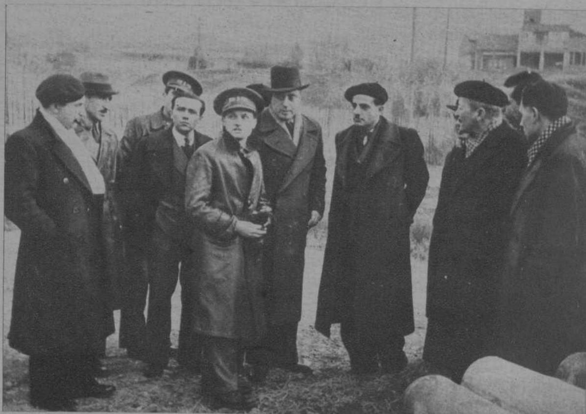
En su visita al Frente comprobaron el admirable funcionamiento de los servicios forestales del Cuerpo de Ingenieros