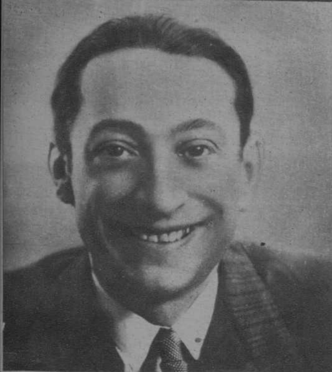
Marcos Redondo, el celebrado barítono, que el martes cantará el "Melchor", de "La Doiores", por primera vez