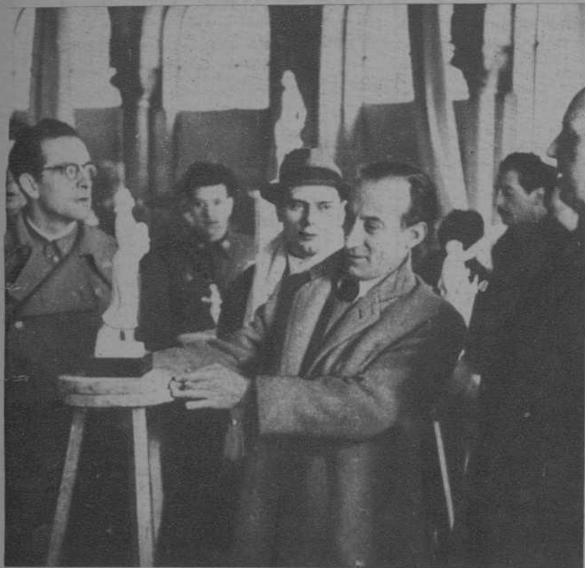
La visita al taller del escultor de la República, Viadomat