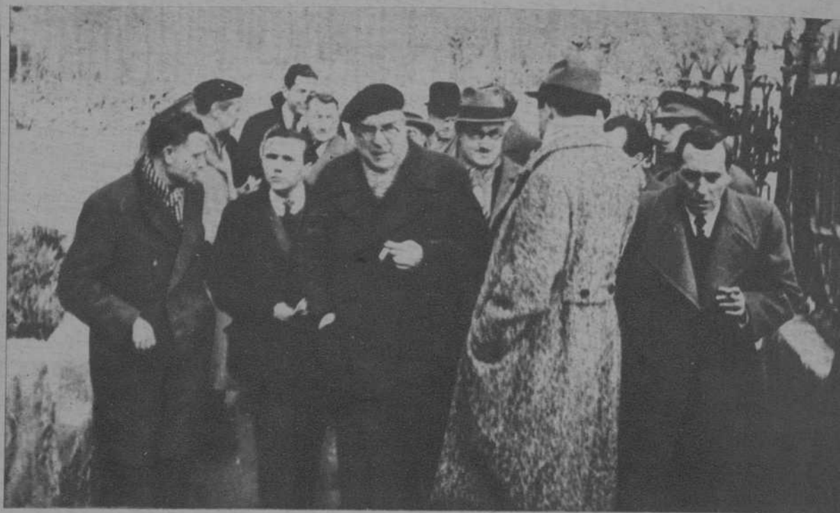
La visita al Monasterio de Montserrat