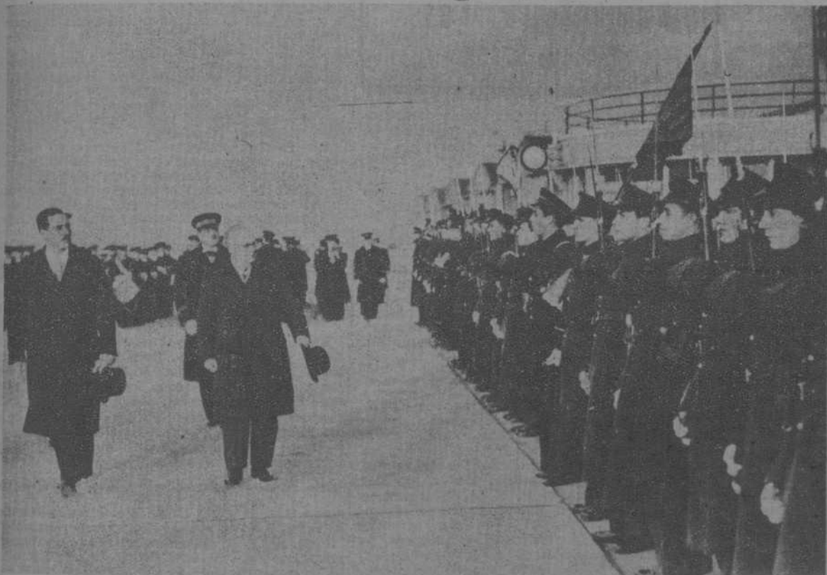
Sir Kingley Wood, al descender, en el aeródromo de Le Bourget, pasa revista a las fuerzas de Aviación que le rinden honores, acompañado del ministro del Aire francés, Mr. Suy-la-Chambre

Aparentemente las relaciones diplomáticas entre Francia e Italia se han reanudado y hay embajador italiano en París y embajador francés en Roma