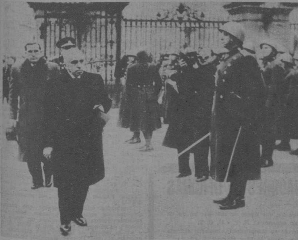
El Presidente Hacha pasa revista a las tropas que le rinden honores