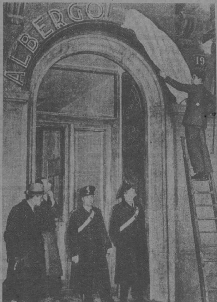
Pero en Milán, el propietario del "Albergo Francia", tiene que ocultar la palabra Francia