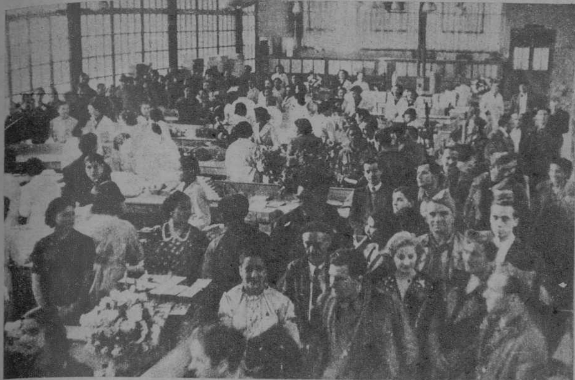
LA VISITA DE LOS VOLUNTARIOS DE LA BRIGADA GARIBALDI A UNA DE LAS FABRICAS DE CATALUÑA. LAS OBRERAS LES OBSEQUIAN CON RAMOS DE FLORES

Barcelona, martes, 8 de Noviembre de 1938