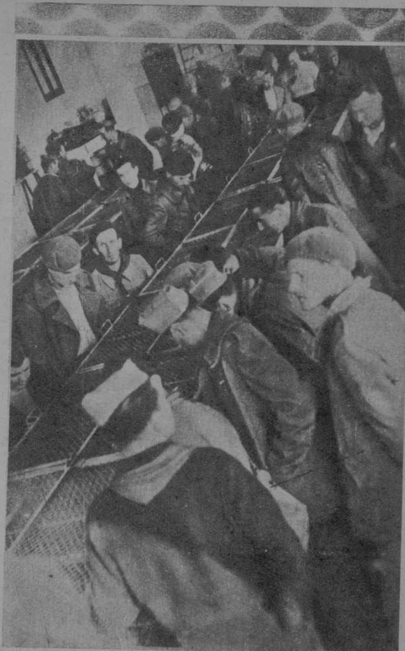
LOS MISMOS VOLUNTARIOS EN LA VISITA AL INSTITUTO REVELLAT PLA