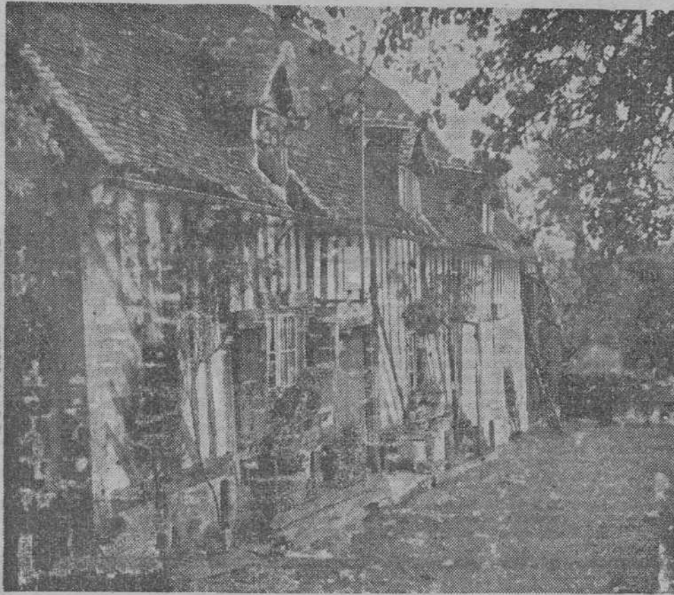
La casa de campo de Ronceray, donde nació Carlota Corday

Admiro la Revolución francesa, en bloque. Admiro en ella lo claro y lo oscuro, lo definido y lo indefinido y también lo atormentado y lo que apenas es un signo. No creo que haya otro modo de admirarla.