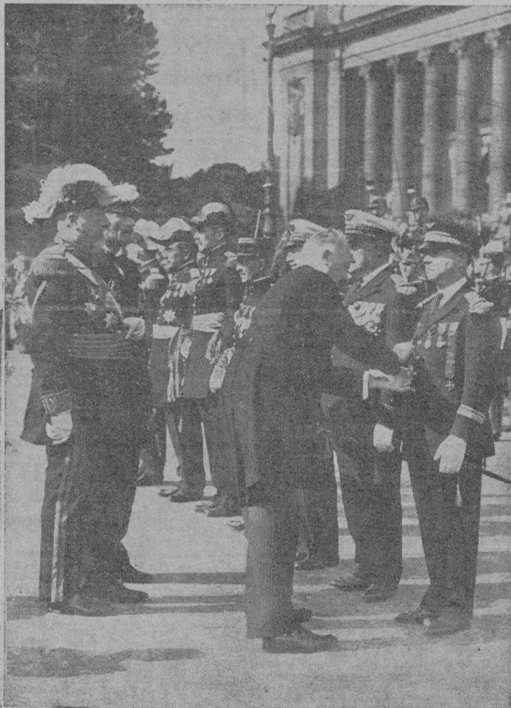
LA REVISTA DEL 14 DE JULIO EN PARIS En la Avenida Alejandro III el Presidente de la República condecora al célebre aviador Fonck, nombrado Gran oficial de la Legión de Honor

mienzos del Ejército Popular, con aquellos elementos heterogéneos; los que conocen a los vascos y catalanes, de carácter distinto, pero igualmente decididos a defender su libertad; los que han visto el entusiasmo del proletariado y de las clases medias, deben reconocer que el espíritu que anima a España republicana es indestructible. Si ese espíritu de libertad no puede manifestarse en el nuevo Estado que se forme sobre las ruinas de la guerra, entonces se producirá de nuevo otra rebelión en España.—Agencia España.