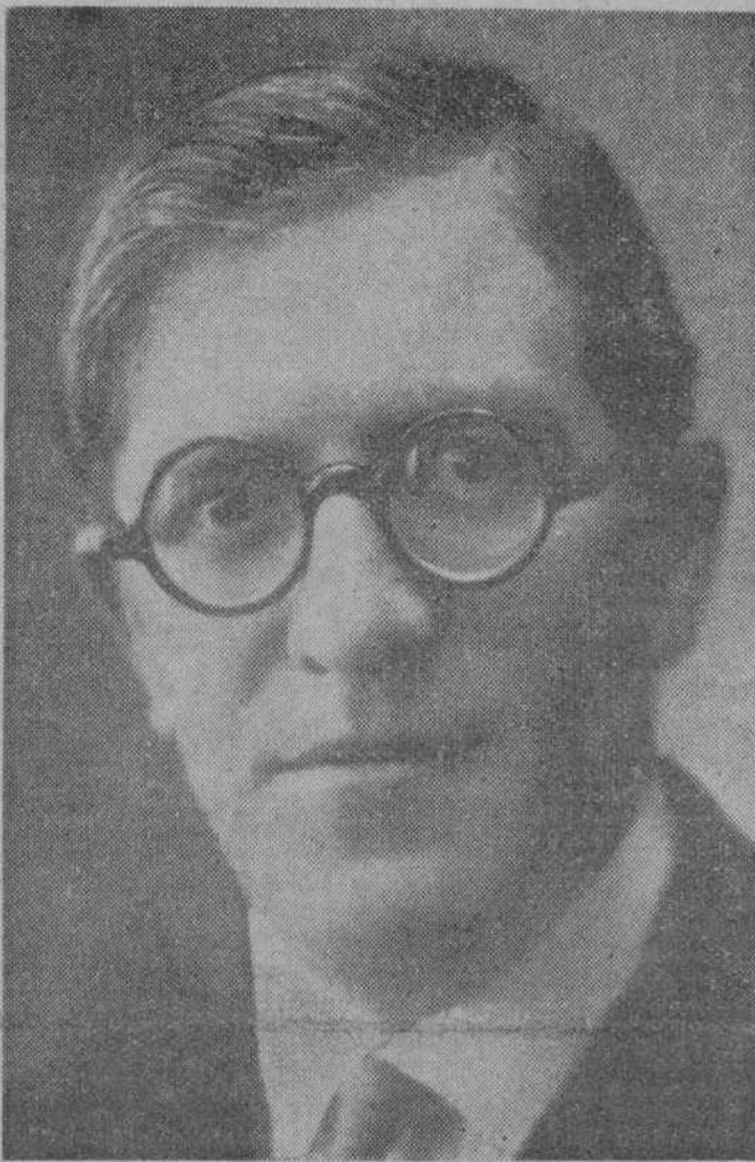
Julio ALVAREZ DEL VAYO

Nadie que no sienta dentro de sí mismo, convertida en un segundo ser, esta consigna de la resistencia, puede imaginarse la fuerza inmensa que da el no estar con el alma en un hilo, pendiente del menor contratiempo, expuesto a la reacción desalentadora de cualquier infortunio pasajero, sino saberse, al contrario, tan resuelto a luchar, que toda otra alternativa ni siquiera atraiga como tema polémico. En la zona rebelde ¡si se siente nuestra resistencia! En el mes de marzo median por días la etapa final. En vez de decir, como el presidente Negrín, "la guerra será larga", les prometían a sus gentes sin fe, que todo habría terminado para la primavera. En la zona rebelde se dan, los que todavía no se han librado íntimamente de la traición, perfecta cuenta de que nuestra resistencia es su muerte. Los otros, los que en la zona rebelde aunque luchando todavía con las