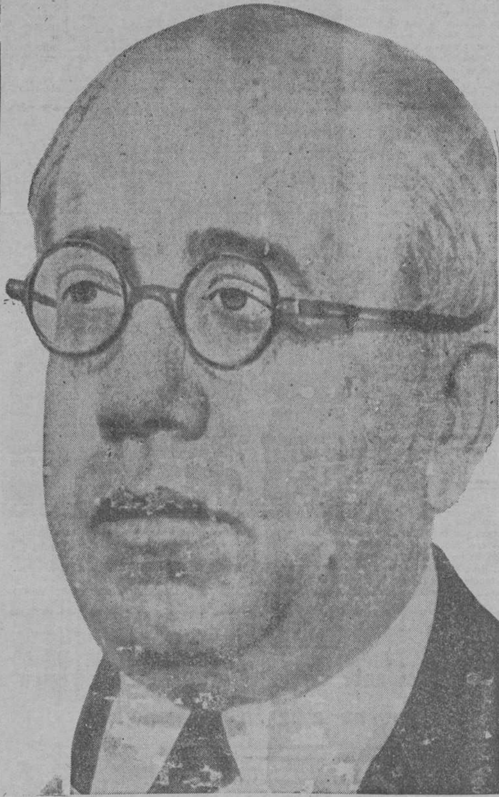
El Presidente de la República se dirigirá mañana por radio a la Nación española

Se ha comunicado a todos los Centros docentes dependientes del Ministerio de Instrucción Pública, la siguiente orden circular: "En las clases, el 19 de julio deberá ponerse de relieve el alto significado de la histórica fecha". El subsecretario, J. Puig Elias.