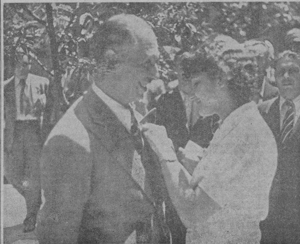
LOS VOLUNTARIOS CATALANES DEFENSORES DE LA INDEPENDENCIA DE FRANCIA Imposición de la Medalla de los voluntarios catalanes al Presidente Companyes

La casa donde vivió y murió el Poeta, en la típica calle de Petritxol, pasada la guerra, debería adquirirla el Municipio y destinarla a Museo, arca sagrada que guardara sus cosas familiares e íntimas. Hugo, Goethe, Schiller,