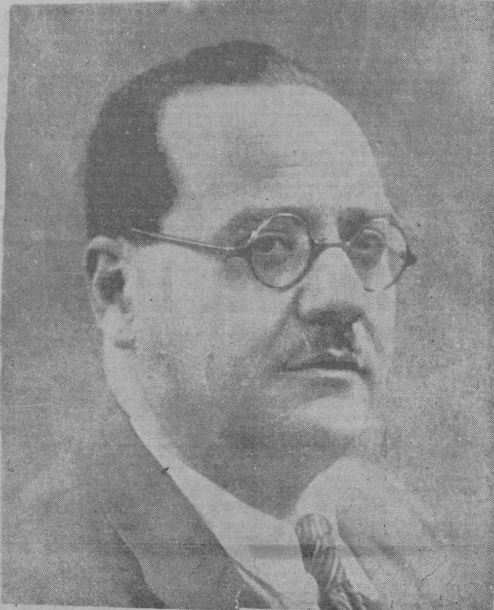
El jefe del Gobierno de Unión Nacional, don Juan Negrín

España se desgasta y ensangrienta porque la ambición sin freno de países para quienes por definición al derecho de los pueblos en nada cuenta, posa en ella su mirada de rapaña, viéndose en nuestra patria una víctima propicia para su codicia. Una riqueza potencial inmensa, una privilegiada situación geográfica, única en Europa, fueron alicientes sobrados para maquinarse la endiablada estratagemas que si todos no nos esforzamos remate a la historia de nuestra tierra. Nosotros, los españoles, es verdad, les dimos el terreno abonado para sus combinaciones maquiavélicas. Las luchas intestinas de un pueblo en el que, a través de generaciones de mezquina politiquería se había entumecido su sentido nacional, permitían envenenar la convivencia ciudadana estimulando extremismos bien intencionados de apuesto colorido, provocando con método demagógico la violencia incontinente, debilitando los resortes del Estado y suscitando recíprocos recelos contra instituciones vitales de la nación y la ciudadanía.