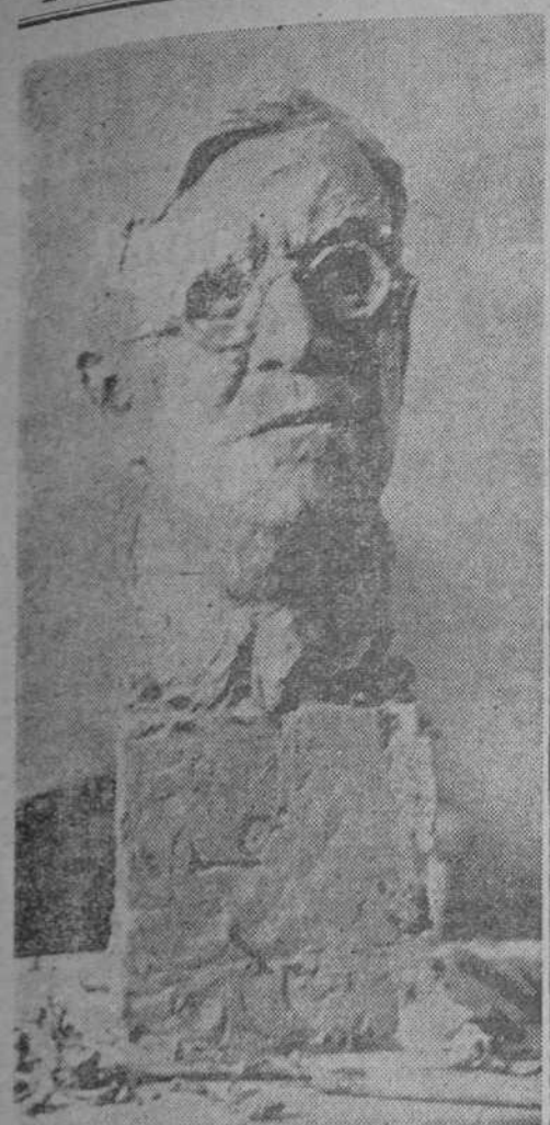
Busto del ministro de Estado, del escultor Jo Davidson.

Interesantes manifestaciones del presidente del Congreso indio, Jawaralal Nehru