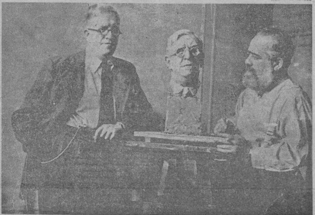
El gran periodista norteamericano y escultor, Jo Davidson, actualmente en Barcelona, terminando el busto del ministro de Estado, que figurará en una gran Exposición sobre España que tendrá lugar en los Estados Unidos

En la carta se añade que no existe posibilidad de paz mientras los Estados totalitarios quieran conquistar posiciones estratégicas en los demás países. "Todos los esfuerzos de la Sociedad de Naciones y de las organizaciones pacifistas—termina diciendo—resultan balidos ante las agresiones totalitarias." — Agencia España.