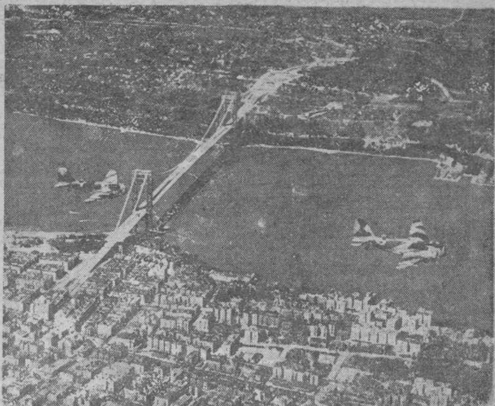
AVIONES CAMUFLADOS Pasan por debajo del puente Jorge Washington, de Nueva York