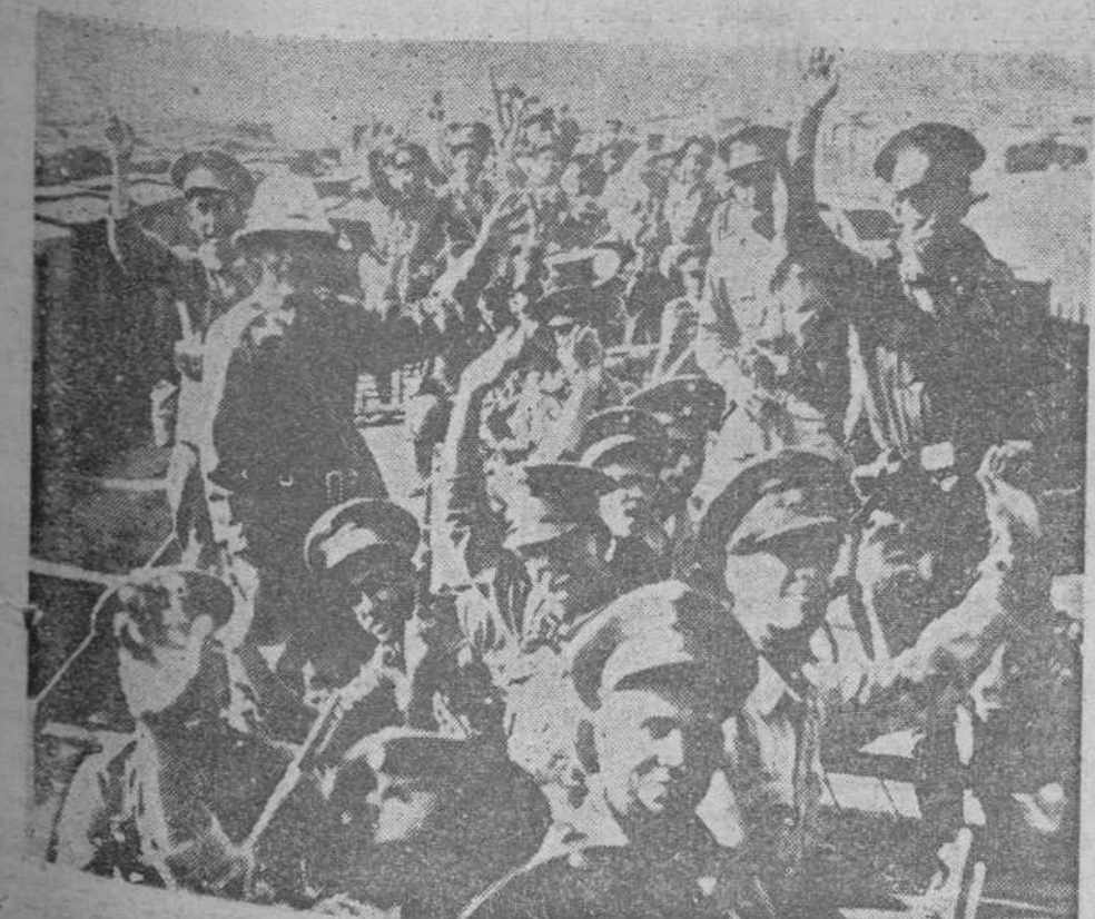
LA SUBLEVACION DE CEDILLO Las tropas federales parten para combatir a los insurgentes