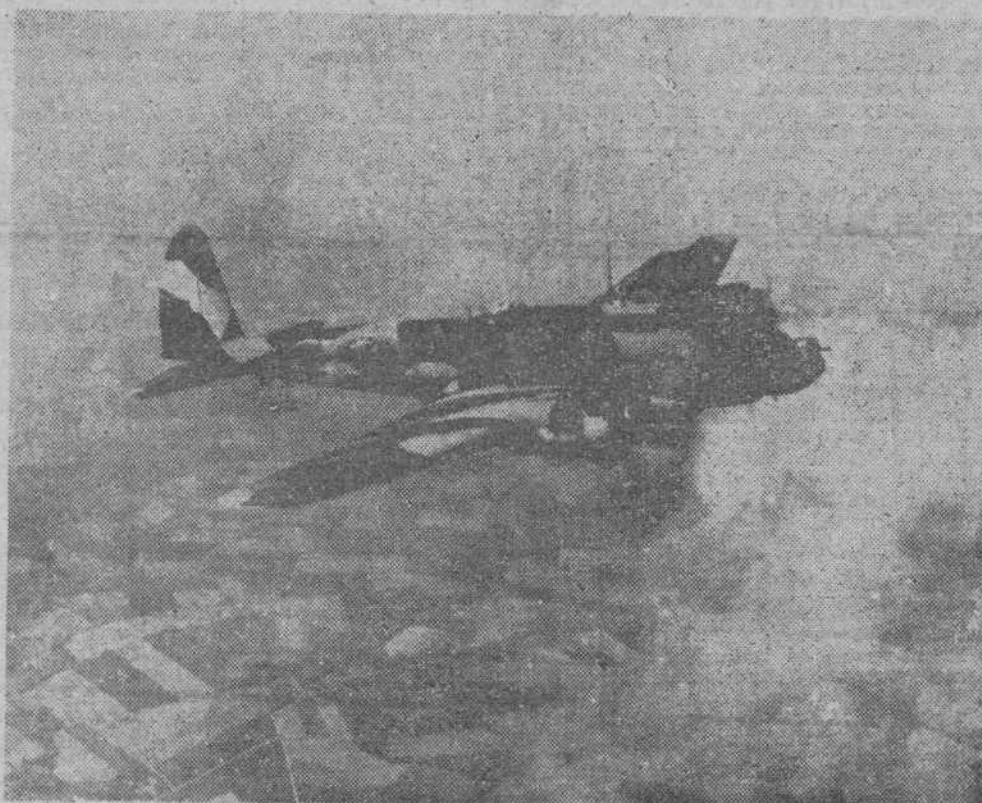
UNA FORTALEZA VOLANTE CAMUFLADA Durante las maniobras aéreas llevadas a cabo en el Estado de Nueva York, para camuflar a los aviones de bombardeo, fueron pintadas con colores diversos las alas de los aparatos.

Deseamos un rápido y total restablecimiento al querido compañero Cortezón.