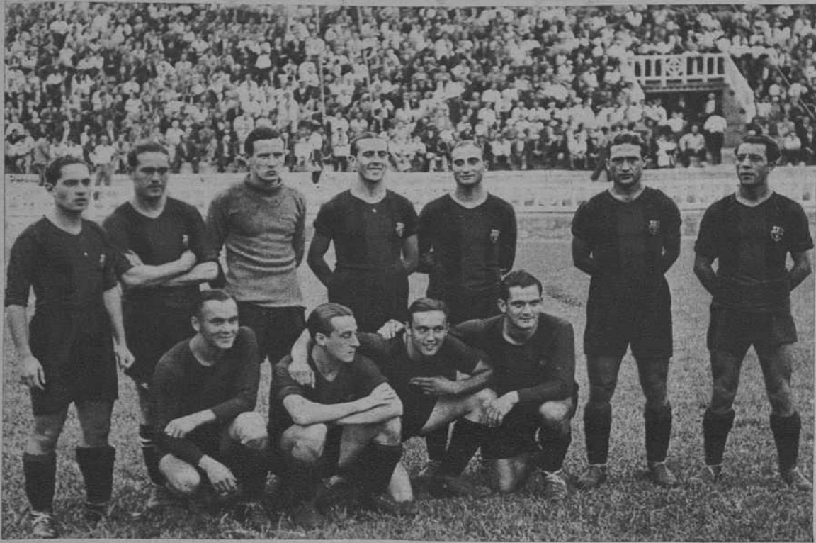
El equipo del F. C. Barcelona, que venció al Zaragoza por 7 a 0.