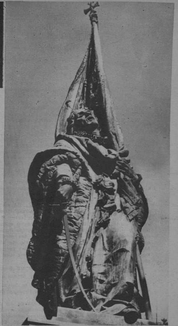
Estatua de Rafael de Casanova, levantada en el mismo sitio en que fué herido en defensa de las libertades de Cataluña