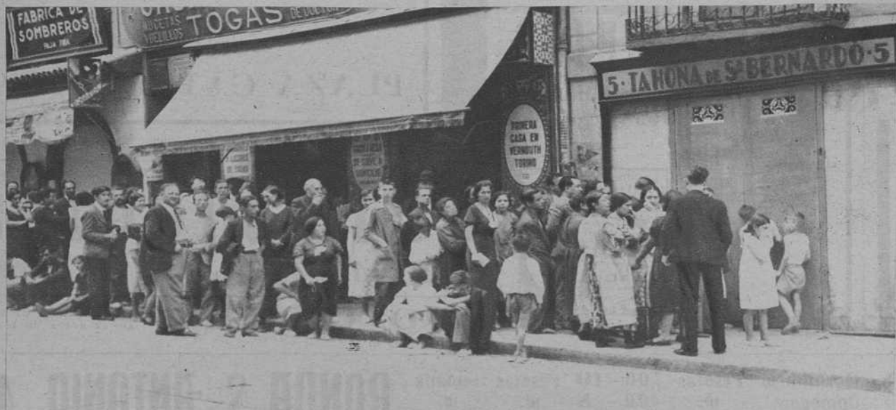
Madrid.—Cola a la puerta de una tahona, el sábado.—(Fots. Vidal)