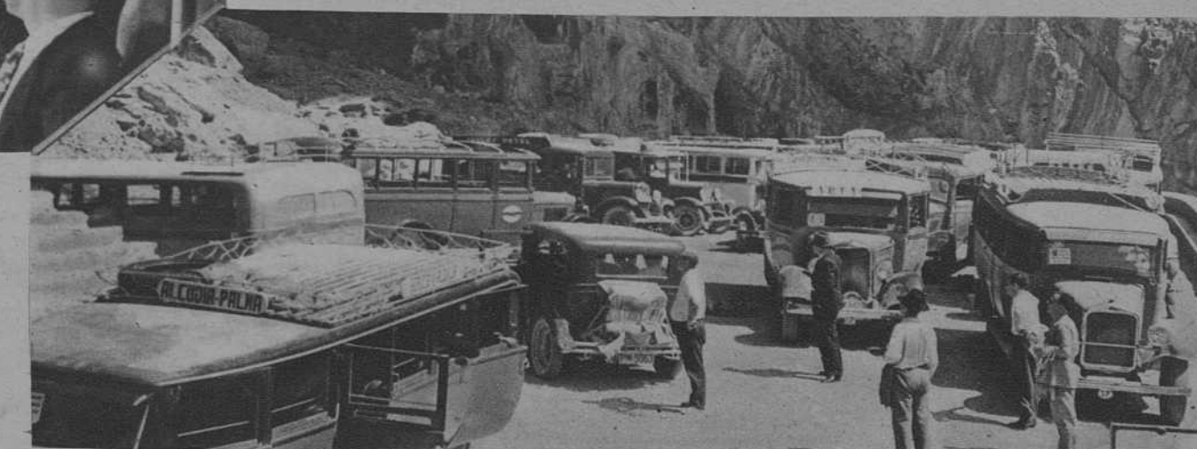
Parte de los autocars utilizados para trasladar a los expedicionarios a las Cuevas de Artá