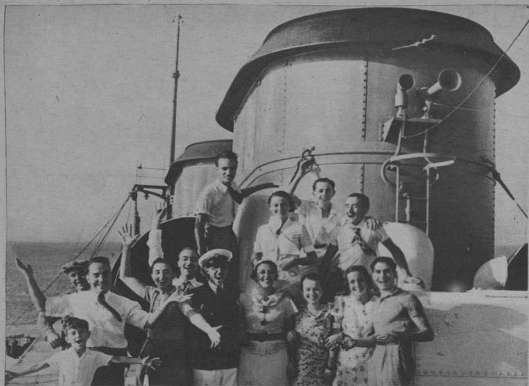
Grupo de jóvenes excursionistas