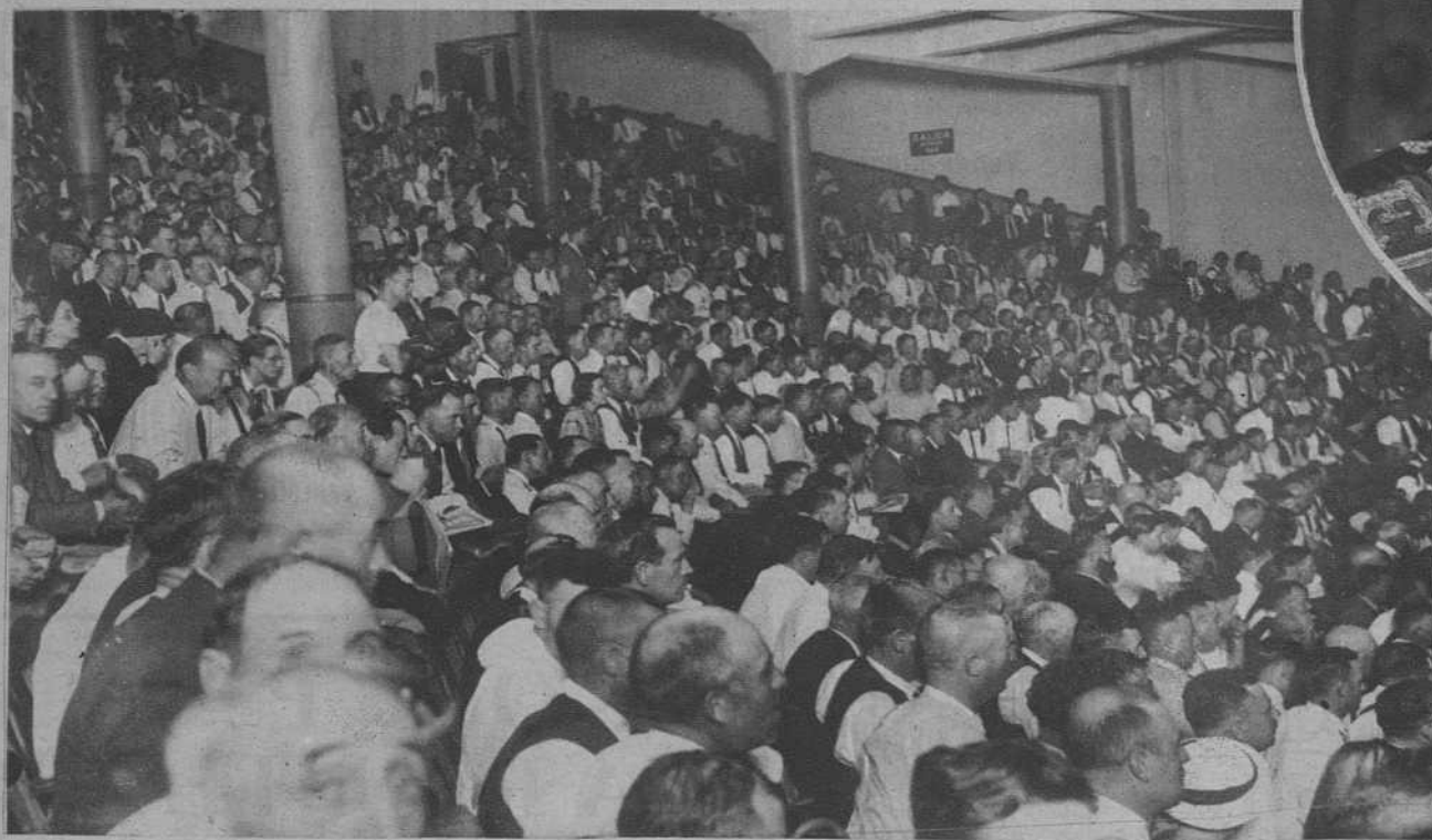
Aspecto de una de las galerías altas