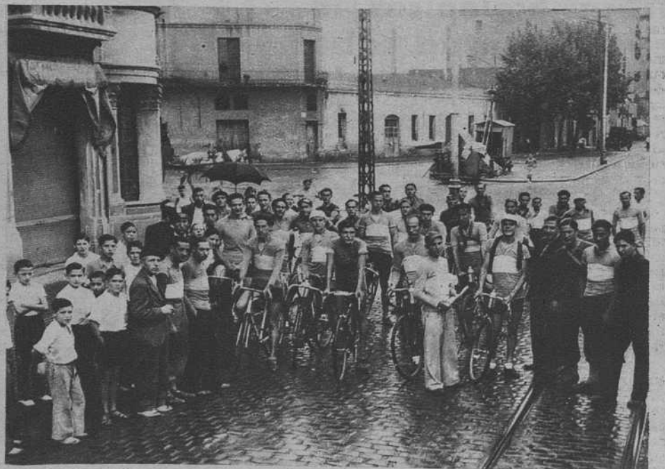
Los participantes en la prueba V Campeonato social, organizado por la Peña Ciclista Pueblo Nuevo