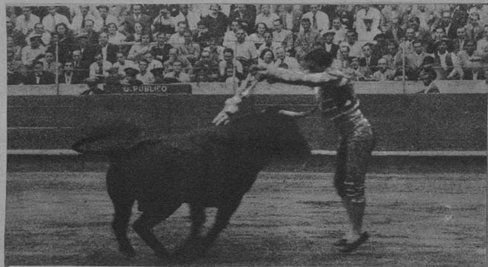
La corrida del domingo en la Monumental.—Carnicerito de Méjico, en un par de banderillas.