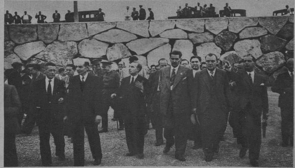
El señor Guerra del Río, acompañado de las autoridades recorriendo el puerto