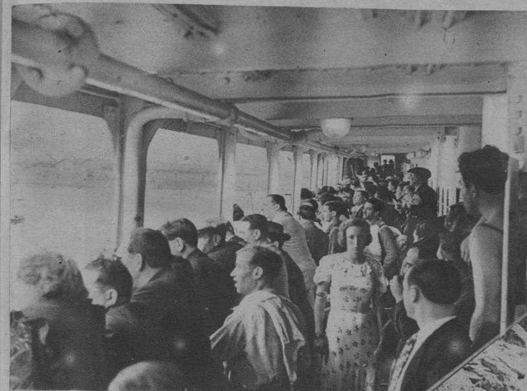
El regreso a Barcelona