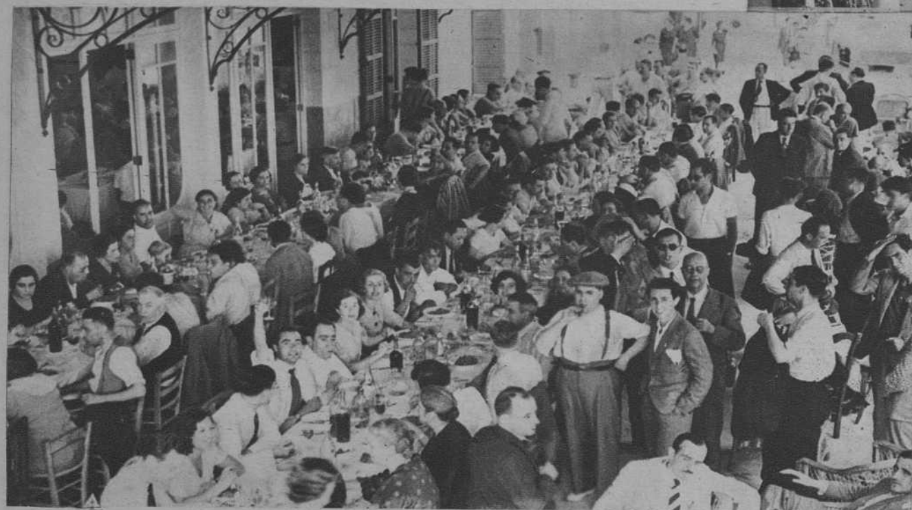
La comida en el Hotel Perello, de Porto Cristo