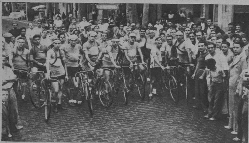
Salida de los participantes en la carrera de la «Agrupación Germania», en San Adrián de Besós.