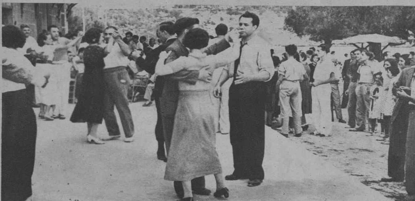
Los excursionistas, bailando en Porto Cristo