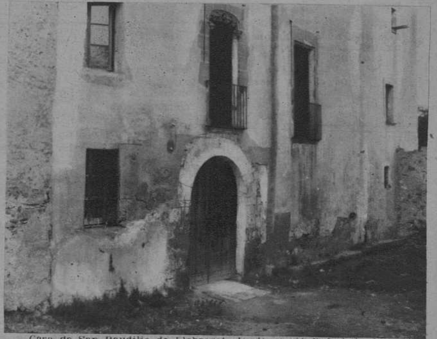
Casa de San Baudilio de Llobregat, donde murió Rafael de Casanova