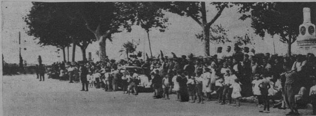
El público, en la Plaza de Macià, esperando el paso del ministro