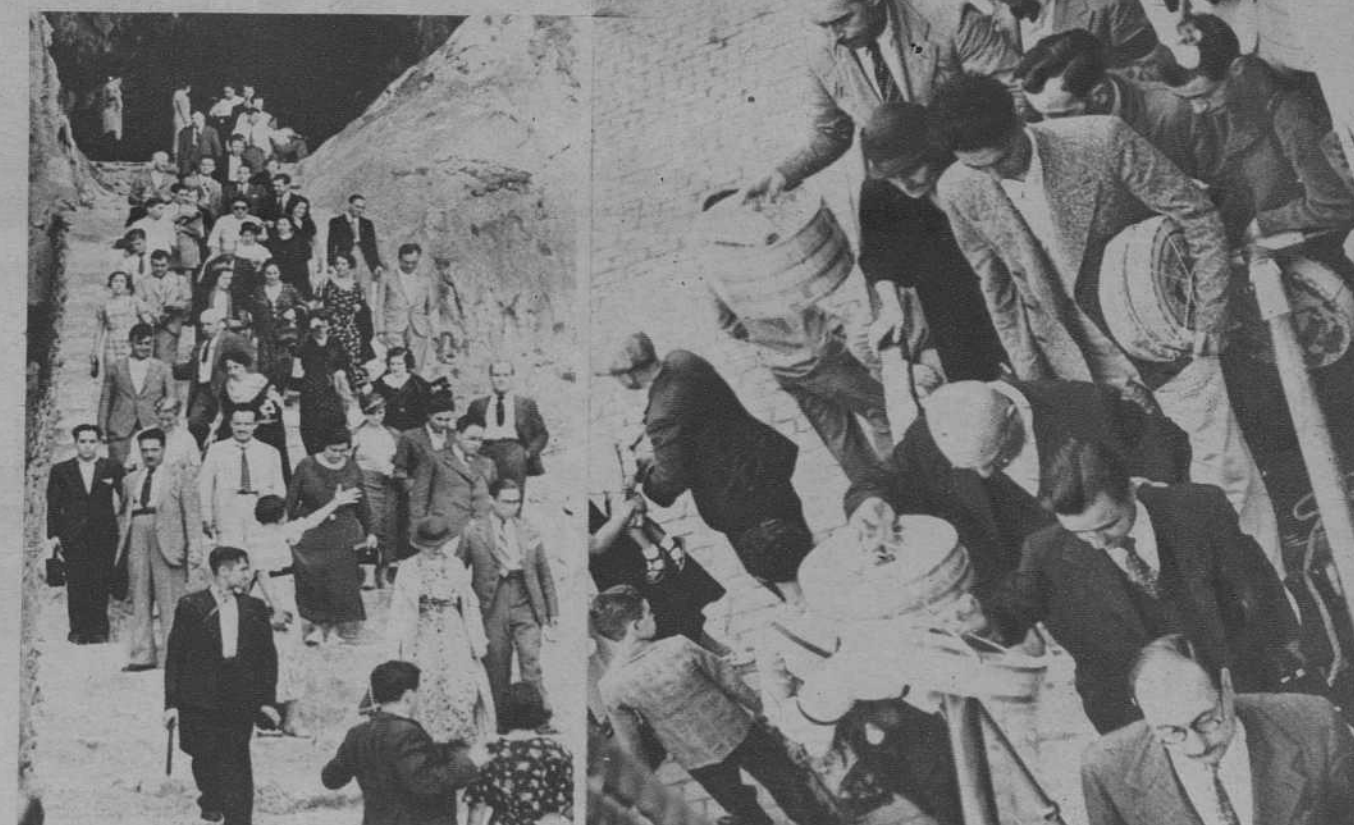
Saliendo de las Cuevas de Artá