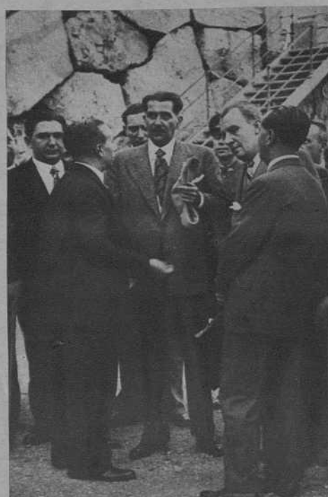
El alcalde, dando explicaciones acerca de las necesidades del puerto al ministro.