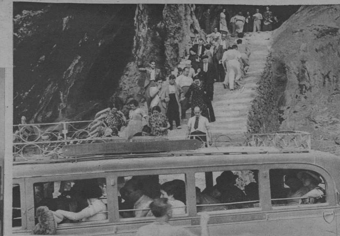
Saliendo de la visita a las Cuevas de Artá