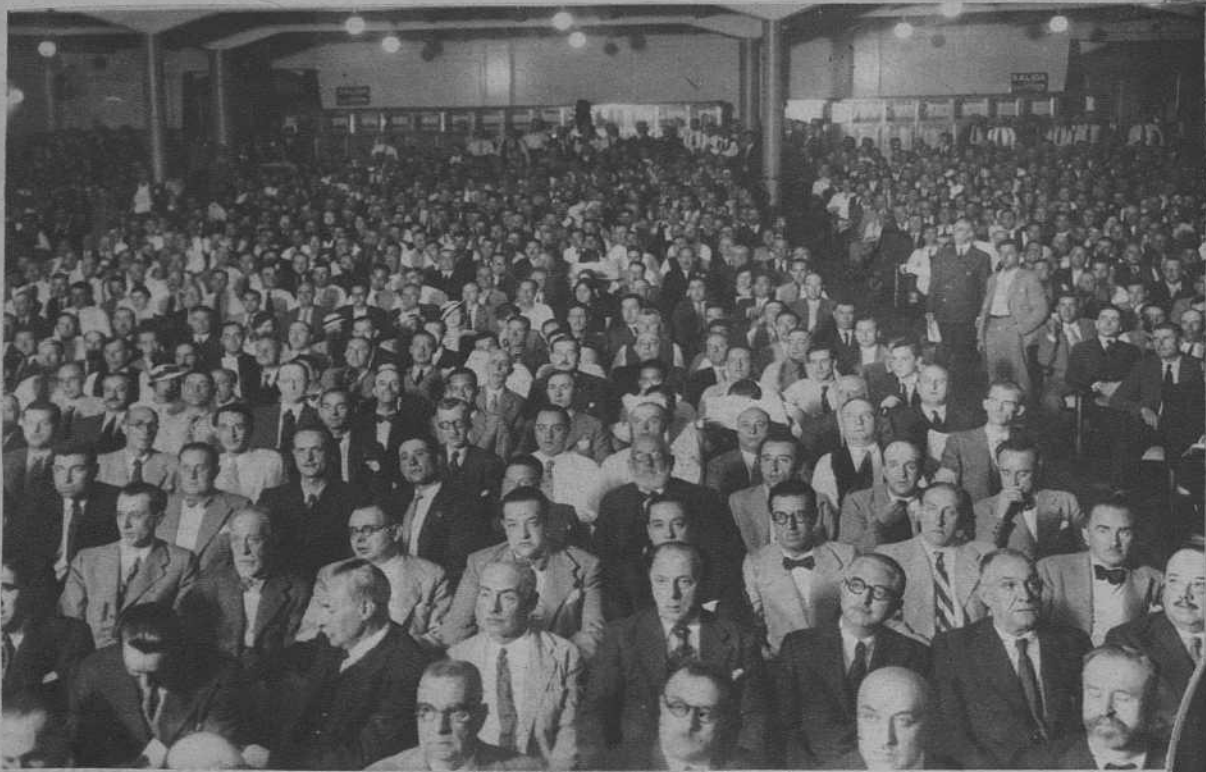
La platea del Monumental Cinema