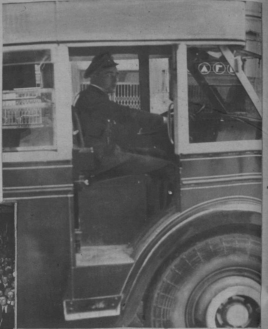
Un guardia de Asalto, conduciendo un autobús del servicio público.