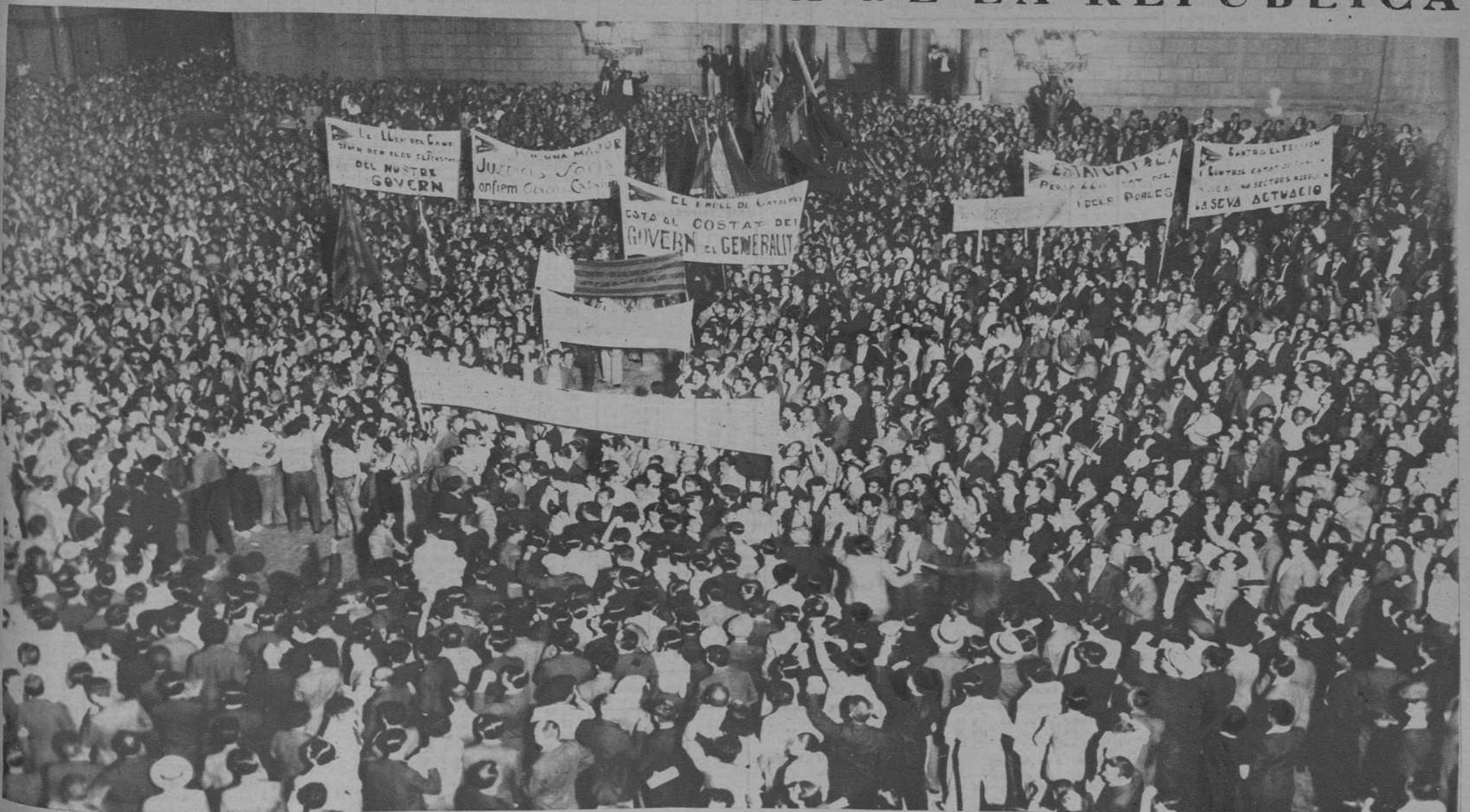
Llegada de la manifestación organizada por los partidos de izquierda para protestar contra las apelaciones hechas, en el mitin celebrado en Madrid, por el Instituto Agrícola Catalán de San Isidro, en menoscabo de la autoridad del Parlamento de Cataluña y de la Generalitat