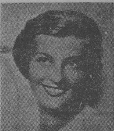
MISS FINLANDIA, QUE HA SIDO ELEGIDA MISS EUROPA, EN HASTINGS

Afortunadamente, no ha habido que lamentar desgracias personales, pero los daños materiales se calcula que ascienden a dos millones de yens. —Fabra.