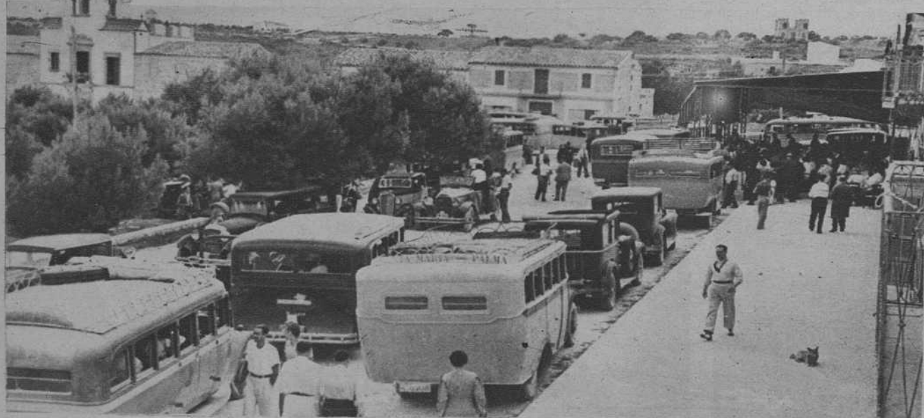
Los expedicionarios, en Porto Cristo