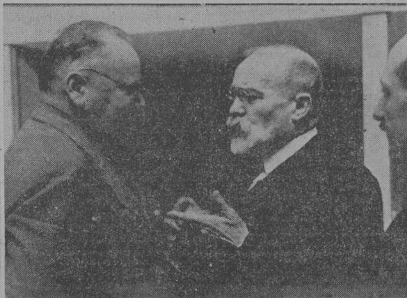
LITVINOV Y BARTHO

Sociedad de Naciones, que, afortunadamente, ha comenzado en un ambiente de optimismo muy distinto de la que se celebró el año pasado, llena de dudas e inquietudes, a la merced de las maniobras de Alemania.