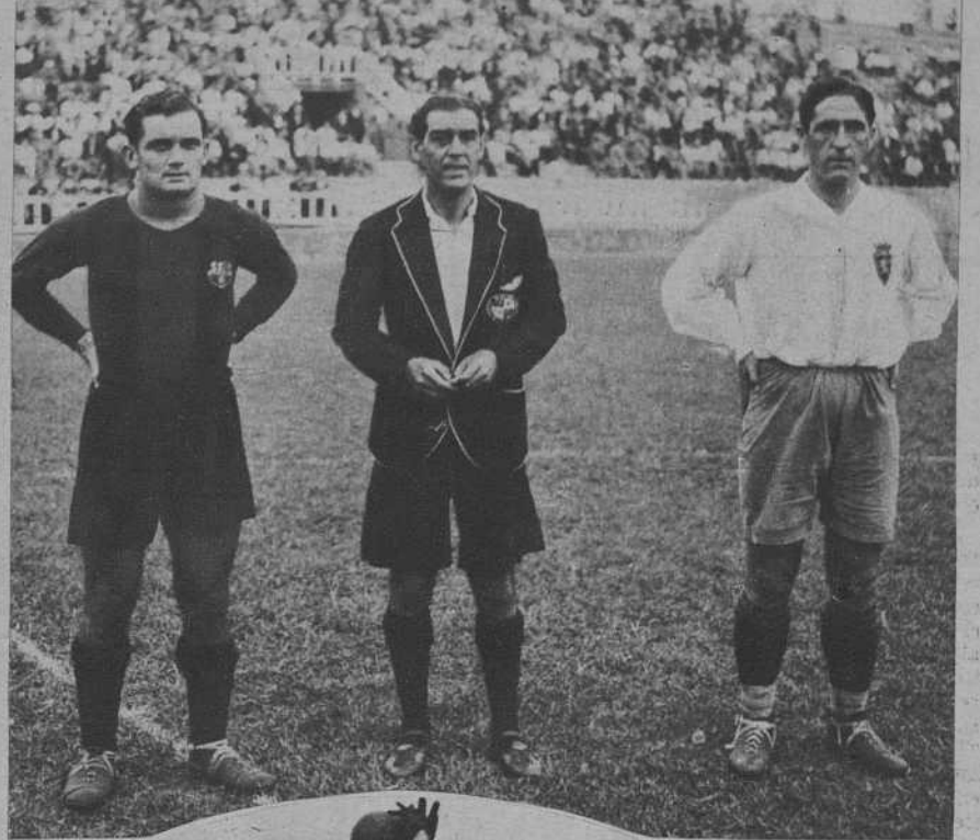
Los capitanes y el árbitro.