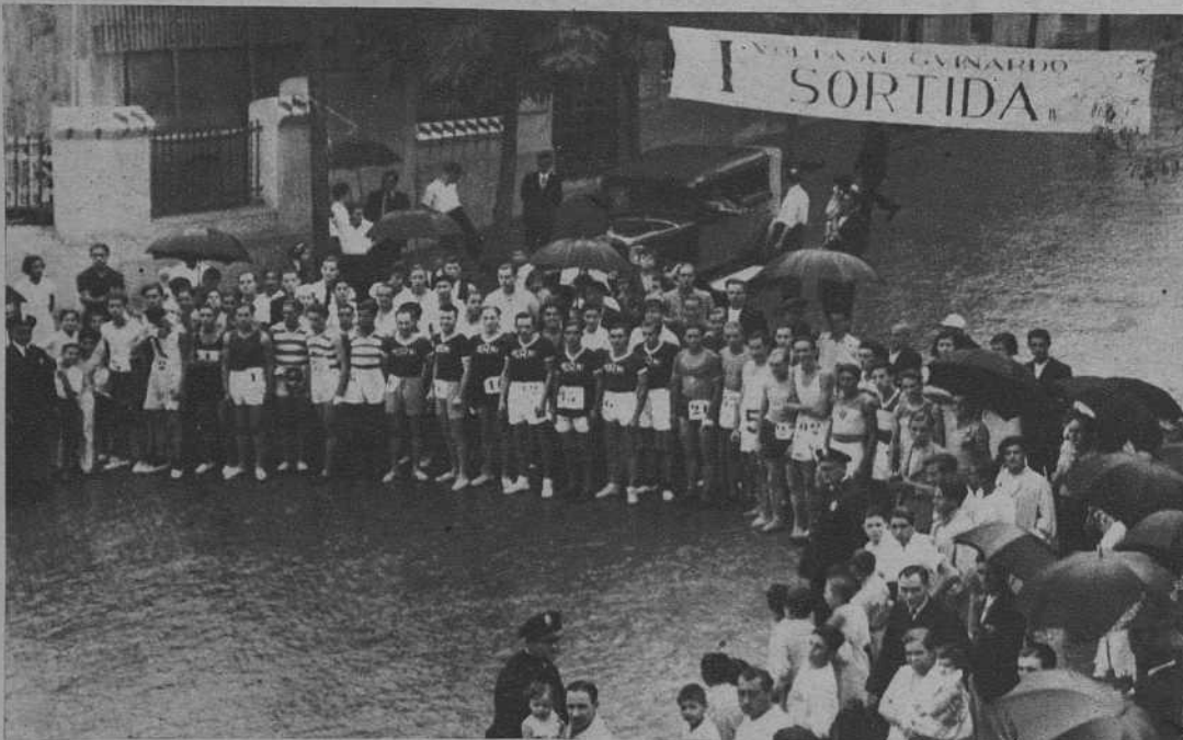
Salida de los participantes en la I Vuelta al Guinardó