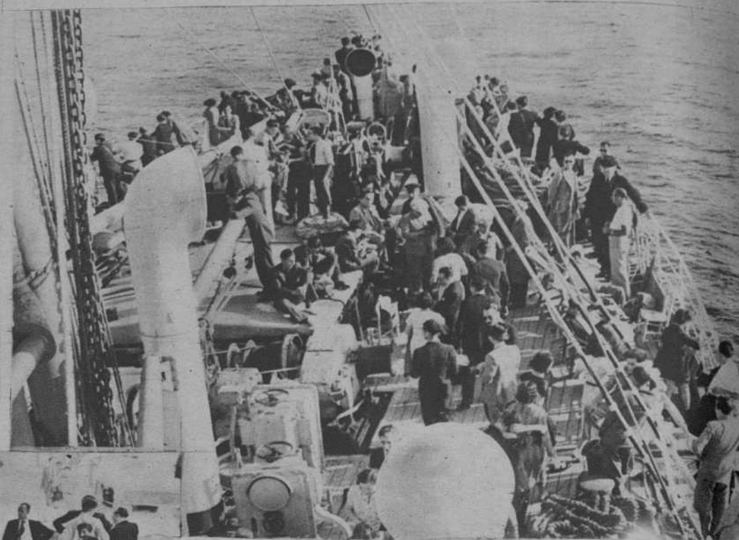
Un aspecto de la proa del «Ciudad de C.»