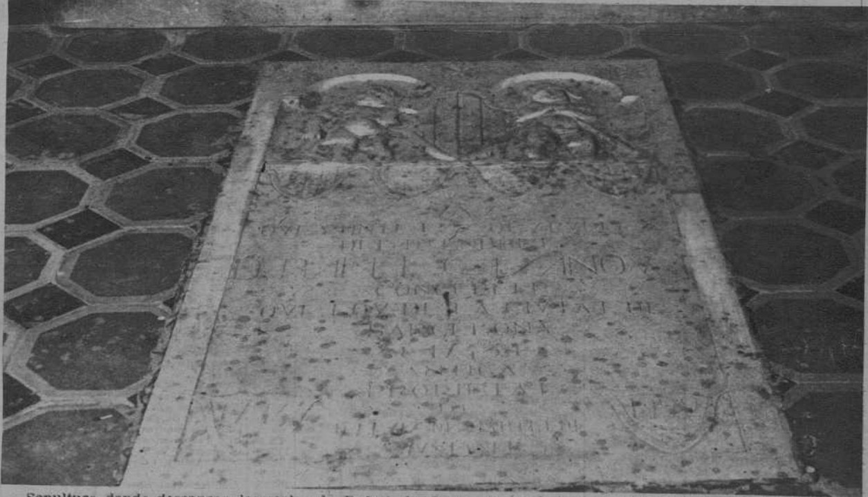
Sepultura donde descansan los restos de Rafael de Casanova, enclavada en la iglesia de San Baudilio