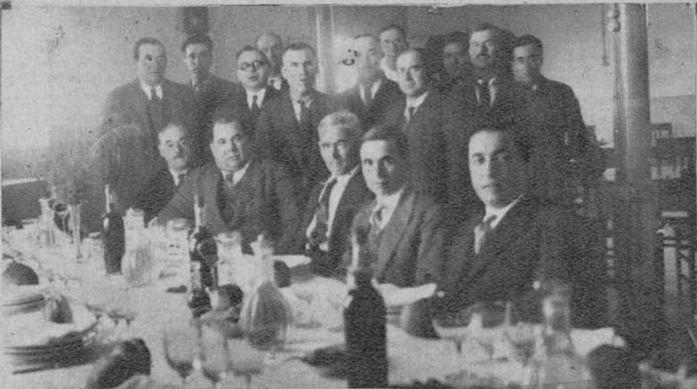
Montblanch.—El nuevo Consejo directivo de la Federación Agrícola de la Conca de Barbará.