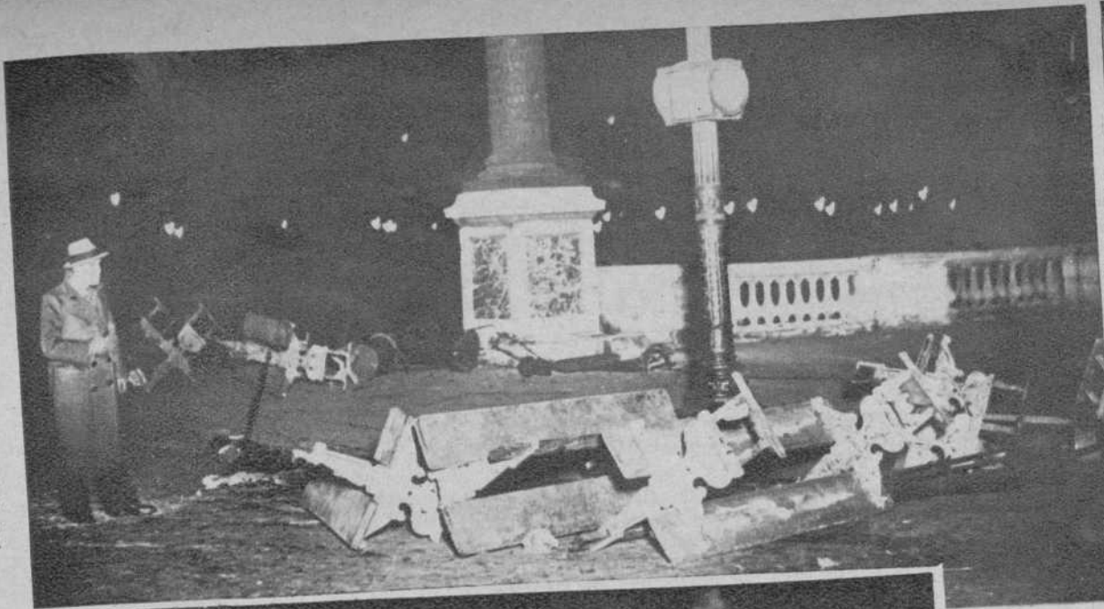
Los destrozos causados por los manifestantes en la Plaza de la Concordia.