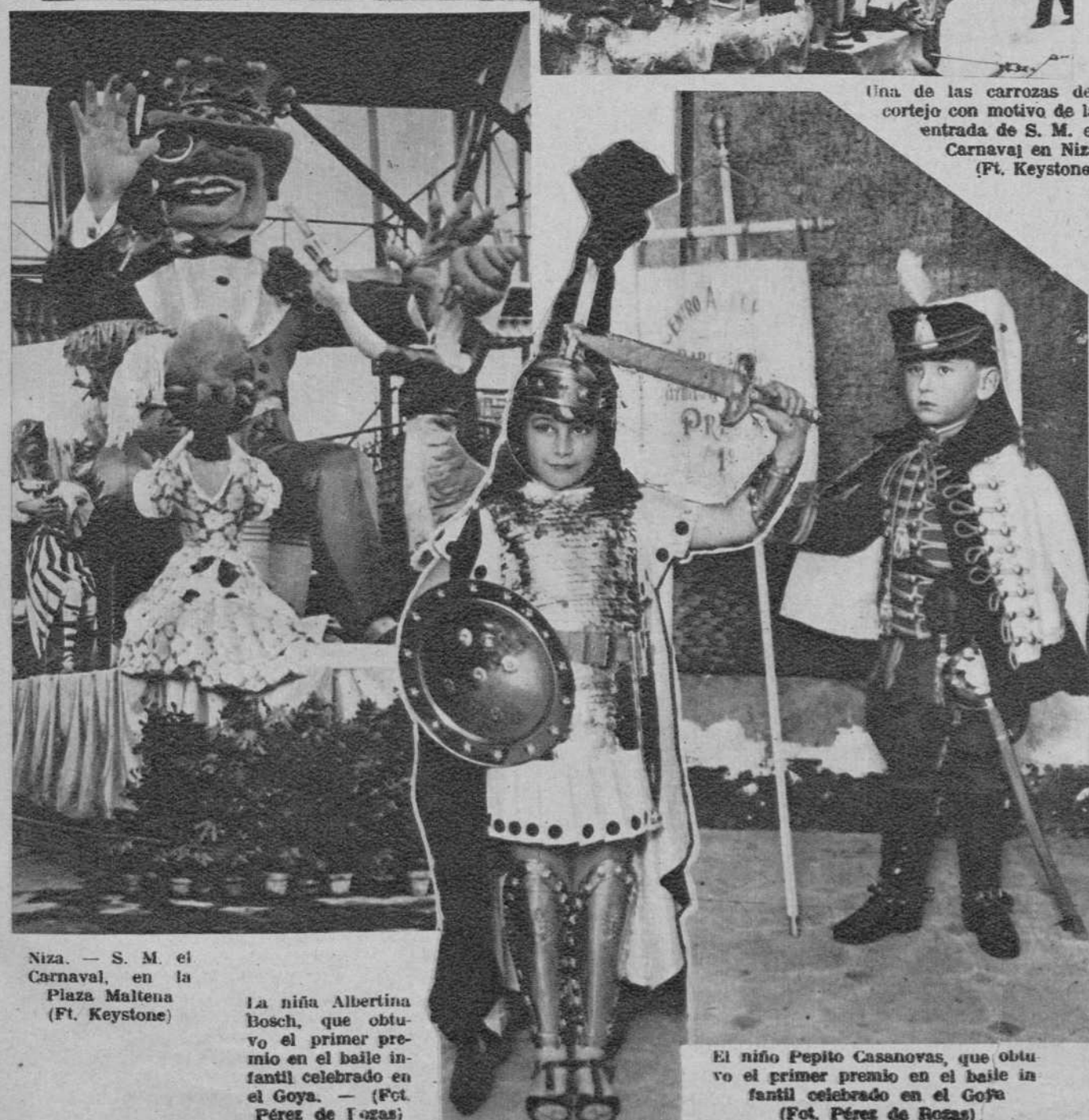
Niza.— S. M. el Carnaval, en la Plaza Malteña