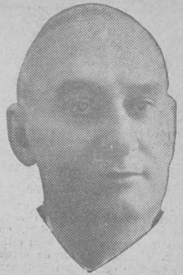
ALVEAR EN LISBOA