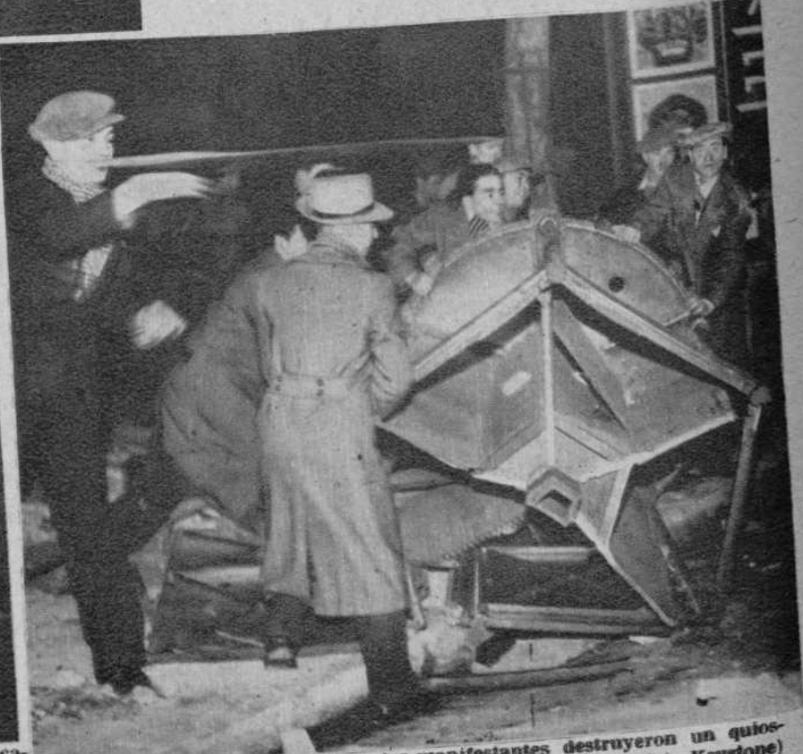
En el Boulevard Sebastopol, los manifestantes destruyeron un quiosco de periódicos, para levantar una barricada.