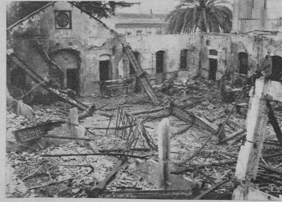
Valencia.— Una fábrica de muebles, destruida por el fuego, ascendiendo las pérdidas a 200.000 pesetas.