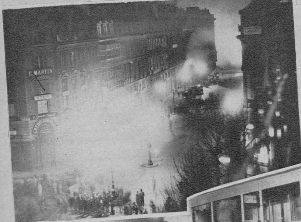
En la calle Royale, donde está instalado el ministerio de Marina, los manifestantes intentaron incendiar el edificio, acudiendo los bomberos, que lograron dominar el fuego.