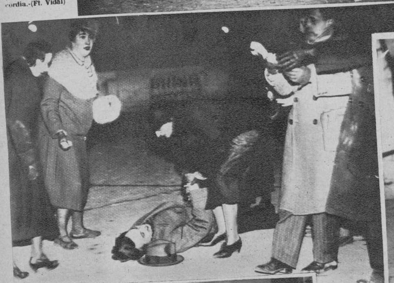
Una señora, identificando a uno de los manifestantes, que cayó sin sentido.