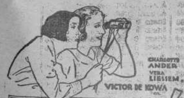
VICTOR DE KOWA