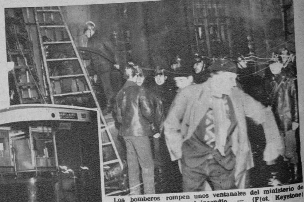
Los bomberos rompen unos ventanales del ministerio de Marina, para dominar el incendio.