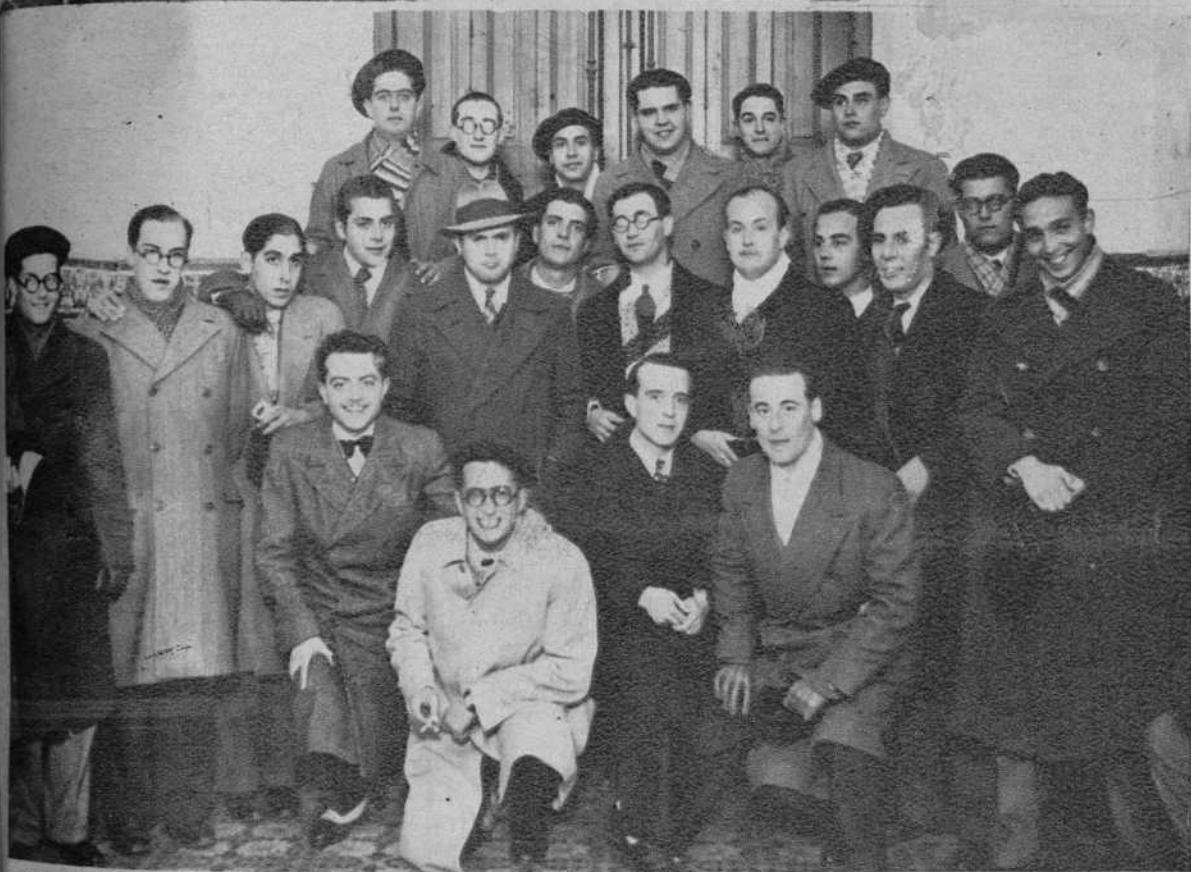
Los alumnos del último año de Medicina de Sevilla, que se encuentran en Barcelona y que se dirigen a Francia y Suiza para visitar las más importantes clínicas de dichos países.