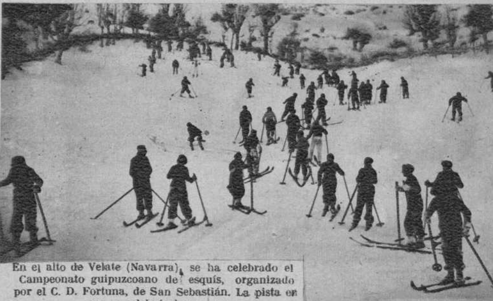
En el alto de Velate (Navarra), se ha celebrado el Campeonato guipuzcoano de esquí, organizado por el C. D. Fortuna, de San Sebastián. La pista en que se celebró el concurso