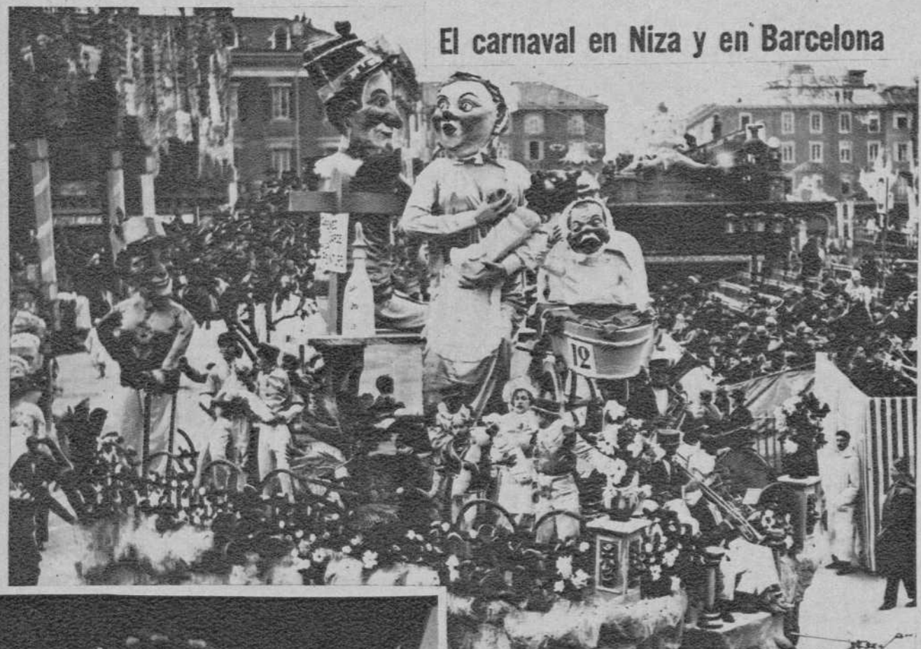
El carnaval en Niza y en Barcelona