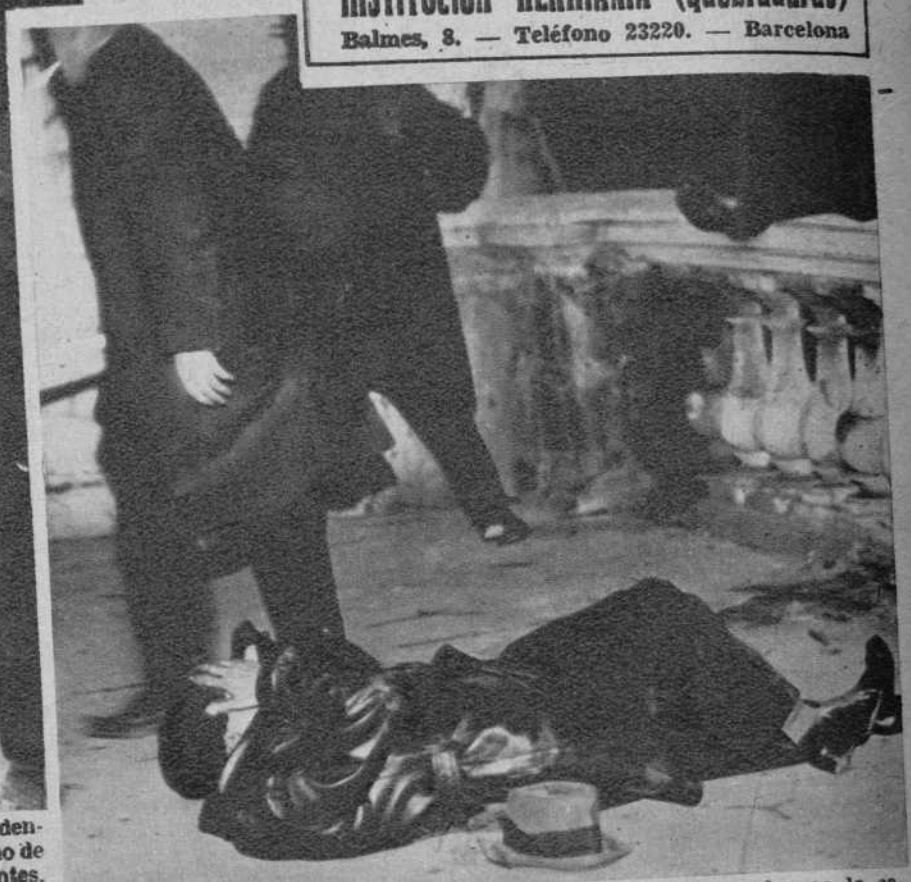
Un manifestante, al que acaba de darle un agente, un golpe en la cabeza, con la porra.