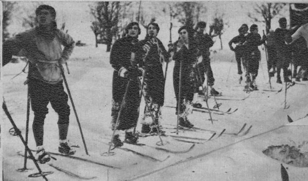
Bellos alpinistas donostiarros, que participaron en el Campeonato.