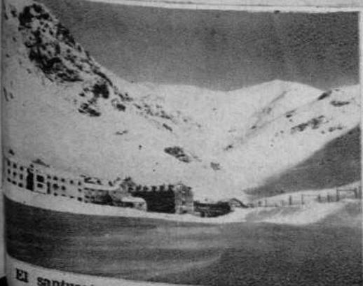
El santuario de Nuria, rodeado de nieve