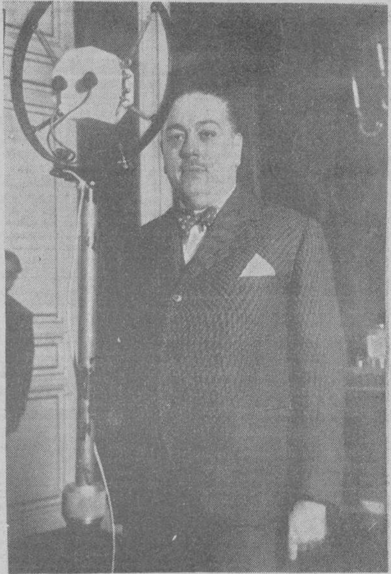
DON DIEGO MARTINEZ BARRIO