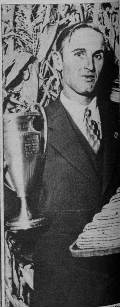
El dueño de una granja californiana, acaba de recibir en Chicago una copa de plata, como premio a su esfuerzo para que la tierra produzca el bello maíz que puede verse en la fotografía

Agua de Azahar "La Giralda" el sedativo de los nervios