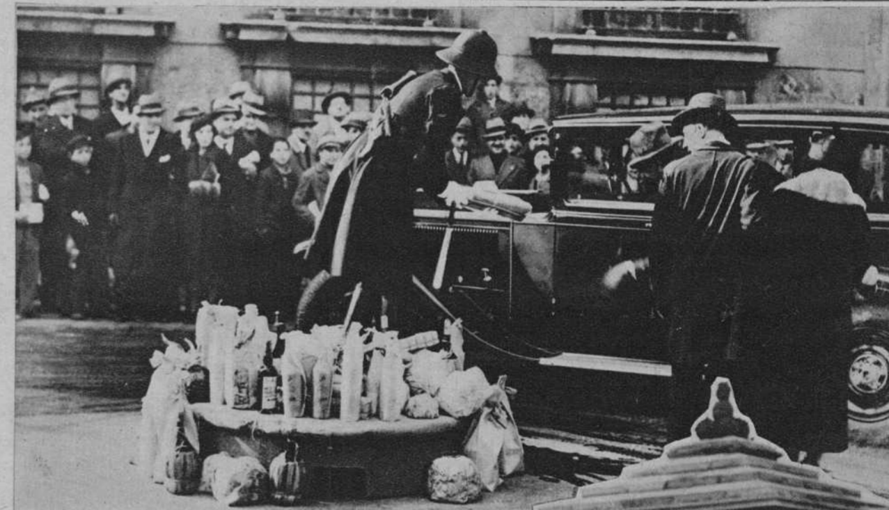
Roma.—Los agentes de la circulación son obsequiados todos los años por los propietarios de autos, con regalos. Un agente va amontonando los regalos en su puesto de observación.