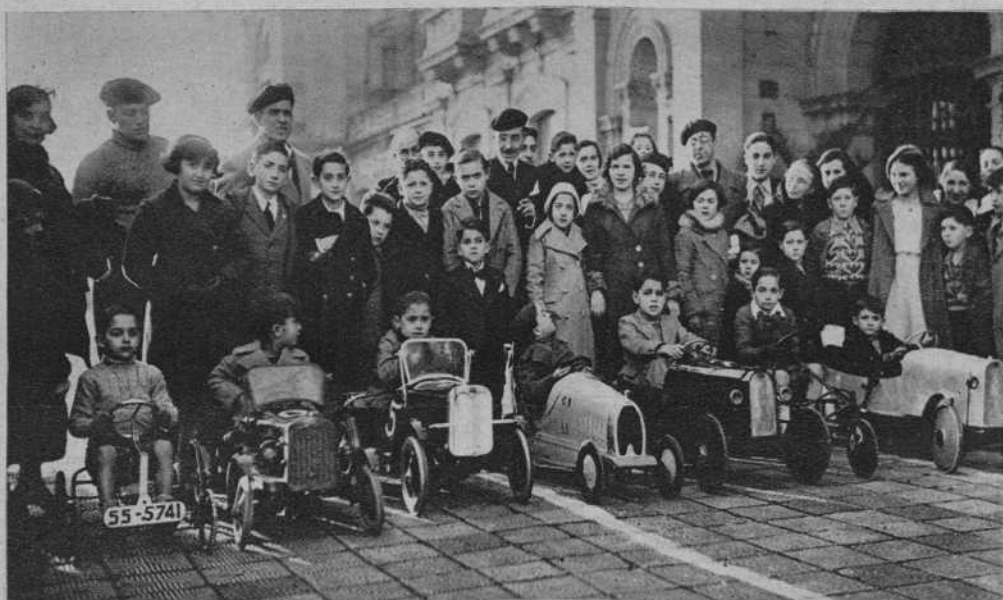
San Sebastián.—Niños que participaron en la carrera de automóviles.