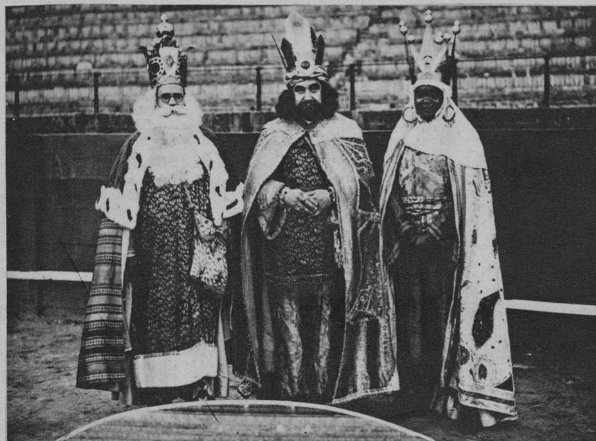
Sevilla.—La fiesta de los Reyes Magos, alcanza todos los años gran esplendor, rivalizando los artistas en vestirse con elegancia y riqueza a los reyes de la infancia, que aparecen en la fotografía.