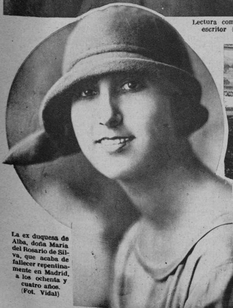
La ex duquesa de Alba, doña María del Rosario de Silva, que acaba de fallecer repentinamente en Madrid, a los ochenta y cuatro años.