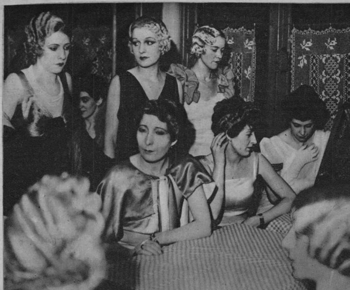
Un desfile retrospectivo de peinados de 1860 a 1934, ha sido organizado por la Escuela Profesional de Peinado, de París, pudiéndose apreciar en la fotografía, en la parte superior, uno de los de 1934, y en la inferior, algunos de 1900.