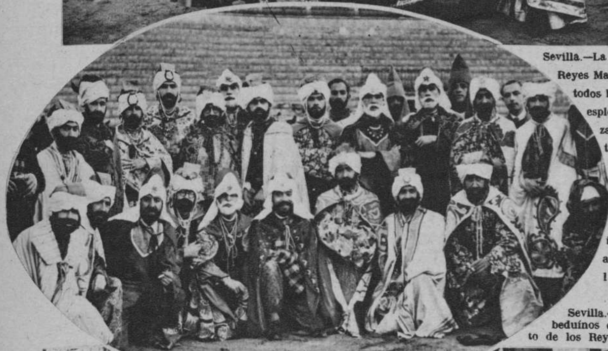
Sevilla.—Grupo de beduinos del séquito de los Reyes Magos.