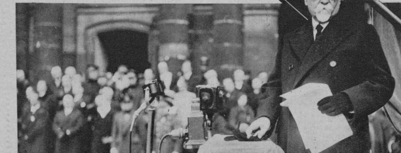
París.—El ministro de Justicia, pronunciando el elogio fúnebre del general Dubail, en el patio de honor de los Inválidos.