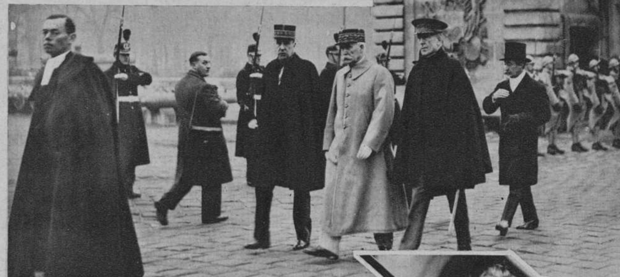
París.—El mariscal Petain y dos agregados militares extranjeros, en el entierro del general Dubail, gran canciller de la Legión de Honor.