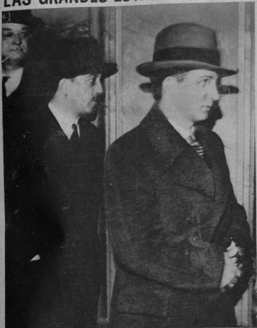
Uno de los colaboradores de Stavisky, el ex director del teatro «Empire», de París, y al que la policía había dejado suelto, al enterarse de que se había dictado contra él orden de detención, se ha presentado en la Dirección de Seguridad, siendo trasladado a Bayona