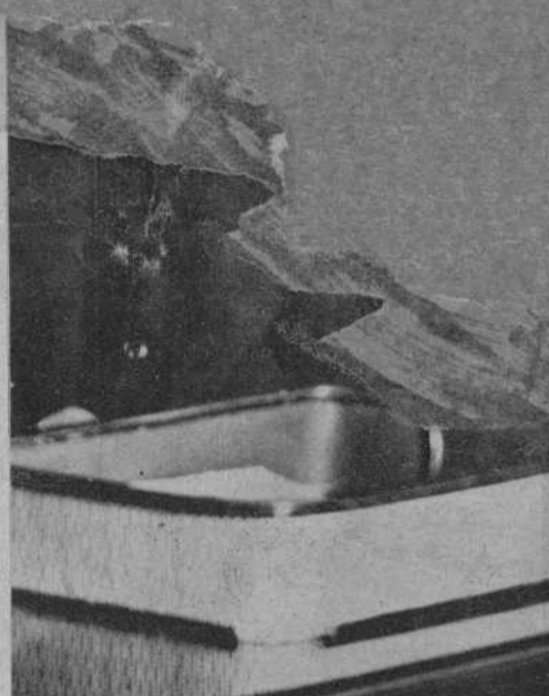
Don Tomás Ramón Amat, ex gobernador civil de Tarragona, que ayer tomó posesión del cargo de Comisario General de Orden Público de Cataluña.