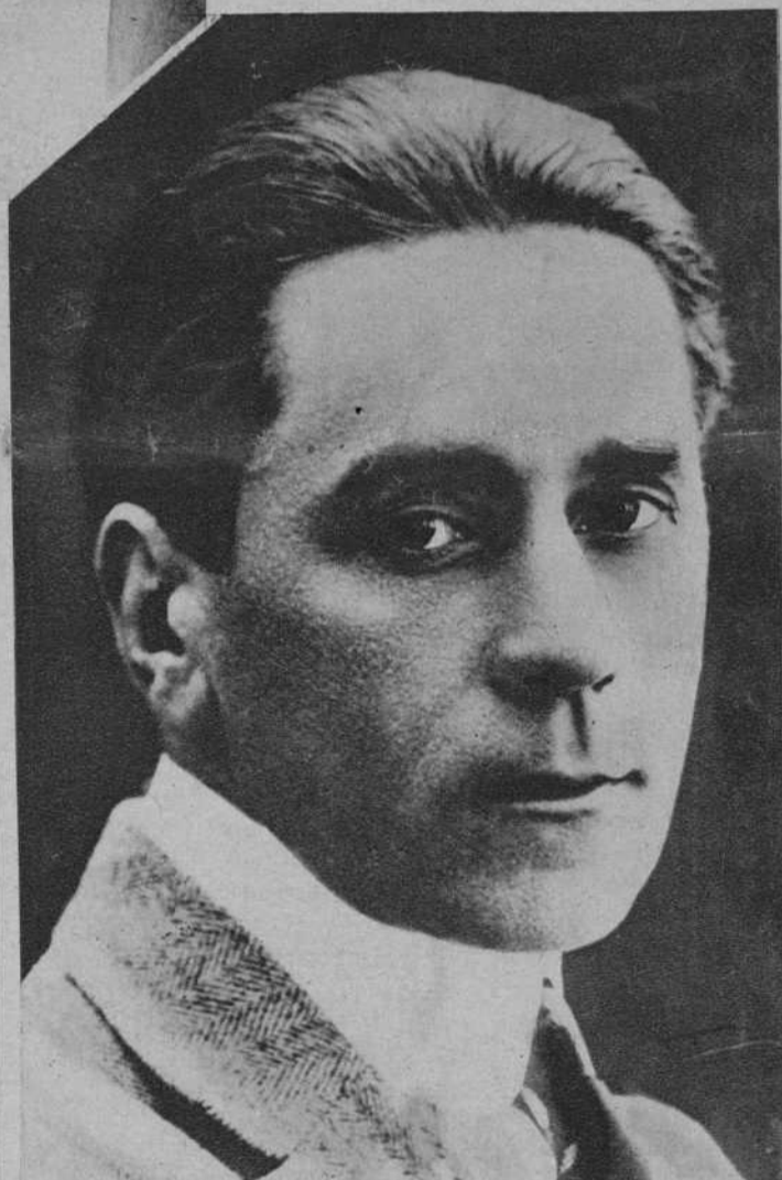
El nuevo jefe del Gobierno rumano, señor Tatarescu