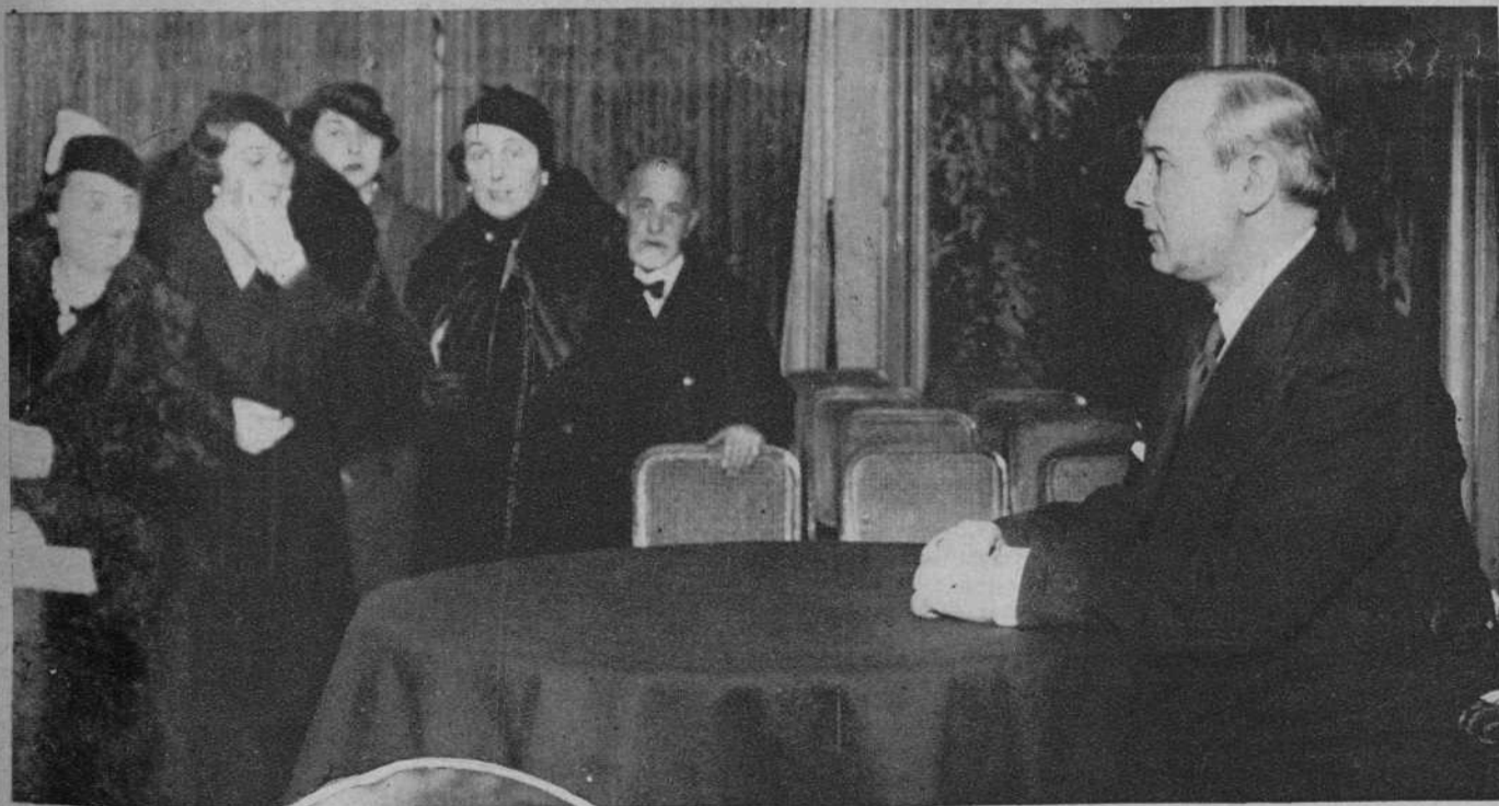
Lectura comentada de la «Divina Comedia», de Dante, por el escritor italiano marqués Pietro Miscianelli, en el Conferencia Club.