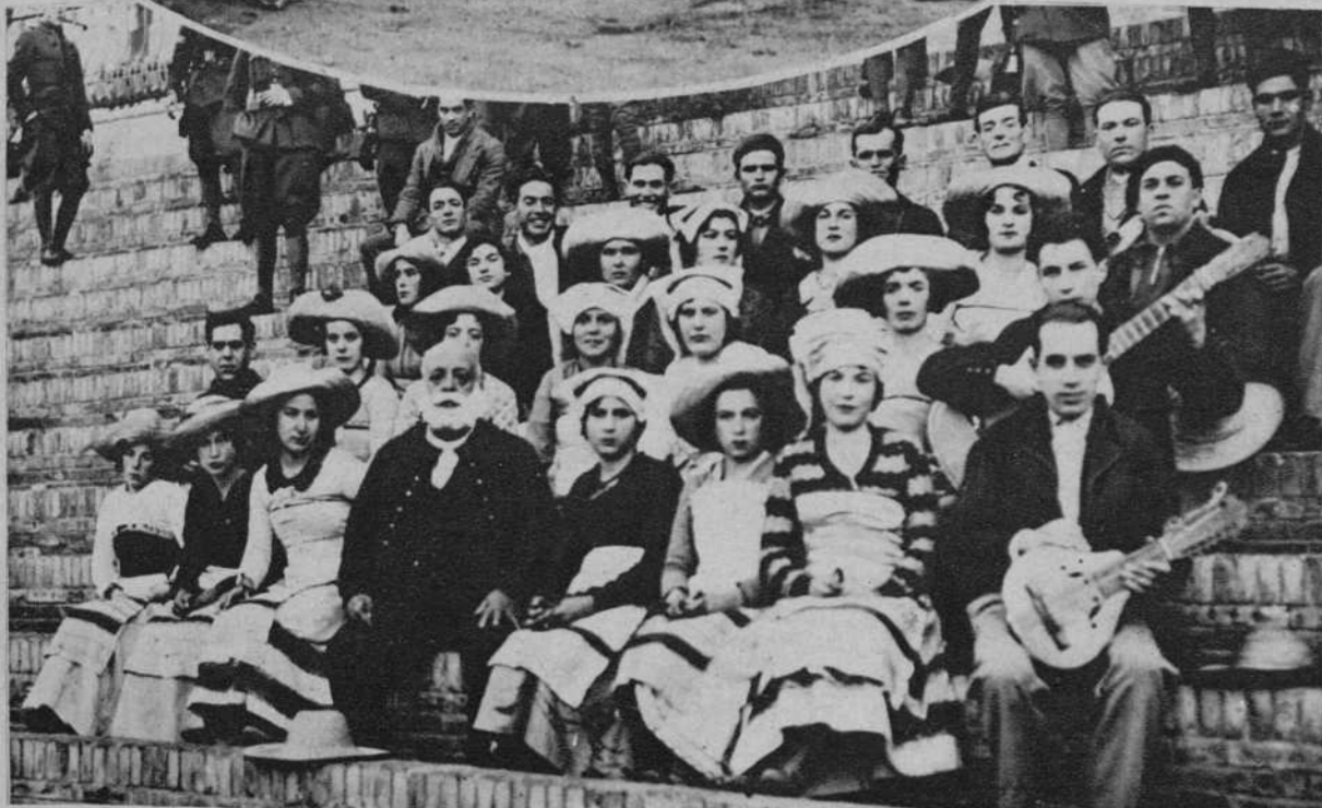
Sevilla.—Coro de pastores de Borrijo, que participaron en la cabalgata de los Reyes Magos.