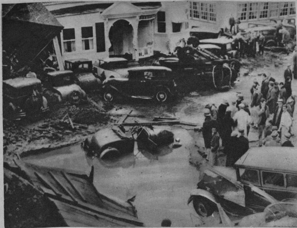
Una tremenda tromba de agua ha causado, en California, grandes daños, pues la tromba fue acompañada de un temblor de tierra. La fotografía número 1 ofrece los restos de un Club nocturno de Los Angeles, con los automóviles destruidos, y la fotografía número 2, automóviles completamente enterrados en el fango, habiendo perecido 32 personas.