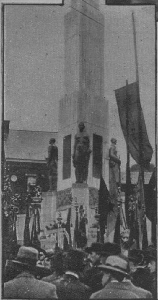
El monumento a los muertos de Wasmes, cerca de Mons, en la Gran Guerra