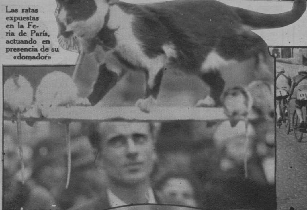
Una escena idílica entre el gato y las ratas