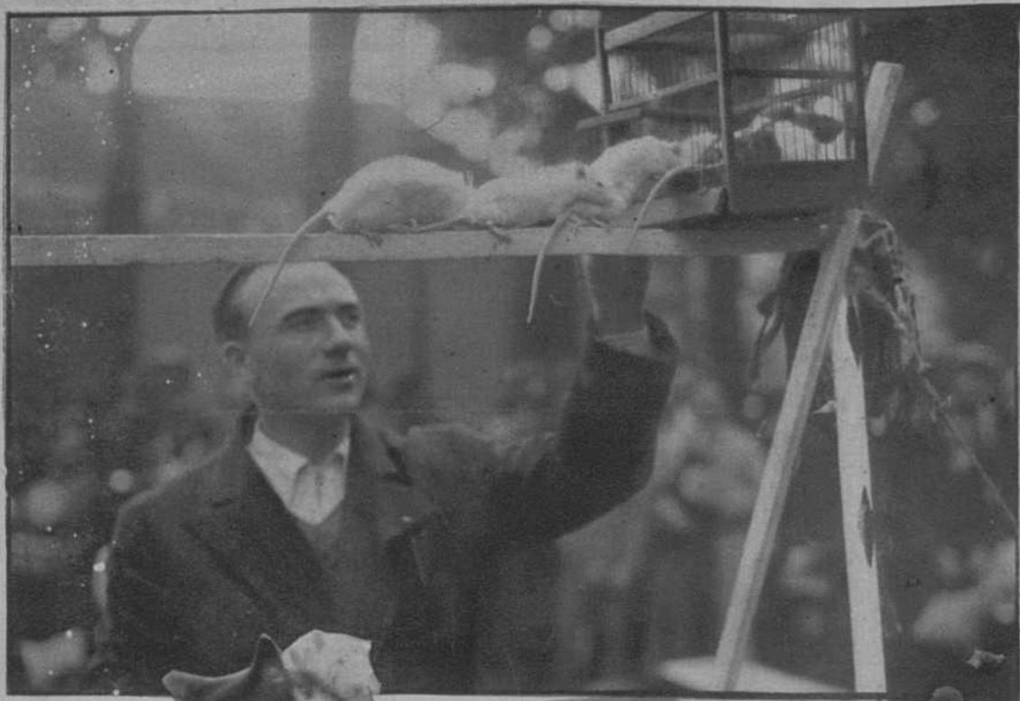
Las ratas expuestas en la Feria de París, actuando en presencia de su «domador»