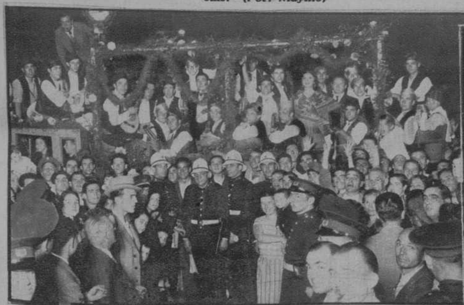
La rondalla del Centro Aragonés, dando un concierto en la Plaza de la República