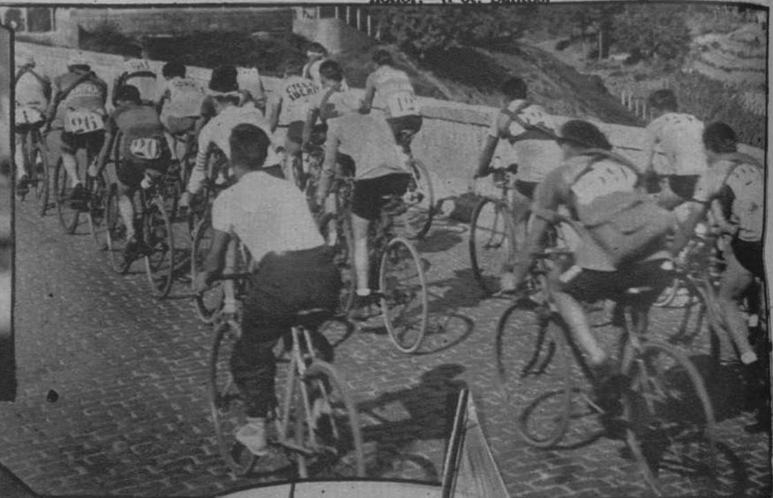
El pelotón del Campeonato ciclista militar, pasa por Esplugas.