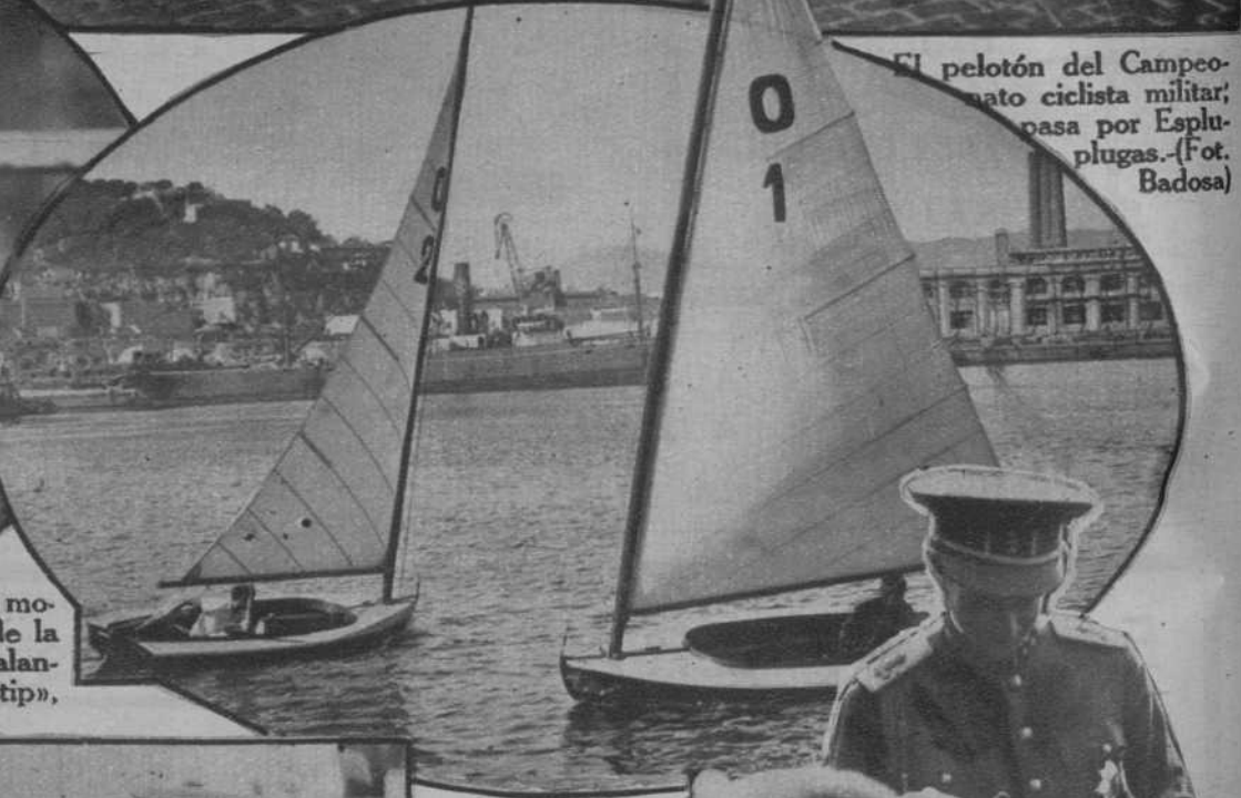
Un momento de la regata para balandros tipo «Monotip», en la copa Furest