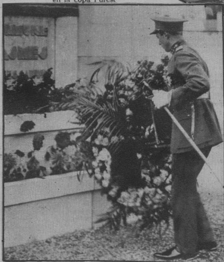
El príncipe heredero, Leopoldo, depositando una corona al pie del monumento