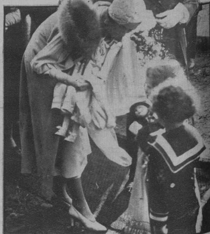
Los niños de Wasmes, ofreciendo a la princesa Astrid una muñeca.