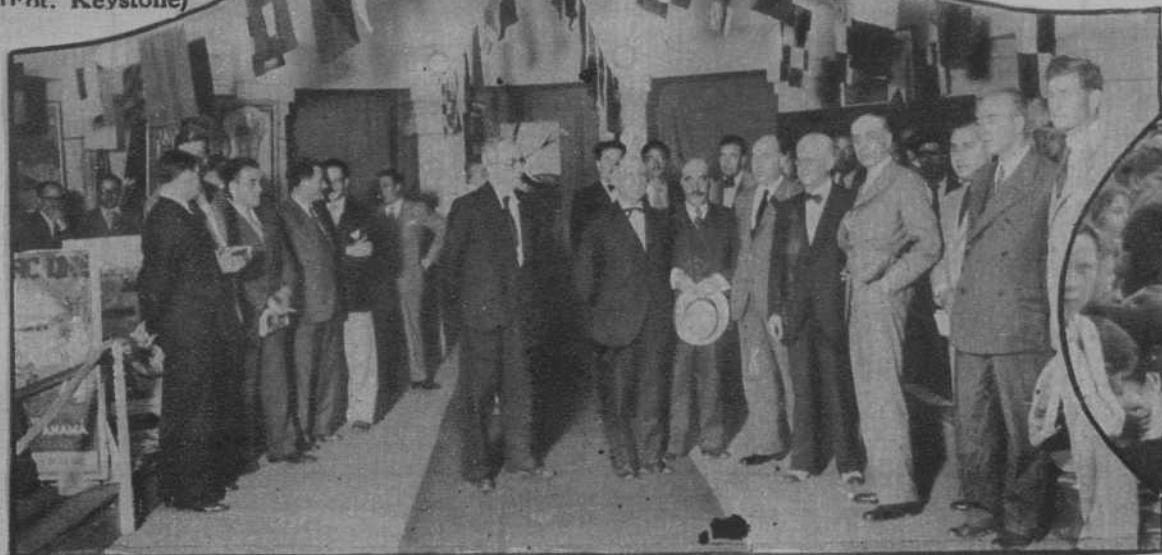
Inauguración de la Exposición de carteles para la propaganda turística española.