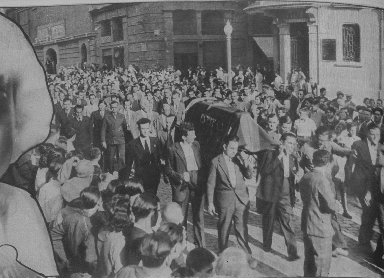
Manresa.—Entierro del chófer que conducía el auto en que iban el señor Badía y otros elementos de las Juventudes de Estat Catalá.