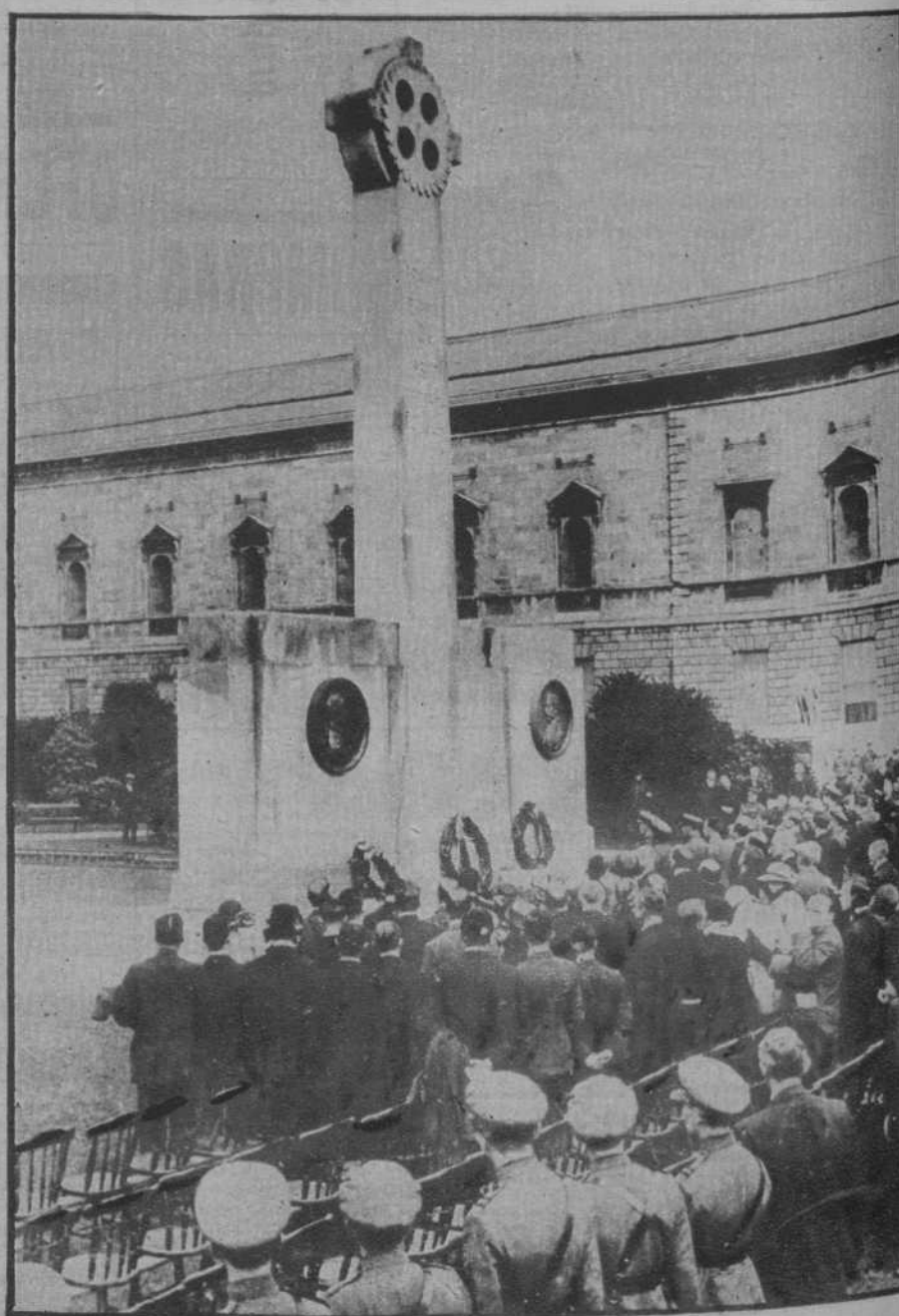
Dublín.—El cenotafio elevado a la memoria de los patriotas irlandeses Collins-Griffith y O' Higgins.