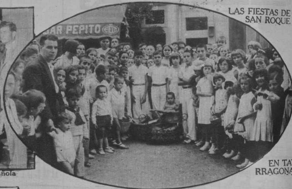
LAS FIESTAS DE SAN ROQUE