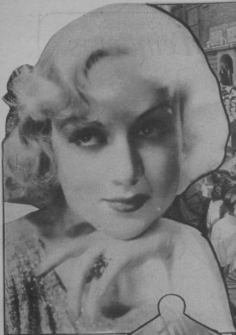
Miss Carola Lombard, star cinematográfica, en una de sus creaciones.