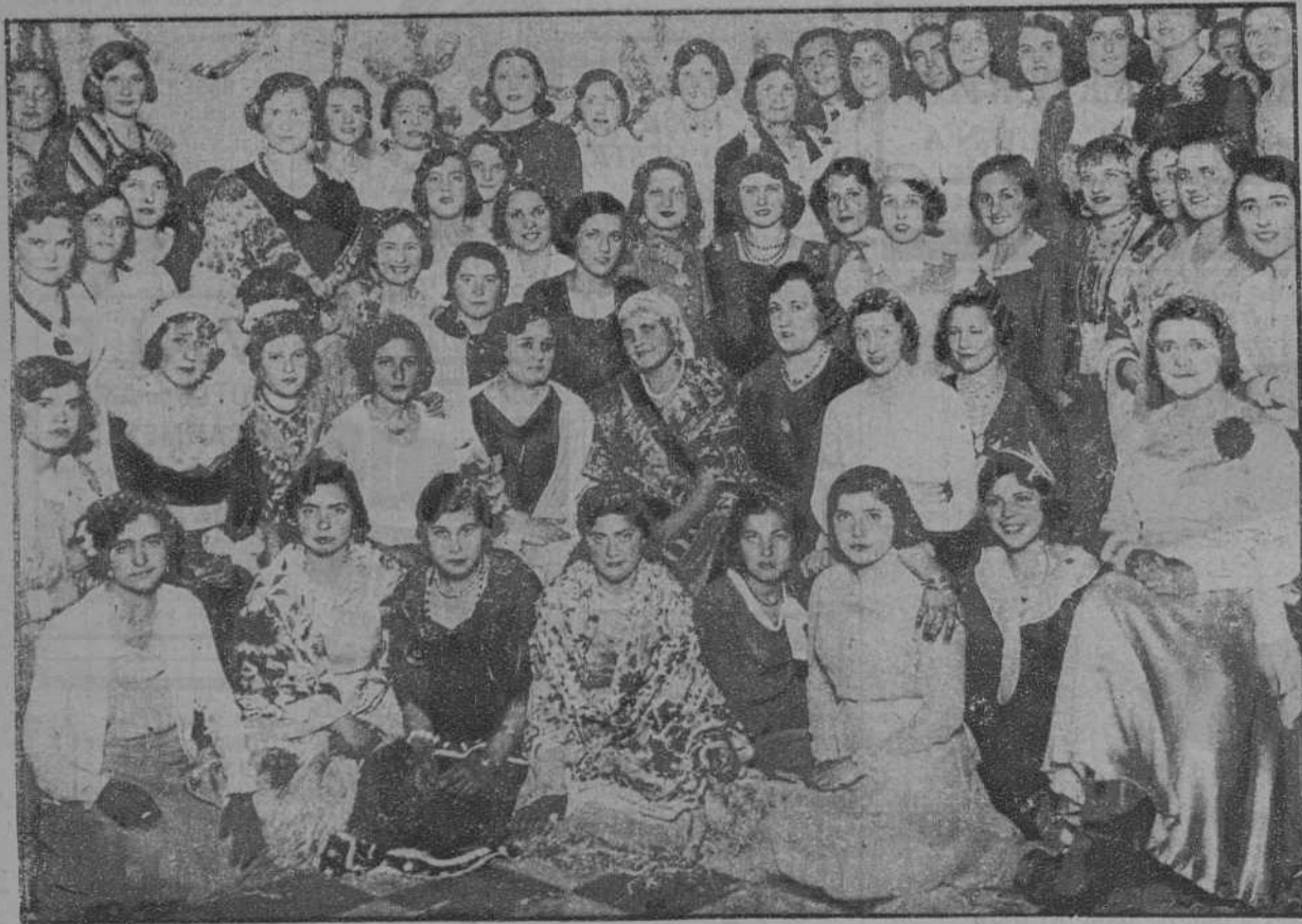
Sevilla.—Fiesta de piñata en el Centro de los ferroviarios