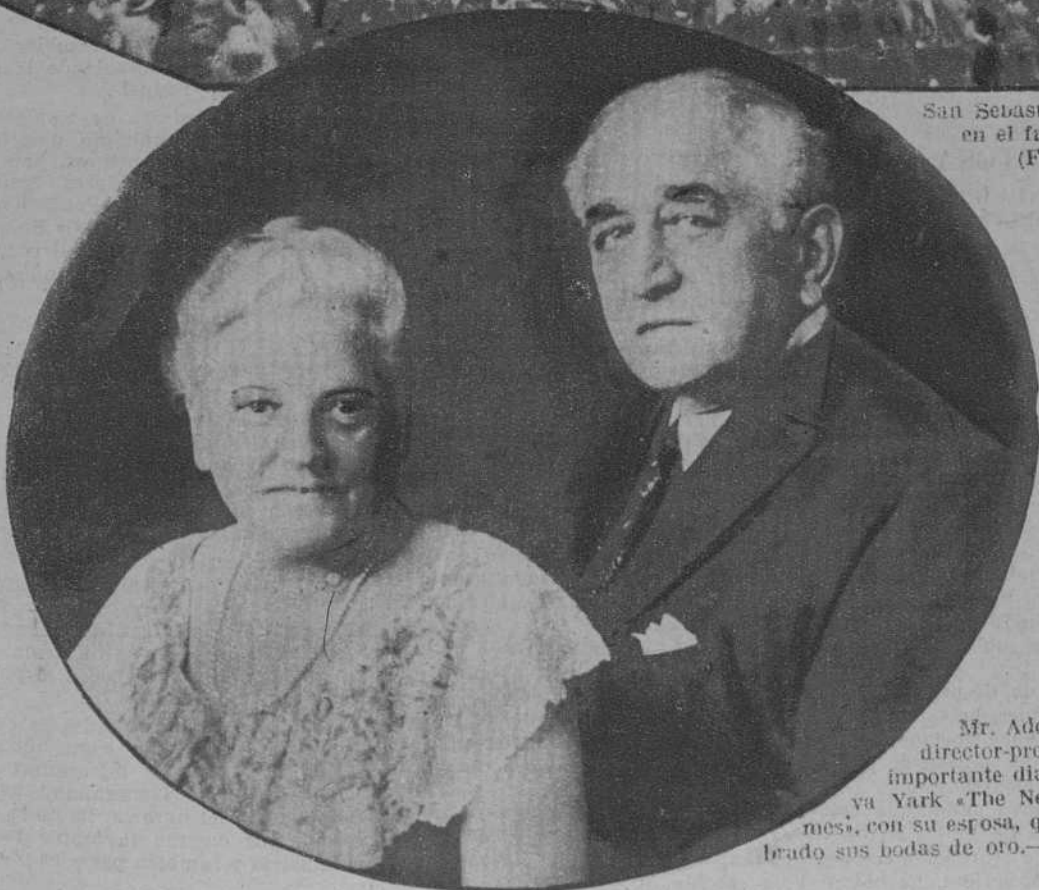
Mr. Adolf S. Ochs, director-propietario del importante diario de Nueva York «The New York Times», con su esposa, que han celebrado sus bodas de oro.