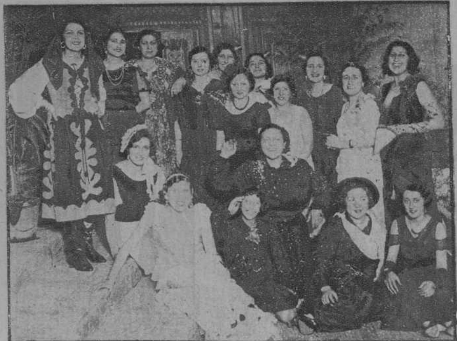
Vigo.—Baile de Piñata, en el Círculo Mercantil