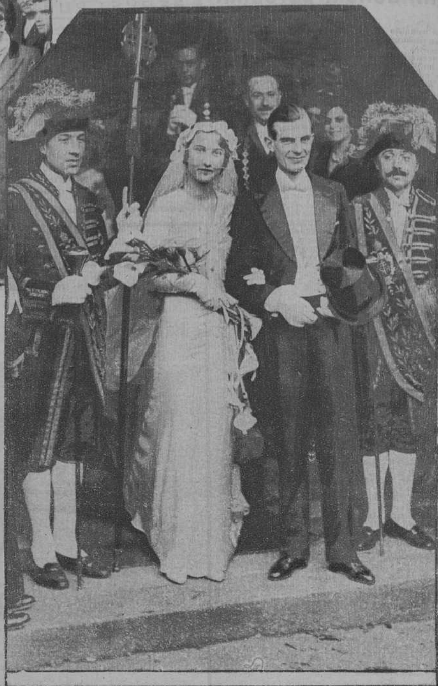
Paris.—Casamiento de la hija del embajador de Bélgica con el conde Viornier de Mortemart.—(Fot. Consorcio)