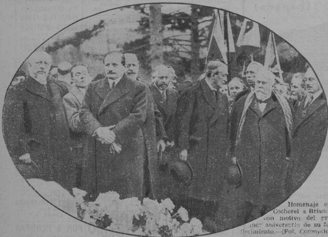
Homenaje en Cocherel a Briand, con motivo del primer aniversario de su fallecimiento.