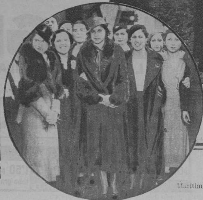
Vigo.—«Miss España», en el Club Marítimo.—(Fots. Pacheco)