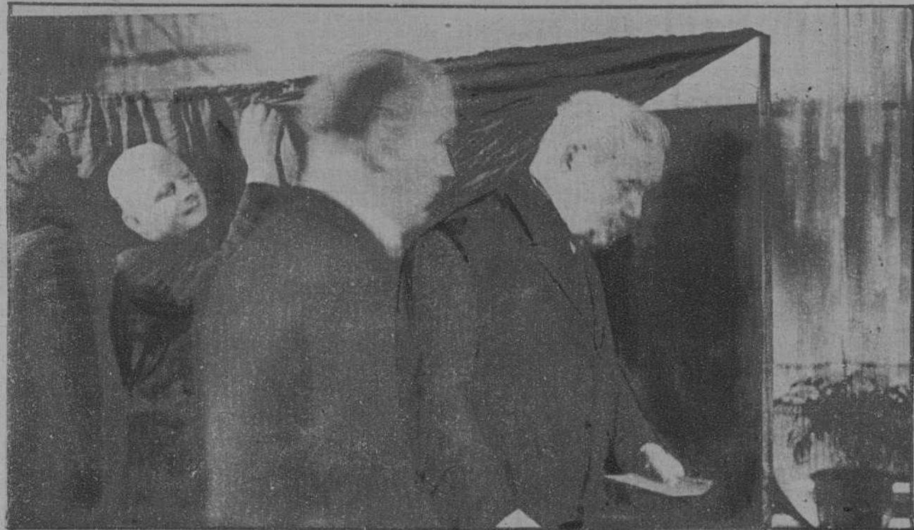
El presidente Hindenburg, depositando su voto.