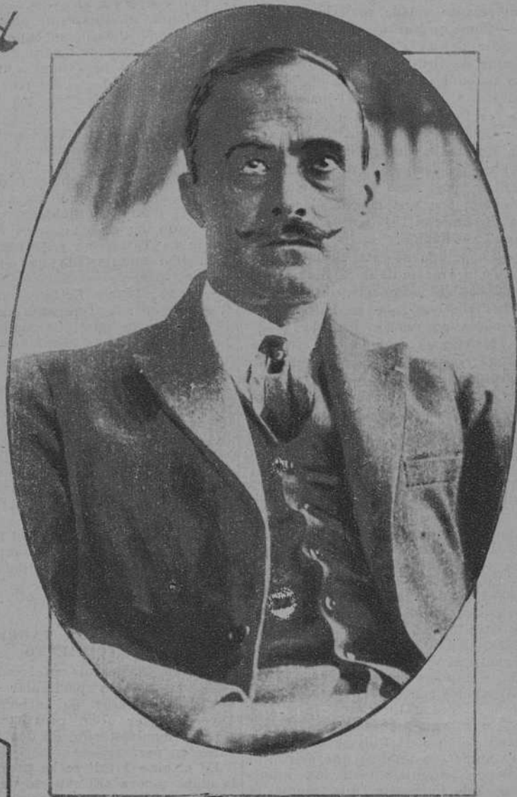
El general Plástor, que fracasó a las veinticuatro horas de haber iniciado su movimiento dictatorial.