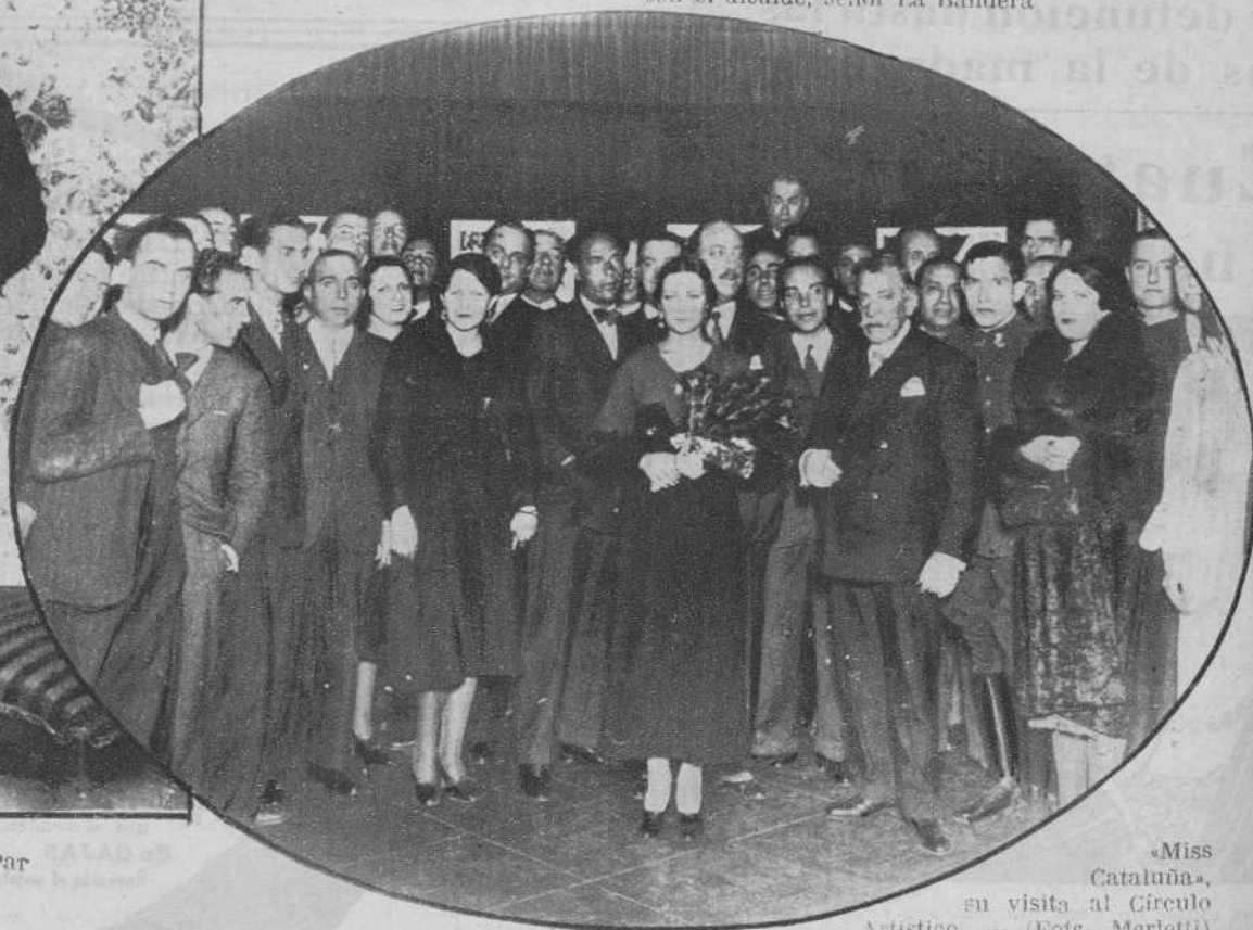
«Miss Cataluña», su visita al Círculo Artístico.