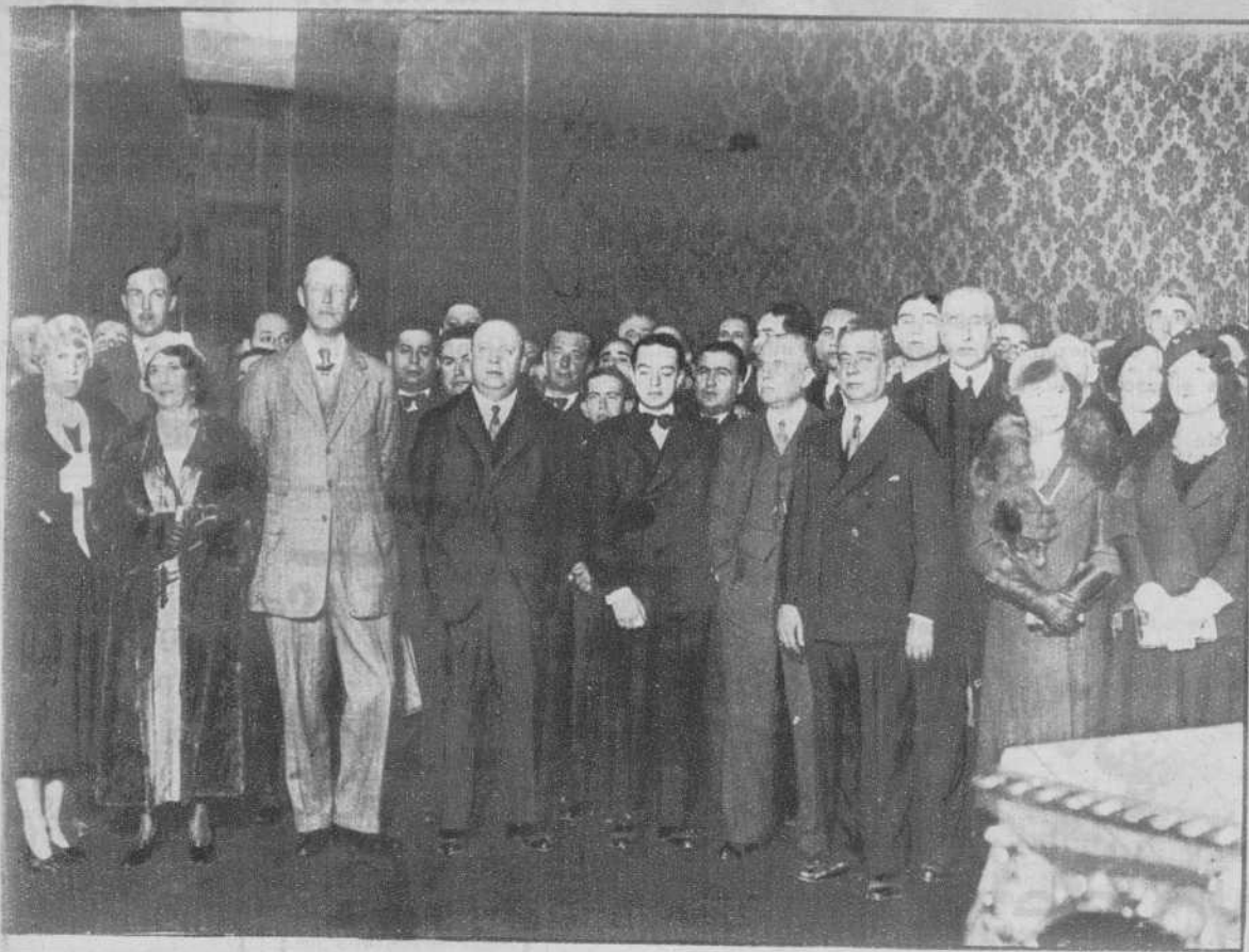
Sevilla.—El ministro de Obras Públicas, con el gobernador de Gibraltarr, el alcalde y jefes y oficiales, en la recepción celebrada en el Ayuntamiento.