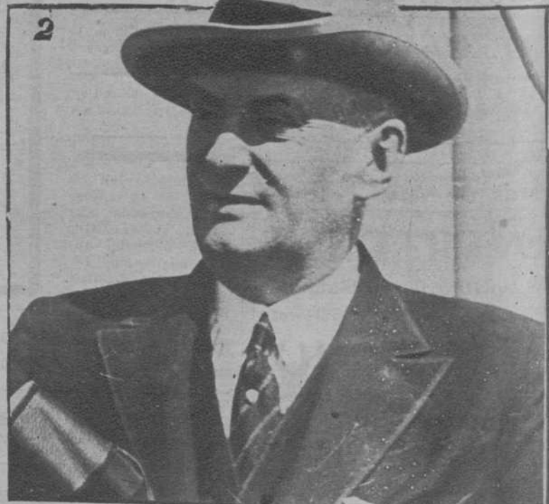
Los ex Presidentes de la Argentina, don Hipólito Irigoyen (1) y don Marcelo Alvear (2), que han sido detenidos y van a ser deportados, como complicados en el complot descubierto con motivo de la explosión de una bomba en la casa de un significado irigoyenista