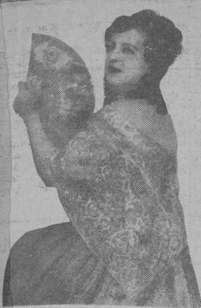
MARIA TELLEZ Bella y celebrada tiple cómica de la compañía lírica que actúa en el Teatro Nuevo