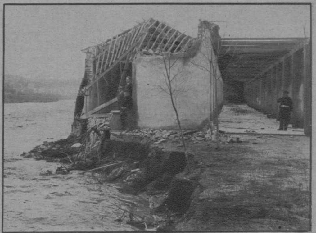
De los últimos temporales.—Estado en que, por la crecida del río Besós, ha quedado el «Grupo Escolar» de Santa Coloma de Gramanet.