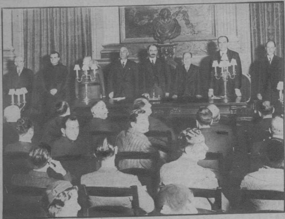
Barcelona.—Sesión inaugural del Congreso de la Sociedad de Física y Química, en la Academia de Ciencia, presidida por el gobernador civil, señor Moles, y otras personalidades.