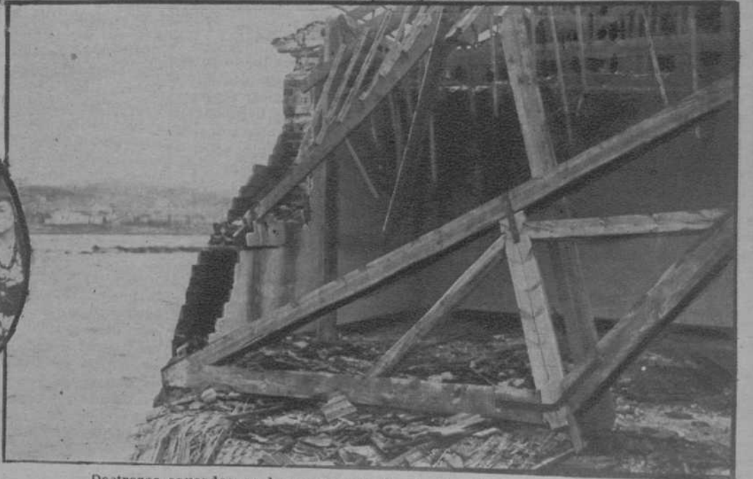
Destrozos causados en las casas, por la crecida del río Besós.