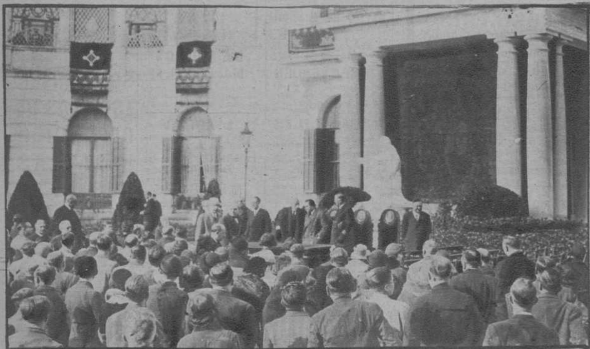
Barcelona.—Acto inaugural del Museo de Artes Decorativas, instalado en el Palacio de Pedralbes y presidido por el señor Maciá.