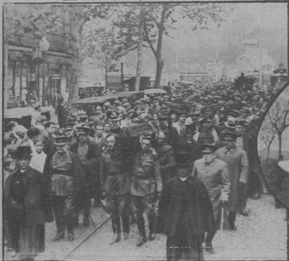
La fúnebre comitiva desfilando por la Ronda de San Antonio.