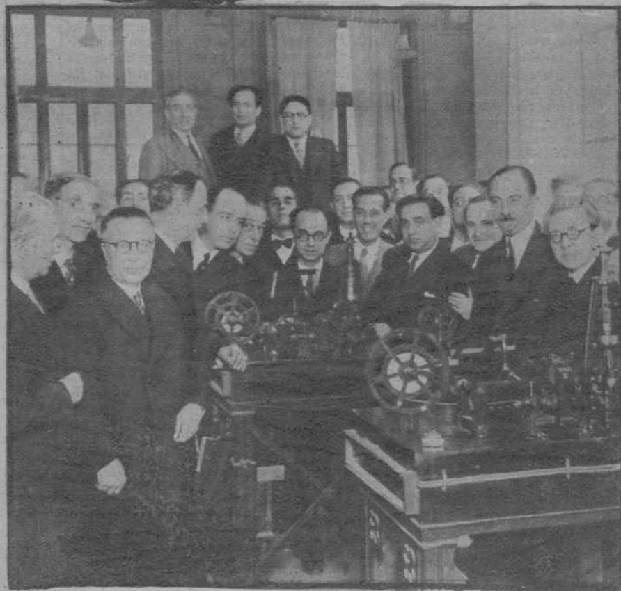
Las autoridades, recorriendo los departamentos de Telégrafos