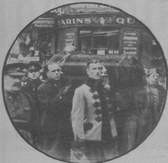
Barcelona.—Entierro del cadáver del general don Germán Brandeis. — El féretro, conducido a hombros de oficiales del Ejército