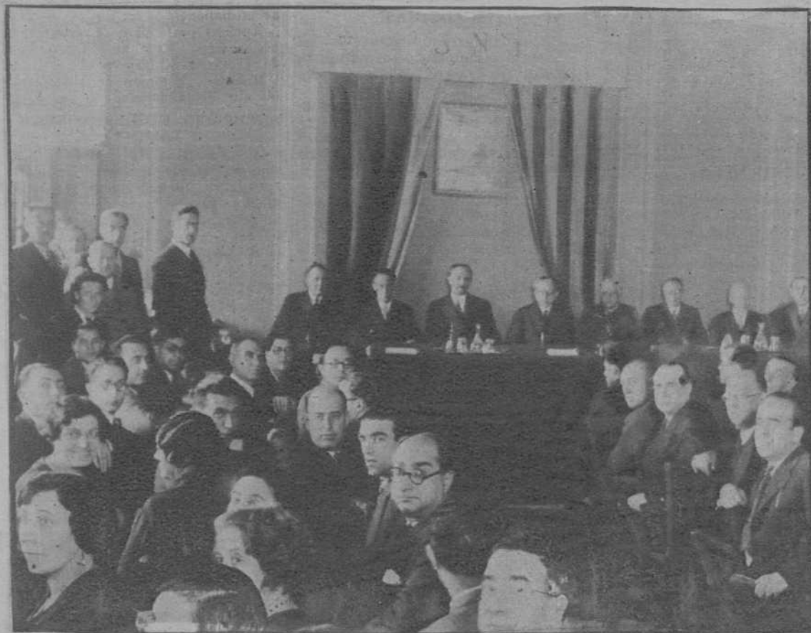
Clausura del II Congreso del Sindicato Nacional de Telégrafos, acto presidido por el alcalde, el gobernador y el presidente de la Audiencia