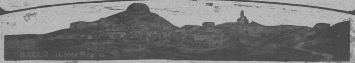
BAGUR (Costa Brava)

ENTRADA: Pasaje de la Merced, núm. 8 Teléfono 31518