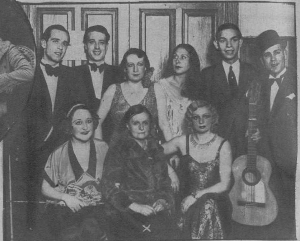
Madrid.—La que fué célebre estrella del arte frívolo, Olimpia d'Avigny (x), con las artistas que tomaron parte en la función celebrada a su beneficio, en el teatro Eslava.