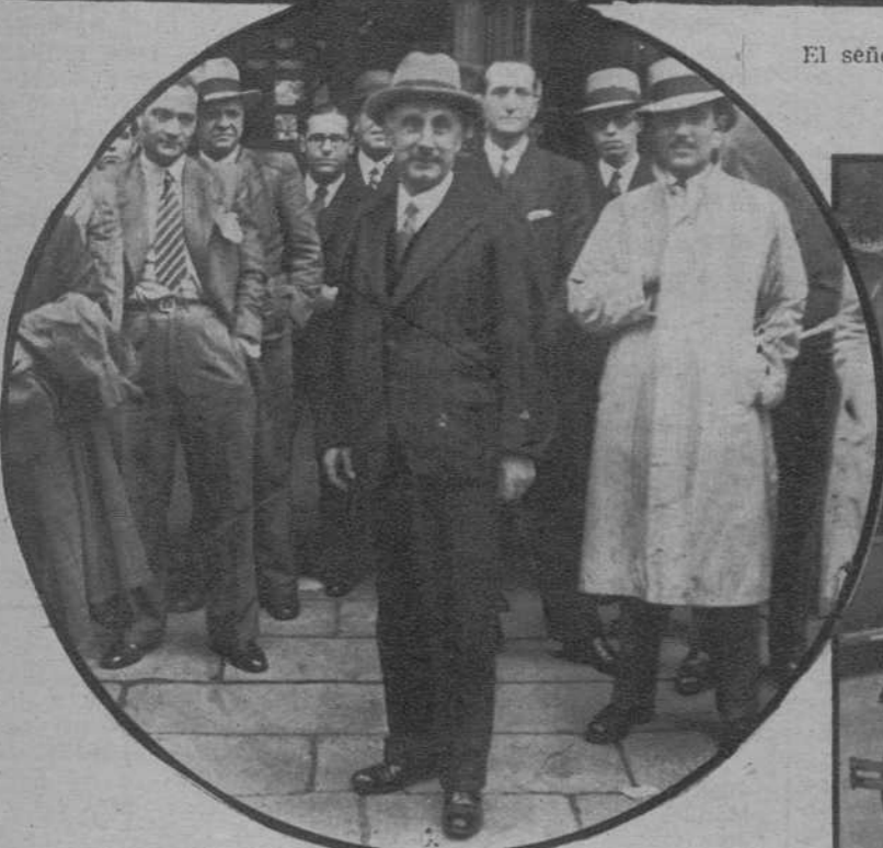
El ex ministro señor Ventosa, al salir del colegio donde emitió su voto.