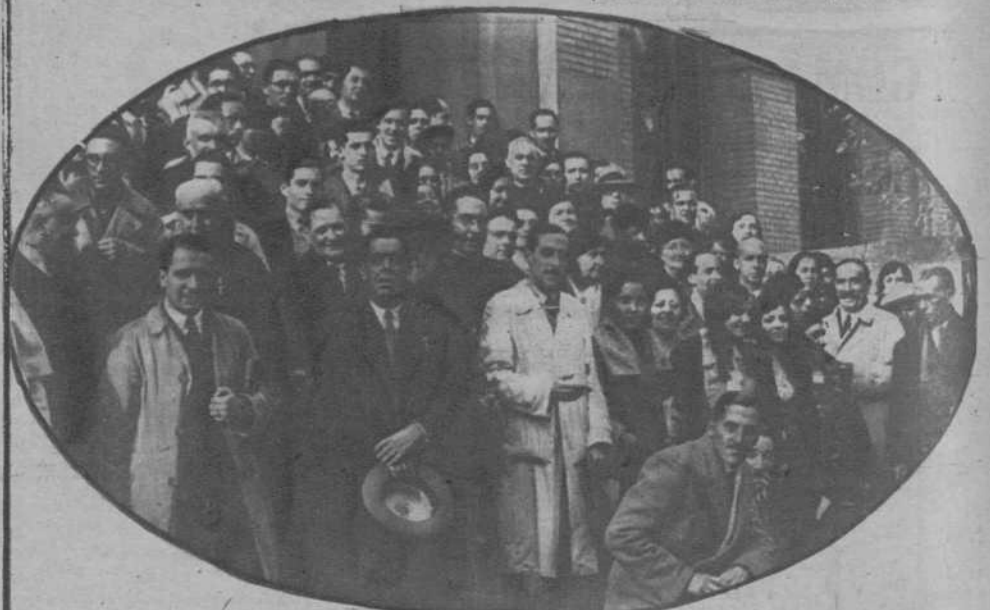
Zaragoza.—Peregrinos madrileños, en su visita a esta ciudad.