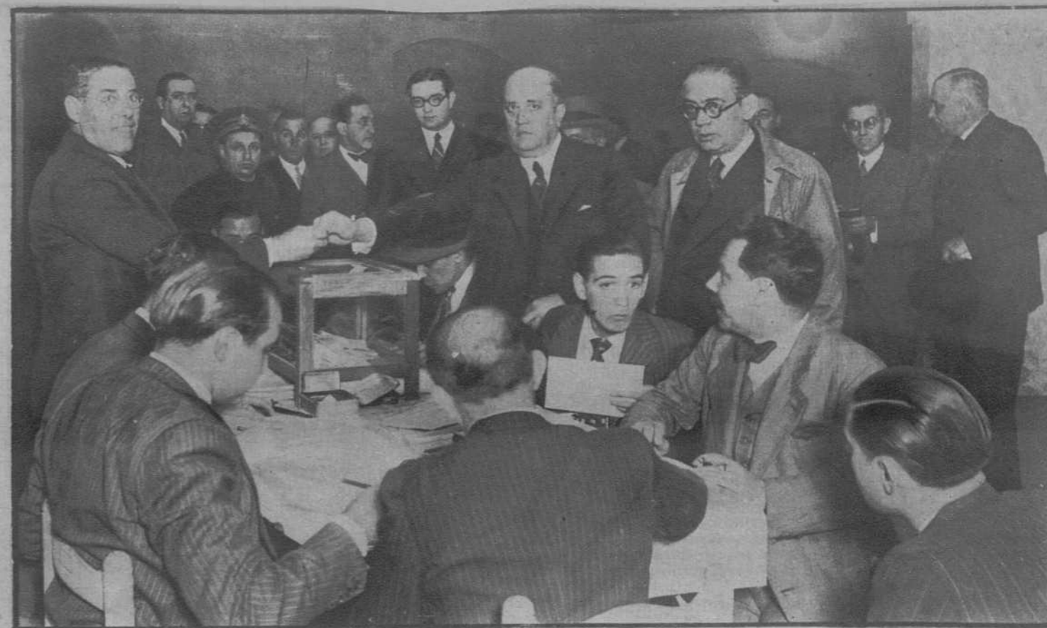
El presidente del Consejo Regional del Partido Radical, en el momento de emitir su voto.