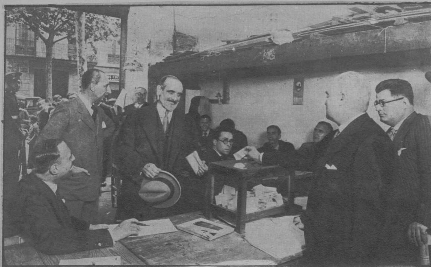
Don Francisco Cambó, emitiendo su voto.