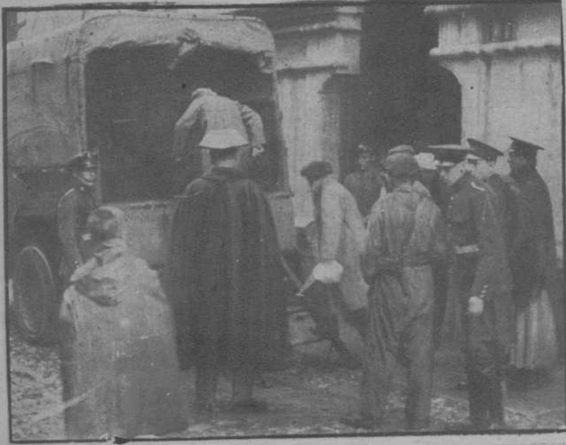
Cordoba.—Conducción a la cárcel de once obreros huelguistas de la fábrica y talleres de la Electro Mecánica.