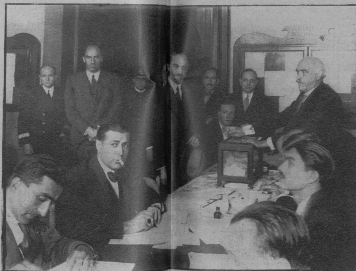
El gobernador civil, señor Mas, emitiendo su voto.