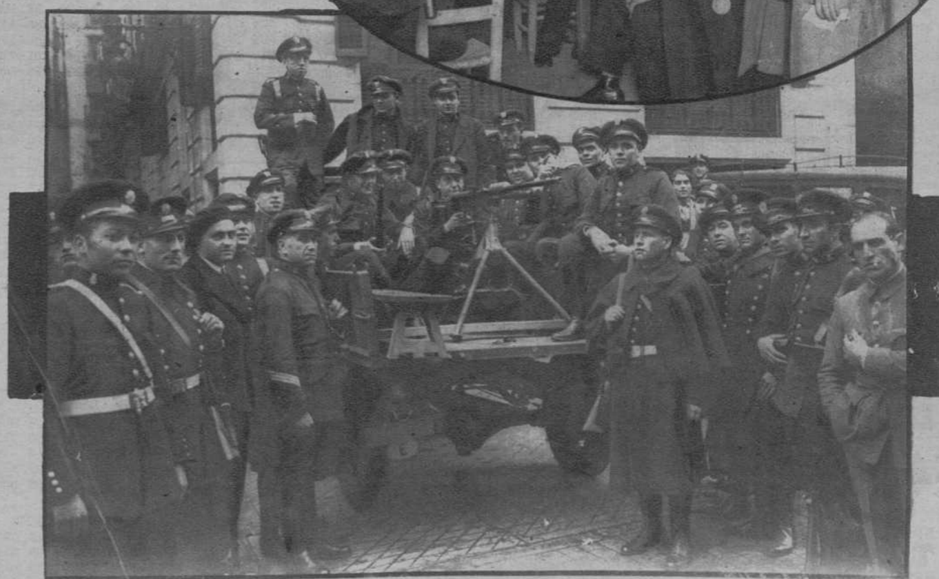
Fuerzas de Asalto, con las ametralladoras, preparadas para una carga.