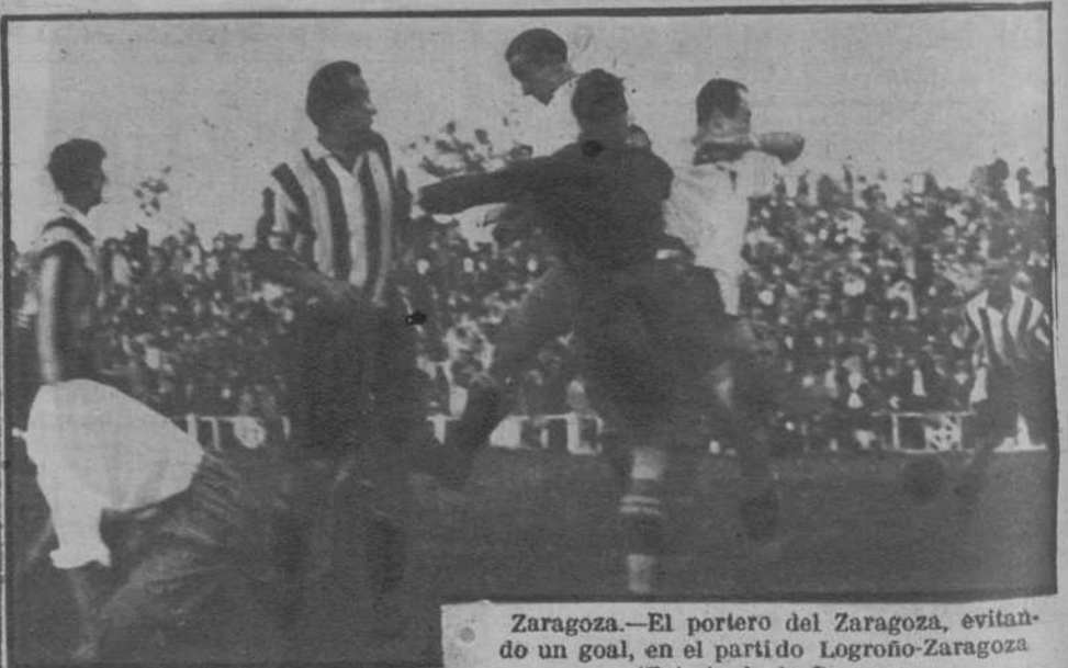
Zaragoza.—El portero del Zaragoza, evitando un goal, en el partido Logroño-Zaragoza.