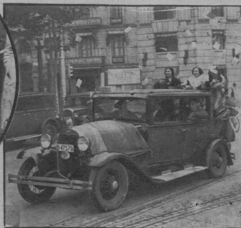
Un automóvil de los utilizados para la propaganda electoral