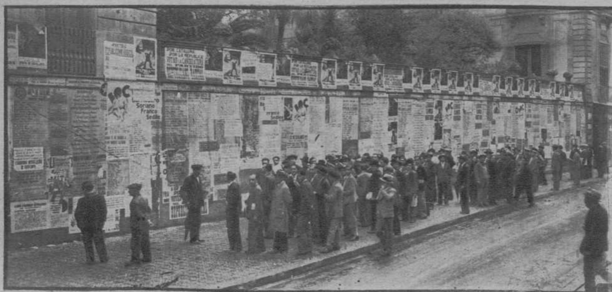
El público, estacionado ante una «cartelera» con profusión de candidaturas y arengas al cuerpo electoral.