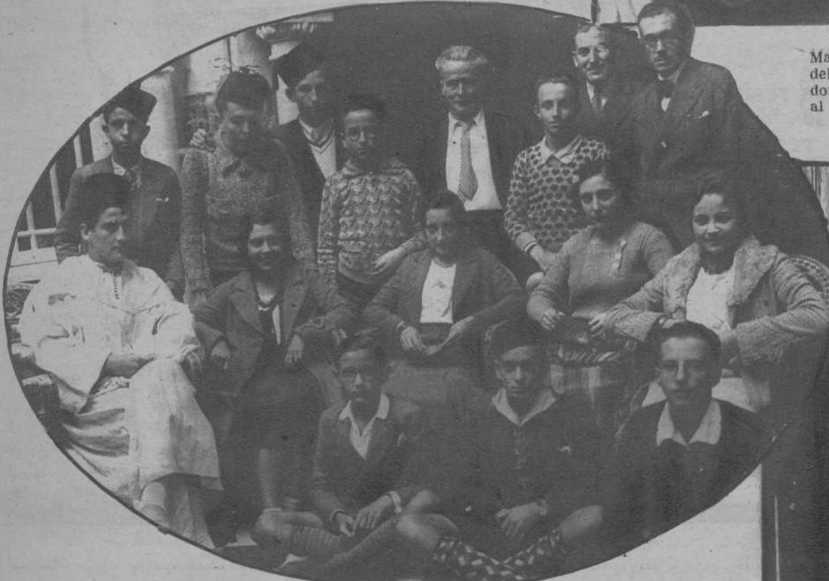
Cordoba.—Estudiantes tangerinos, en su visita a uno de los patios típicos.