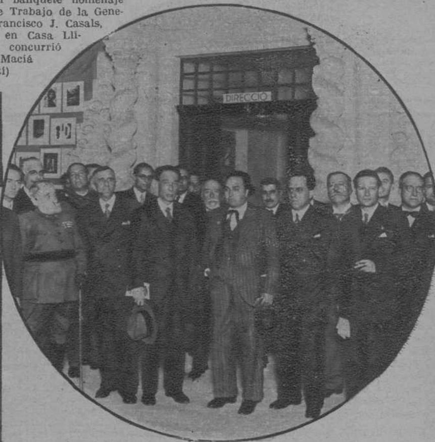
Las autoridades, en el acto inaugural.