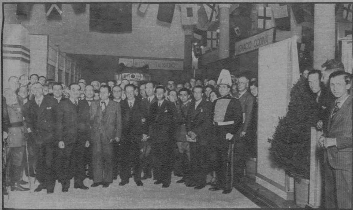
Inauguración de la Exposición de Radio.