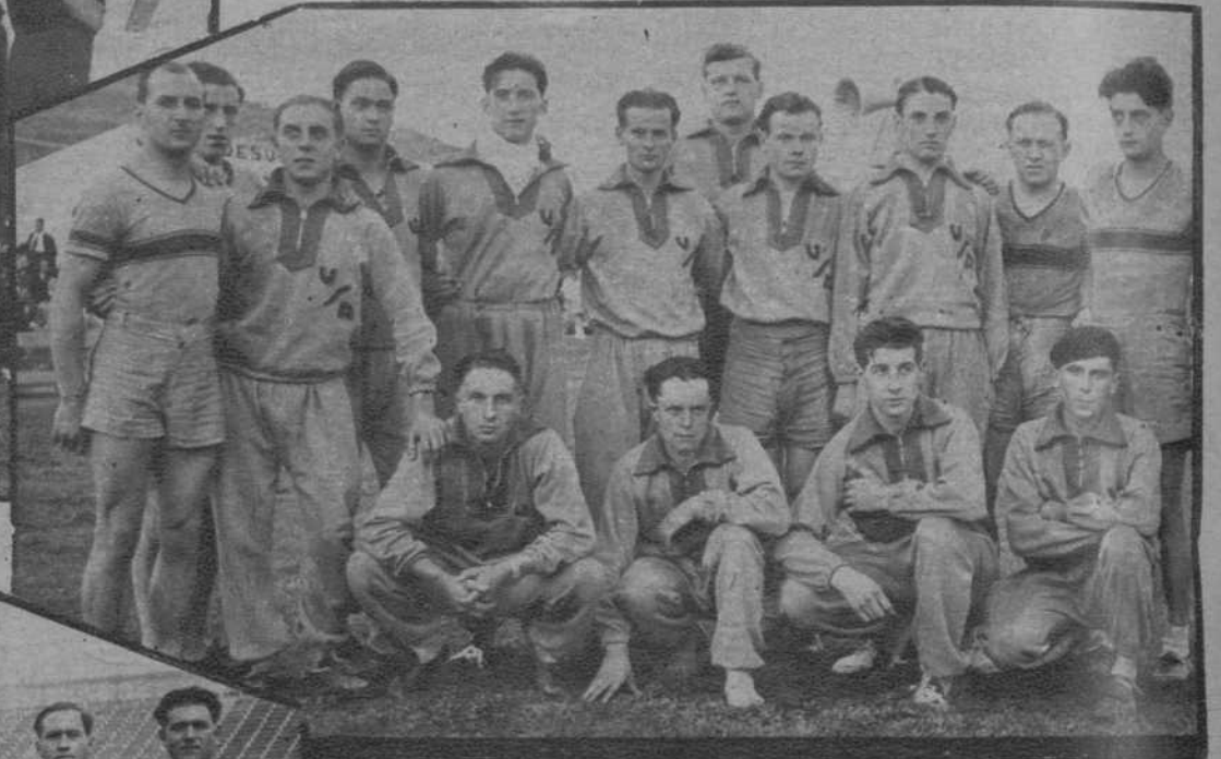
Badalona.—Equipo de la Unión Sportiva Albigoise, de Albi (Francia), que luchó en el Festival Atlético.