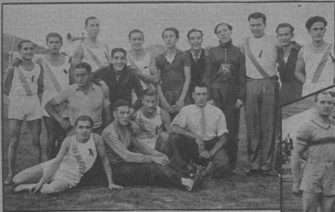
Badalona.—El equipo del F. C. Badalona, que tomó parte en el Festival Internacional de Atletismo.