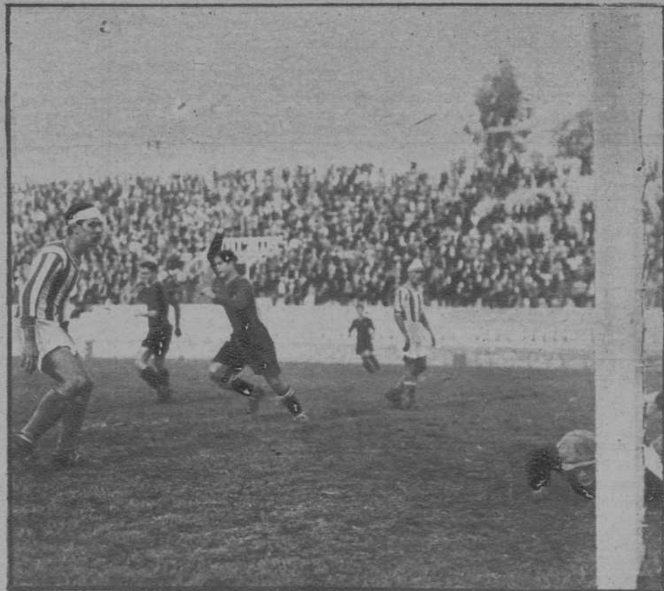
Barcelona.—El segundo goal del Barcelona en el partido Barcelona-Júpiter.