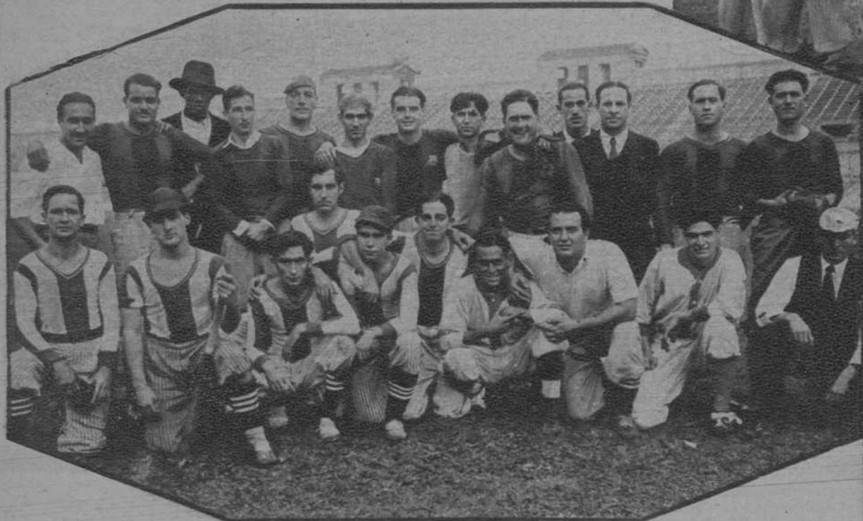
Los equipos de Base-Ball F. C. Barcelona y C. D. Español, que jugaron el final del Campeonato, resultando vencedor el Español.