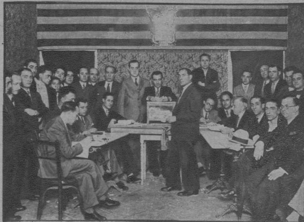
Antevotación celebrada en el «Ateneu Republicà Federal», de Gracia, para la designación de candidatos a diputados de la Generalidad.