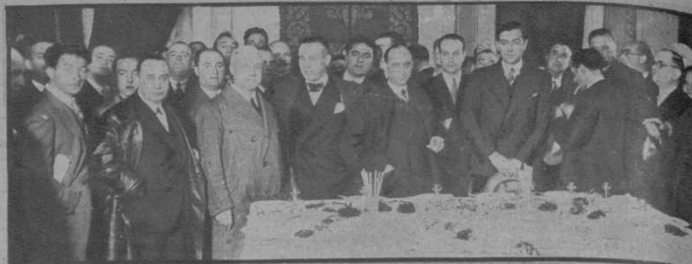
Lugo.—El ministro de la Gobernación, en la Diputación provincial, donde fué obsequiado