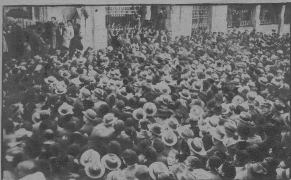
Lugo.—Aspecto del exterior del mercado durante el discurso del señor Casares Quiroga