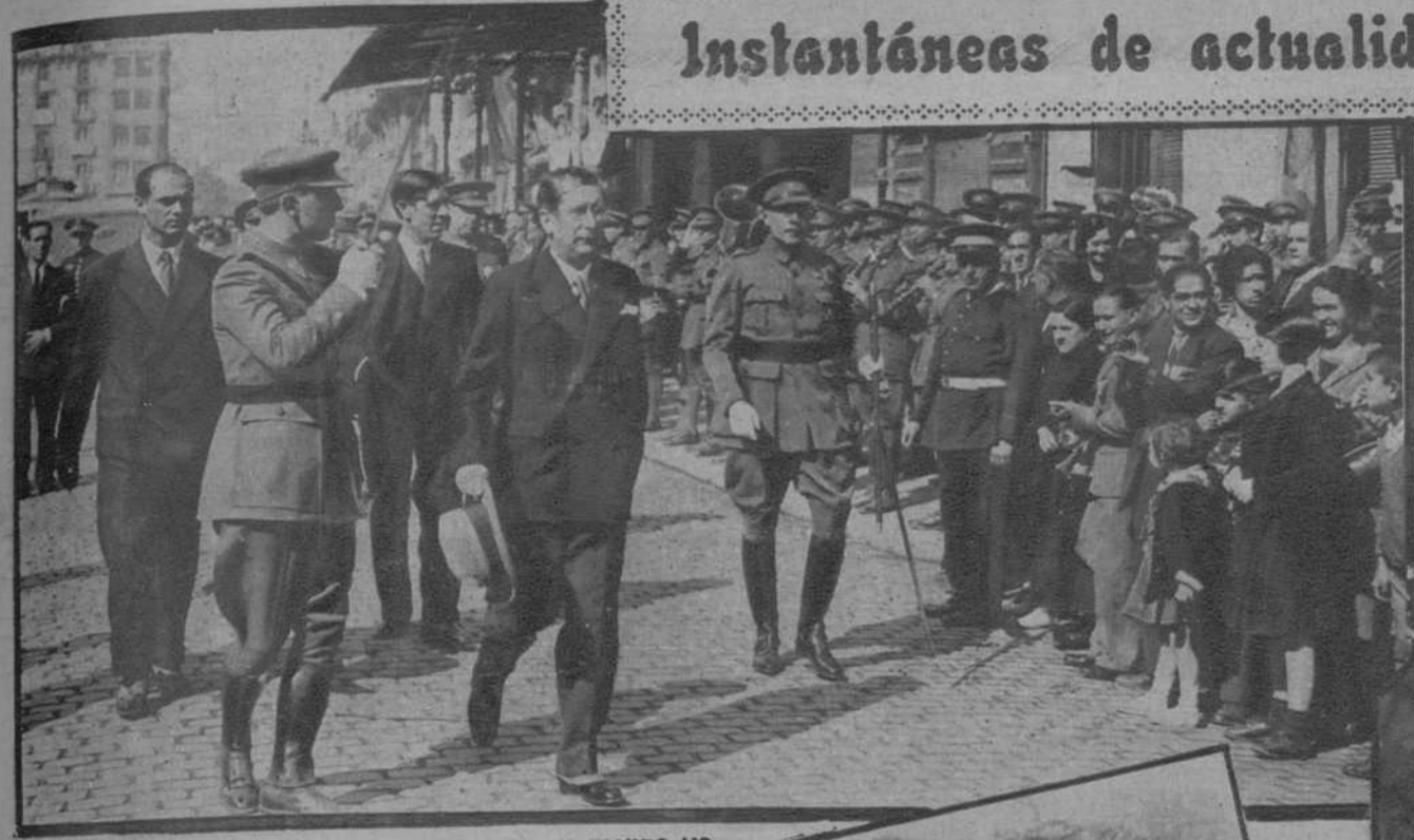
Zaragoza.—El ministro de Agricultura, don Marcelino Domingo, a su llegada, revistando las fuerzas que le rindieron honores.