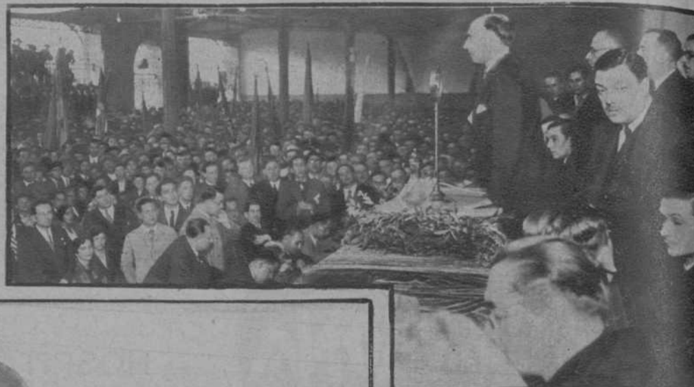
Lugo.—El ministro de la Gobernación, pronunciando un discurso en el acto de clausura de la Asamblea regional del Partido Republicano Gallego.