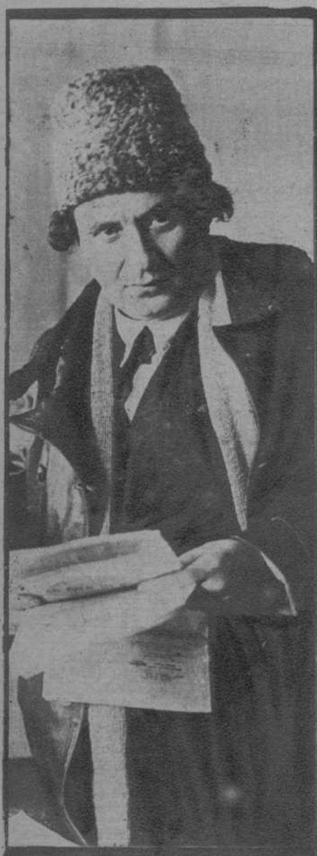
Zinovief, que ha sido expulsado del partido comunista ruso.