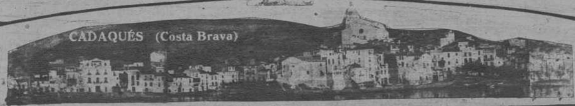
CADAQUÉS (Costa Brava)

REDACCIÓN DIRECCIÓN COMERCIAL Y ANUNCIOS Plaza de Cataluña, 9 - Tel. 14160 IMPRESA Y TALLERES MUNTANER, 49 ENTRADA: Pasaje de la Merced, núm. 8 Teléfono 31518