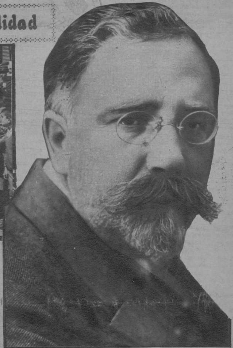
Kamenev, una de las veinte personalidades que han sido expulsadas del partido comunista ruso.