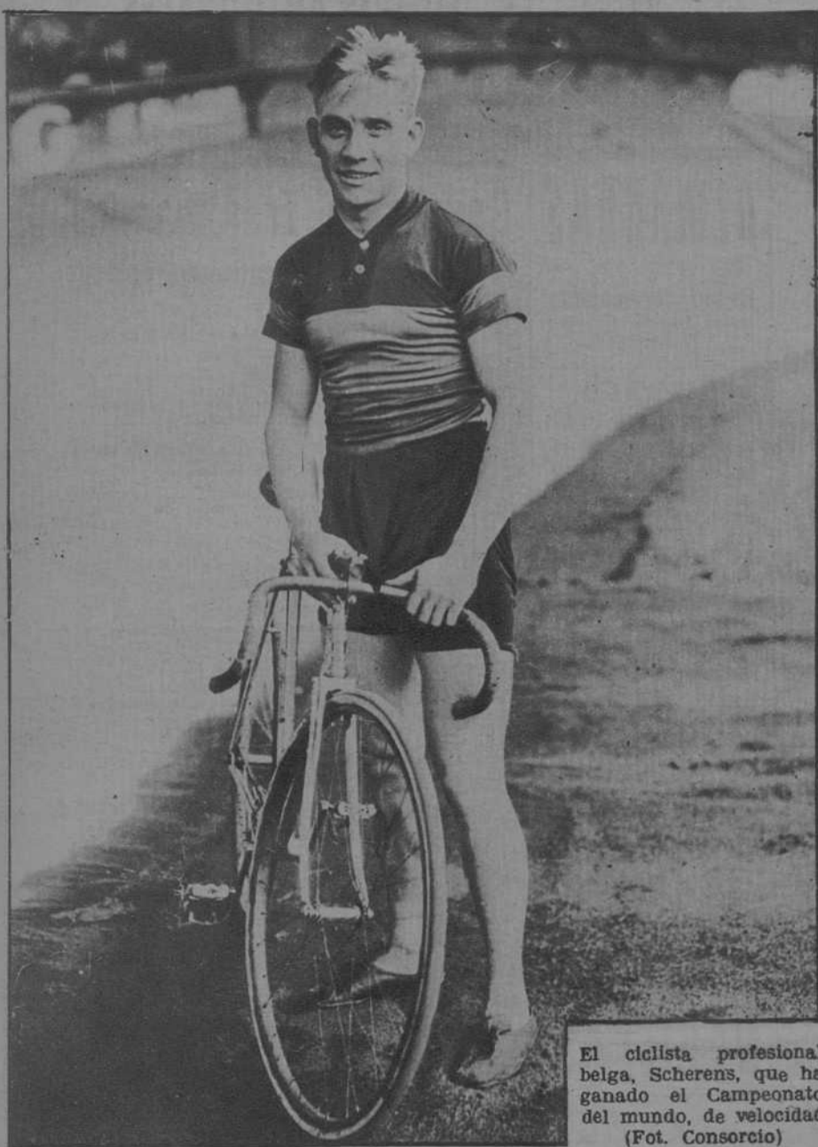
El ciclista profesional belga, Scherens, que ha ganado el Campeonato del mundo, de velocidad