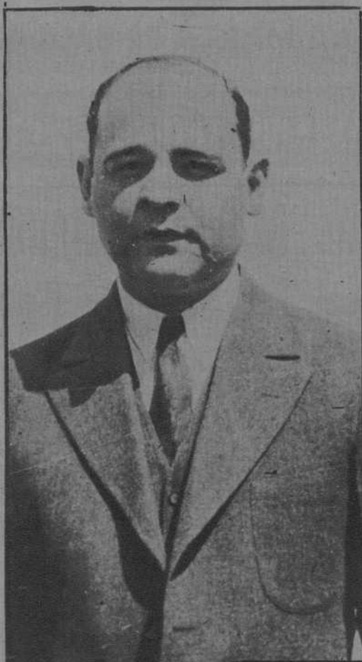
El general don Abelardo Rodríguez, que ha sido nombrado presidente de la República de Méjico.