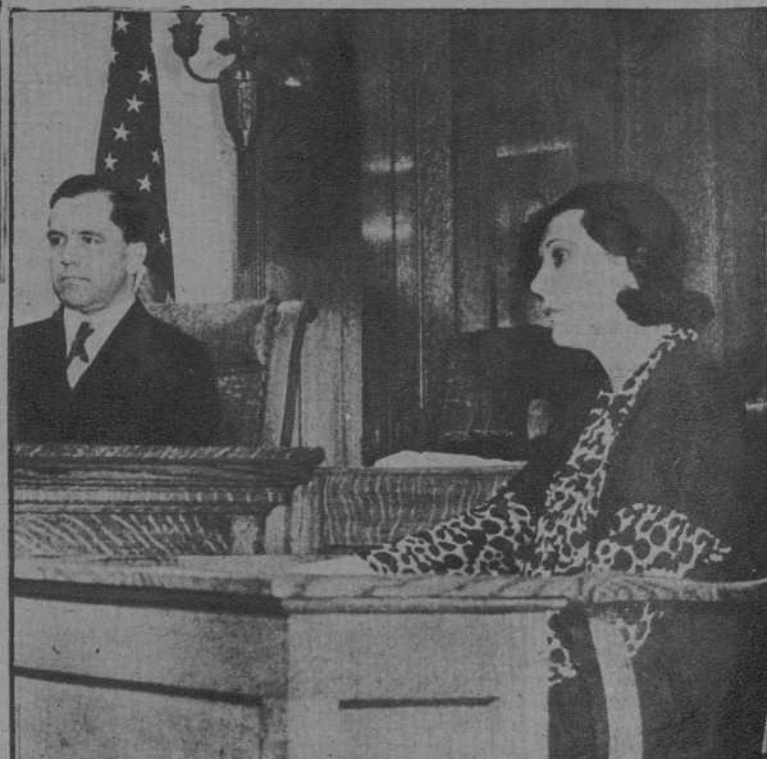
Lita Grey, que no ha logrado el fin que perseguía.