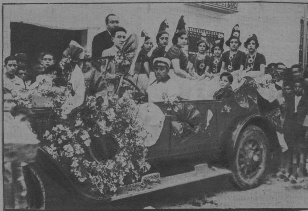
Automóvil adornado, al que se concedió el primer premio de coches