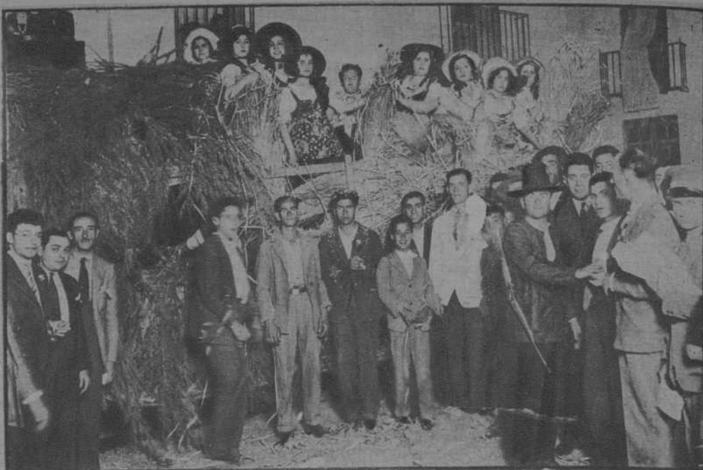
Carroza «Las segadoras», que obtuvo el primer premio de carrozas en la batalla de flores