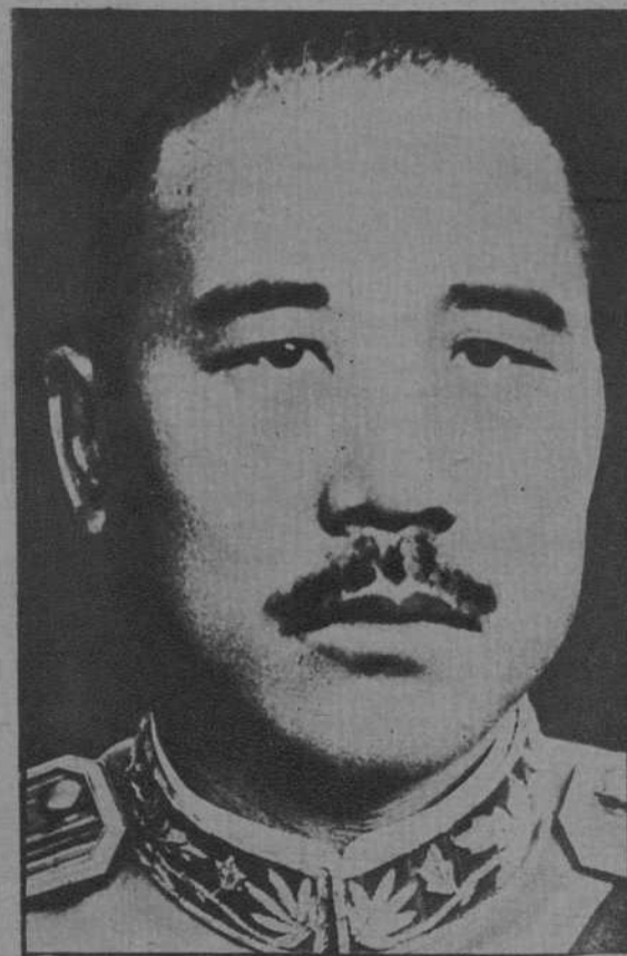
El general chino Chang Tsun, ex gobernador de Shantung, asesinado por el hermano de una de sus víctimas