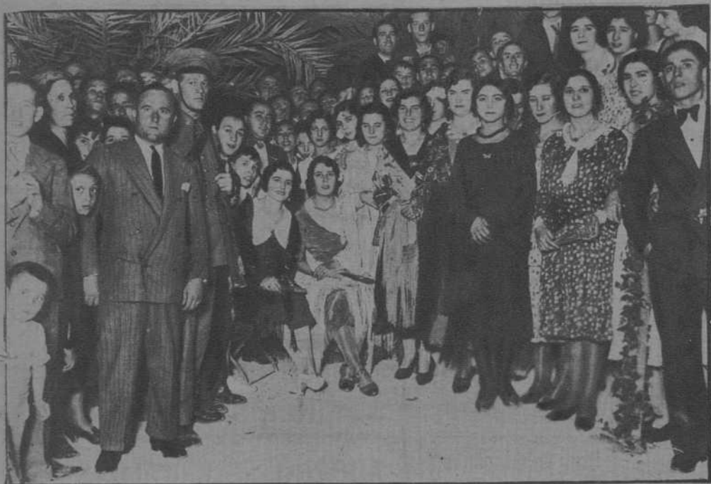
Verbena benéfica organizada por los ferroviarios

DE LOS FESTEJOS CELEBRADOS EN PRIEGO DE CORDOBA, EN HONOR DEL PRESIDENTE DE LA REPUBLICA