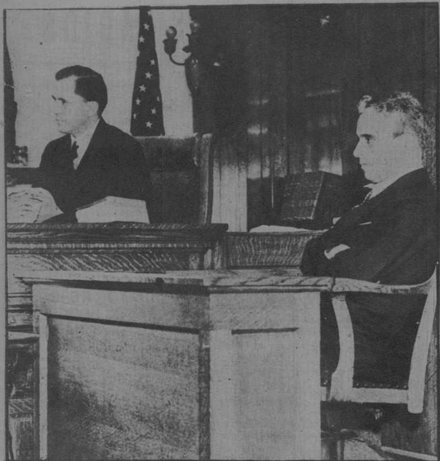
En Los Angeles ha tenido lugar un pleito de familia, que ha resuelto la Justicia a favor de Charles Chaplin, quien se oponía a los deseos de la que fué su esposa, de que los hijos del matrimonio se dedicaran a artistas de cine. He aquí al famoso cineasta, durante el juicio