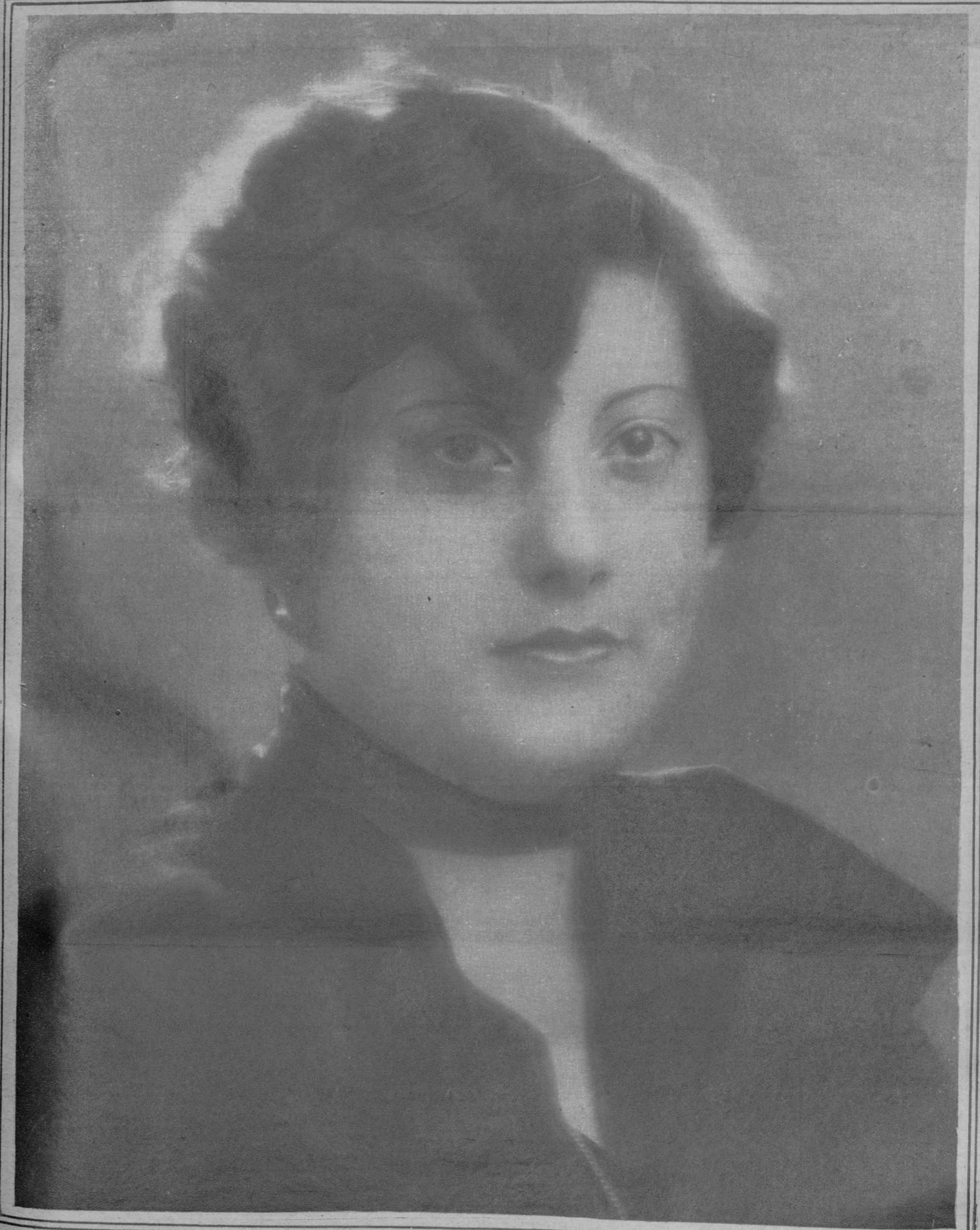
María Espinalt, la eximia soprano catalana, que antes de ingresar en la Compañía del Teatro Lírico Nacional, de Madrid, celebrará en el Olympia unas funciones de despedida, la primera de las cuales tendrá lugar hoy, con la representación de la ópera «Marina»