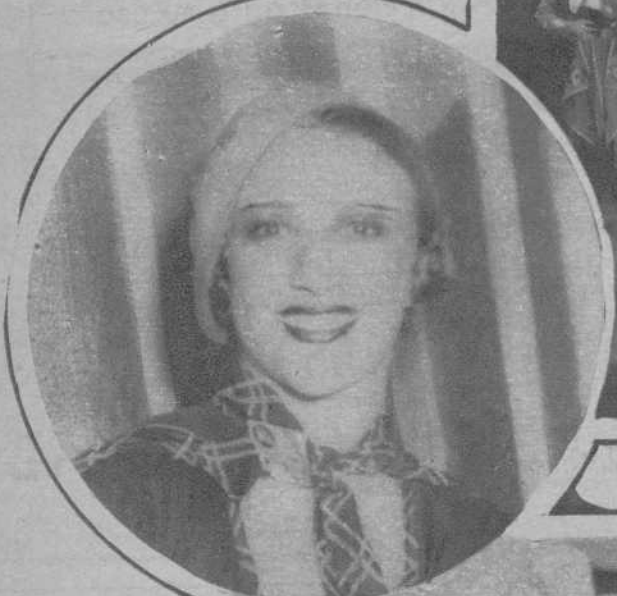
Liana Gracián, famosa bailarina, del Teatro Tivoli. — (Fot. Domínguez)