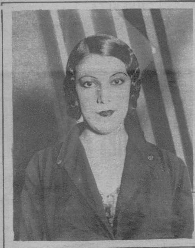
Amparo Sara, bellísima artista, del Teatro Tivoli.