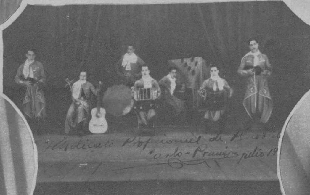
«Calo-Prunés», orquesta típica