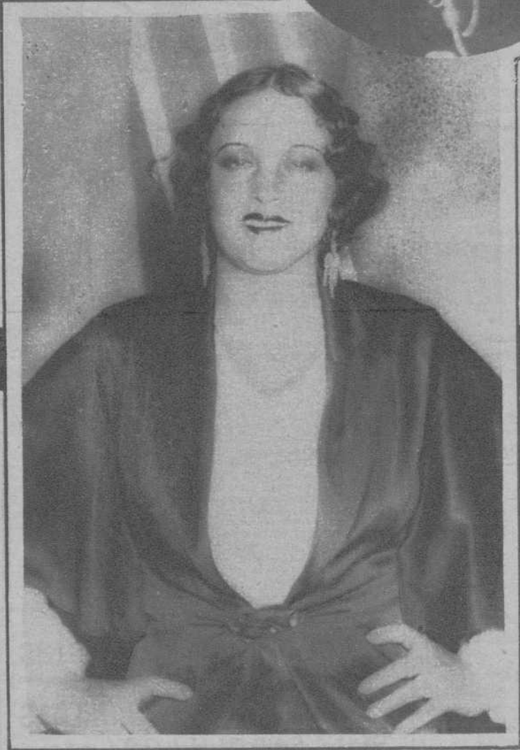
Margarita Carvajal, genial «vedette», que actúa en el Teatro Tivoli