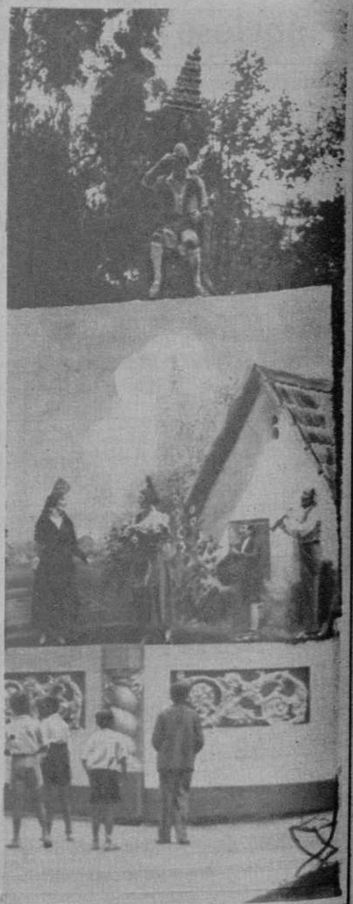
Madrid.—La falla «Valencia saluda a Madrid», que ha sido quemada en la fiesta organizada por el Círculo de Bellas Artes, celebrada en el Retiro.