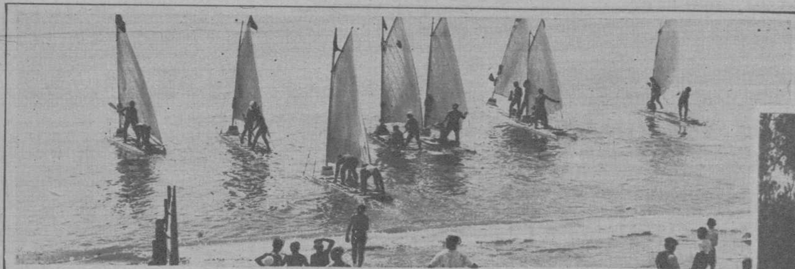
Salida de los patinetes a vela, que participaron en la regata Barcelona-Arenys de Mar, organizada por el «Club Náutico Atlético», de la Barceloneta