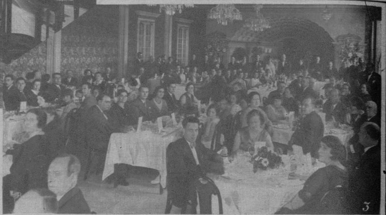
1.—El solemne momento de la bendición nupcial. 2.—Los nuevos esposos, después de su enlace. 3.—Banquete de bodas, al que asistieron ciento sesenta comensales, celebrado en el Restaurant Miramar