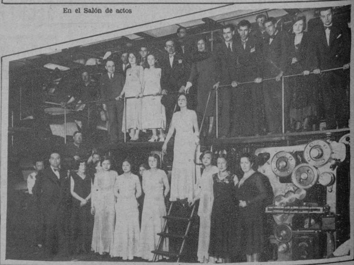
En la nave de rotativas