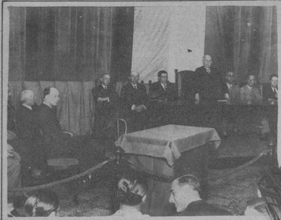
Tarresa.—En la Escuela Industrial. Con ocasión de la visita que el miércoles realizaron a dicho Centro los profesores y alumnos del Instituto de Química y Electricidad de Toulouse, el director del mismo, Mr. Sabatier, dió una interesante conferencia, un momento de la cual recoge la fotografía.